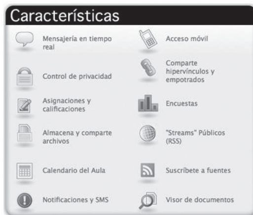
Figura 1. Herramientas y recursos digitales de la red social “Edmodo”

Esta red social tiene su fundamento en el servicio de microblogging mas extendido “Twitter” para el que también existen aplicaciones educativas aunque sin la seguridad de uso con menores de edad que ofrece “Edmodo” (Chen y Chen, 2012; Junco, Elavsky y Heiberger, 2012). “Edmodo” permite leer, escribir y difundir mensajes cortos de hasta 140 caracteres. Esta red social educativa integra herramientas de microblogging, blog y aula virtual; lo que permite una interactividad muy alta entre alumnado y profesorado. (Ting, I-Hsien, Hui-Ju Wu y Tien-Hwa Ho, 2010). El profesorado puede mandar mensajes a sus alumnos, individual o colectivamente, para informarles sobre eventos, enlaces interesantes, textos u otro contenido que pueda ser útil para el proceso de enseñanza-aprendizaje. El alumnado que accede dispone de una cuenta propia que le permite establecer un diálogo con sus profesores, manteniendo su información totalmente ordenada, registrada y segura ya que los estudiantes ni siquiera necesitan cuenta de correo, solo es necesario un código que el profesorado le proporciona. También les permite la creación de un calendario donde se van programando todas las tareas académicas, para que todos los usuarios —padres, madres, profesorado y alumnado— puedan consultarlo siempre que lo necesiten. Entre las características más destacadas se encuentran: