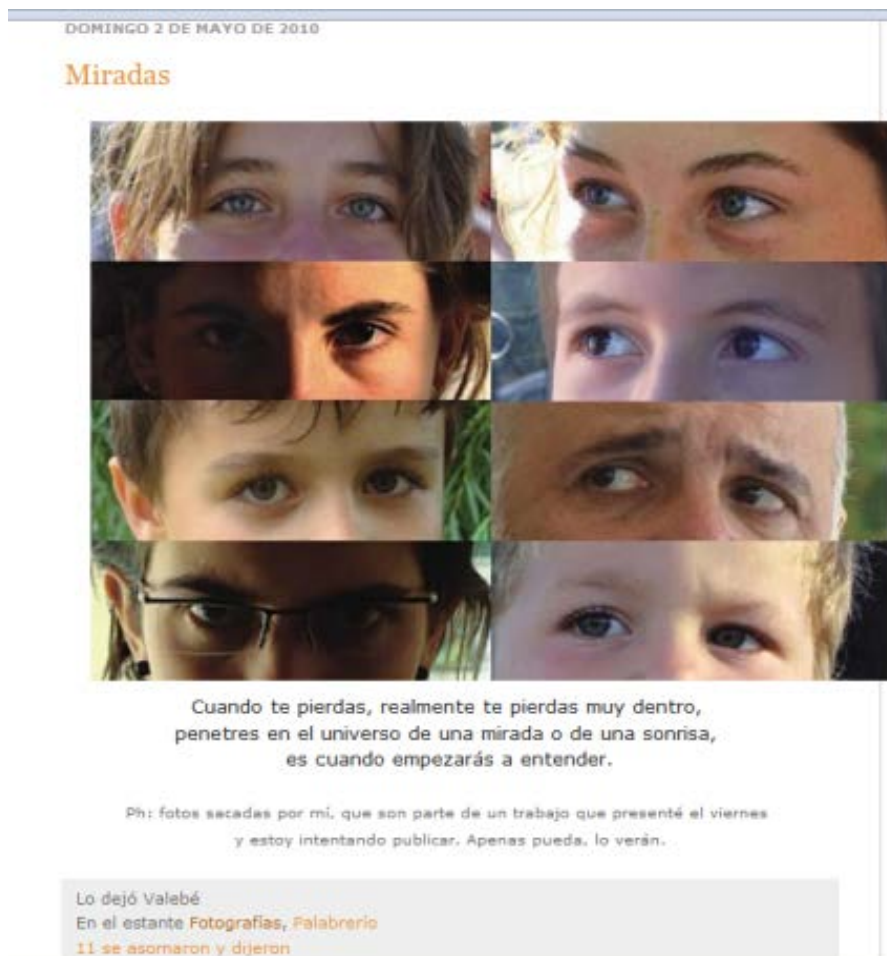
Imagen 4. Categoría “Miradas”

hay un Otro implicado en la forma del “vos” o aludido en las situaciones representadas.