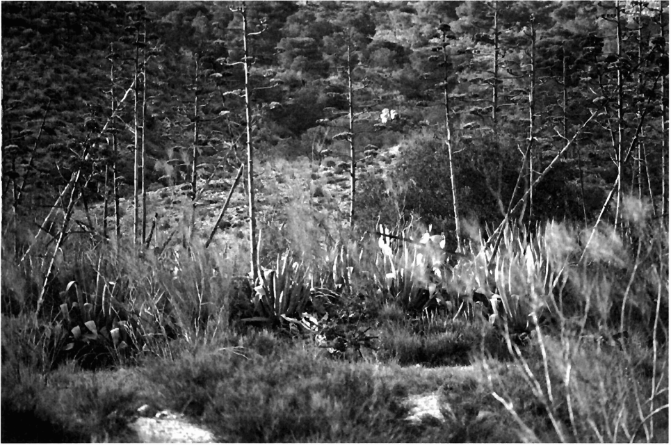
Grupo de arzabaras ( Agave americana ). Destacan un buen número de arzabarones, de varias cosechas distintas.