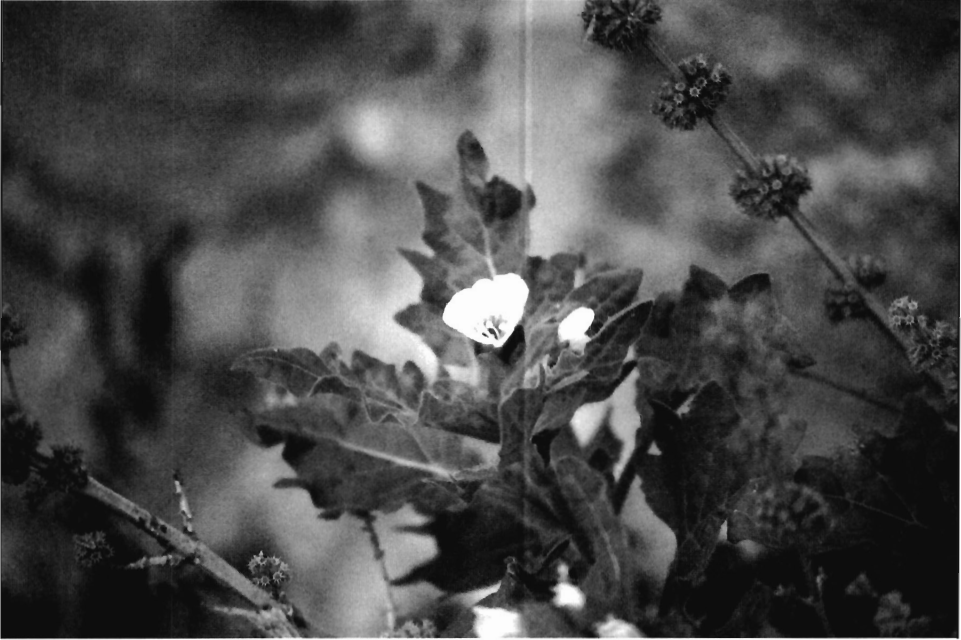
Tallo con flor del beleño ( Hyoscyamus albus ), solanácea de amplia utilización mágico-medicinal.

con especies de un reconocido amargor, al contener gran cantidad de azúcares como glucosa, fructosa y sacarosa 8 .