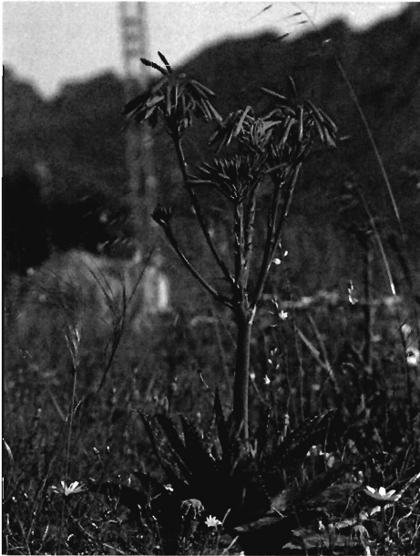
Ejemplar de Aloe saponaria fotografiada en el paraje de Galifa. En toda la comarca se conoce a esta especie como arzabarica dulce y también como arzabarica de sabañones, pues su savia se utilizaba para frotar estos males.