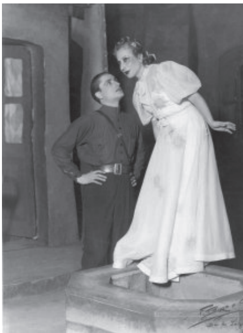
Figura 4: Margarita Xirgu representando Angelica en Buenos Aires, 1938