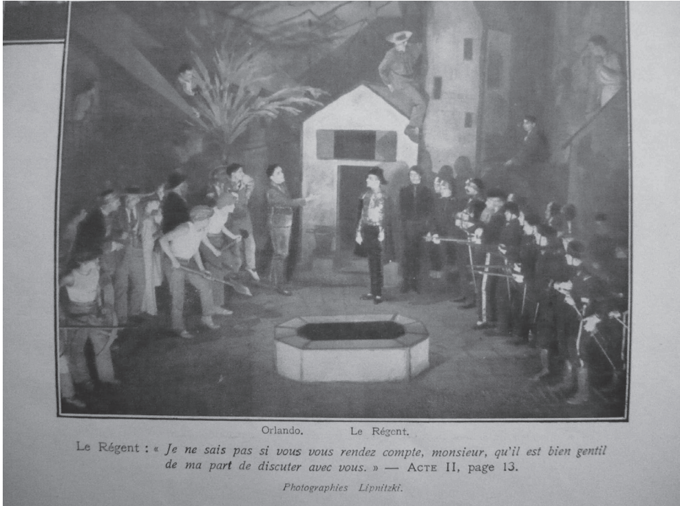
Figura 2: Escena acto II de Angelica , Compañía Pitoëff, París 1936

En efecto, la compañía Pitoëff, según ha estudiado Ranzini 11 , optó por una puesta en escena sobria y esencial, de corte cubista; subrayando el carácter simbólico de los personajes, pero adaptando la dimensión fantástica del drama en una atmósfera realista. He aquí una fotografía de la representación aportada en el libreto original de Angelica :