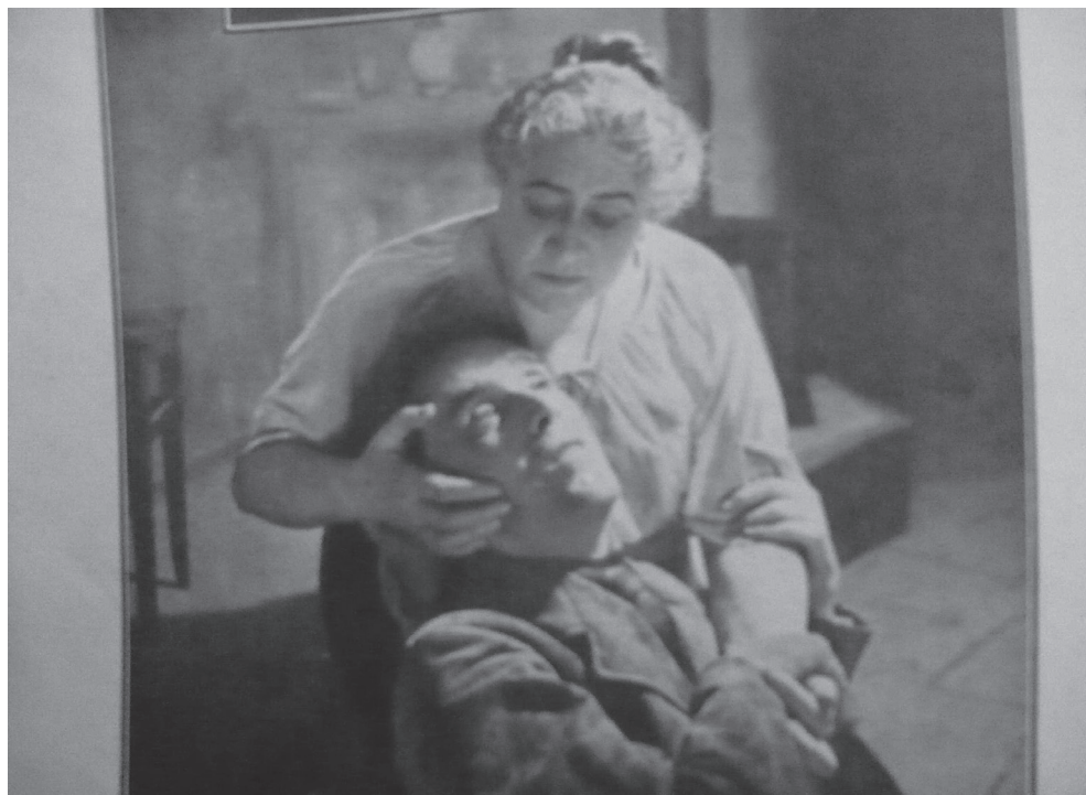
Figura 3: Muerte de Orlando, interpretado por G. Pitoëff, en brazos de la patrona del café. París 1936

Tanto en el ambiente cultural de Turín – sede de la revista Il Baretto –, como en el florentino – con Solaria –, los Ferrero-Lombroso se encontraban alineados en contra del fascismo: a los mismos círculos de intelectuales pertenecían Einaudi, Debenedetti, Leone Ginzburg, Giovanni Amendola y los citados Salvemini, Carlo y Nello Rosselli y Gobetti. Además Guglielmo Ferrero en 1924 había firmado el manifiesto para la creación de la Unione nazionale delle forze liberali e democratiche ; movimiento defensor del Estado democrático que él mismo dirigiría hasta su disolución junto a algunas de las grandes figuras políticas de la izquierda italiana: Mario Berlinguer, Roberto Bencivenga, Ugo la Malfa y Mario Vinciguerra.