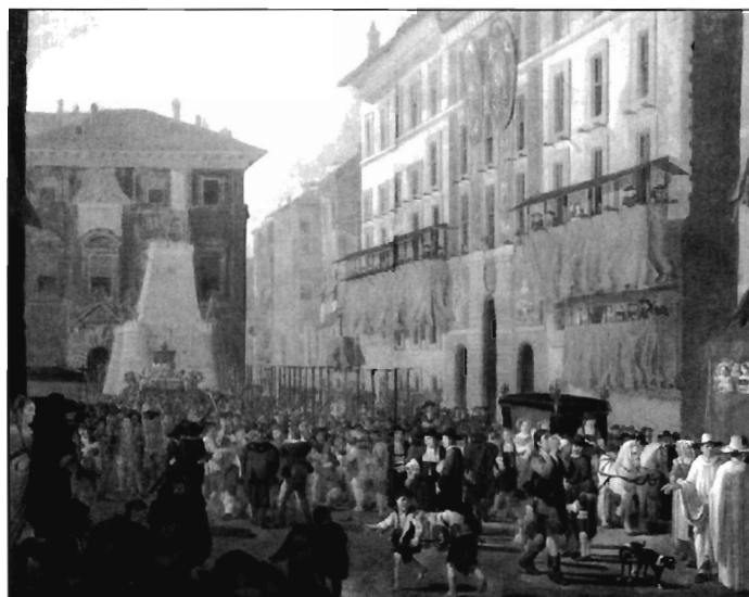
FIGURA 2. Fiesta en la embajada de España en Roma por el nacimiento del infante D. Carlos, 1662. Oleo sobre tabla. Willem Reuter, Viena, Gemäldegalerie der Akademie der bildenden Künste.

La denominación de castillo de fuegos artificiales, que seguimos empleando actualmente, deriva directamente de estas estructuras barrocas que como la anteriormente descrita simulaban imponentes castillos, y cuya finalidad era servir de soporte a los materiales específicos con los cuales se obraría la magia y el espectáculo. Debido a lo desconocidas y complicadas que pueden resultar estas descripciones, incluimos dos ilustraciones que nos pueden ayudar a comprender estas creaciones. La figura 1, si bien se trata del boceto del castillo de fuegos artificiales erigido por la ciudad de Valencia para la proclamación de Carlos IV en 1789, inserto en el Libro de Instrumentos, D-166 (1789), fol. 61r, conservado en el Archivo Municipal de Valencia, y que nosotros hemos tomado del libro escrito por D a M a Pilar Monteagudo Robledo El espectáculo del poder. Fiestas Reales en la Valencia Moderna 12 , nos puede ayudar a formarnos una idea mas clara de estas obras. Con las modificaciones pertinentes, su visión nos procura un acercamiento gráfico a las que por aquellas fechas fueron recreadas y disfrutadas en Murcia, y de las que no hemos podido encontrar más que descripciones escritas. De igual modo puede resultarnos útil el cuadro ejecutado por Willem Reuter en 1662, figura 2, que nos muestra la envergadura de estas