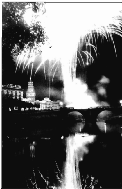
FIGURA 3. Apoteosis Entierro de la Sardina. Murcia. A.M.M.

Es esta la pirotecnia que conocemos, y que en tantas fiestas ha impresionado nuestra retina con esas luces multicolores, que son dibujadas en el telón oscuro de la noche al hacer explosión los numerosos cohetes que la pólvora hace ascender a gran altura. Apreciamos la gran diferencia que existe entre la pirotecnia aérea que disfrutamos actualmente en nuestras fiestas, y aquellos espectáculos iconográficos que cobraban vida mediante una grafía de fuego inscrita en un bastidor.