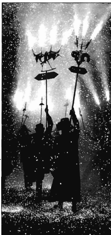
FIGURA 5. Entierro de la Sardina. Murcia

El chispero, los hachones y las bengalas son instrumentos de fuego empleados con profusión durante el desfile o Entierro de la Sardina celebrado en Murcia cada primavera. Las bengalas, son largos y delgados cilindros que producen tan sólo color. Las hay de todos los colores, y su duración es de unos cinco minutos. Los hachones son las antorchas o fuego con que los hachoneros desfilan junto a las carrozas iluminando la carrera, como podemos ver en la fig. 4. En ella quedó recogido el Entierro a su paso por Trapería en el año 1929.