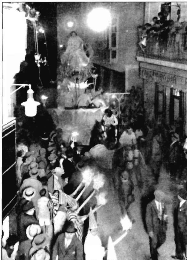
Figura 4. Entierro de la Sardina, Murcia 1929. Revista Flores y Naranjos Año II Núm. 23.

En la pirotecnia todo es química. El peligro que suponía la manipulación y posterior explosión de estos productos, hizo que con el paso del tiempo los más peligrosos fueran prohibidos y se buscaran sustancias cuyo uso implicara menos riesgos, por ejemplo, el clorato fue sustituido por el perclorato. Otros cambios tuvieron como objetivo el logro de una mayor calidad y espectacularidad, como fue el uso de goma acroide que proporciona más brillo al color, en vez de la goma laca que se utilizó años atrás. La pólvora es el motor de la pirotecnia, pero sólo sirve para impulsar, es decir, provoca la propulsión que hace que el cohete suba. La explosión y el ruido, son producidos por el aluminio y el perclorato. Cada color requiere la combinación