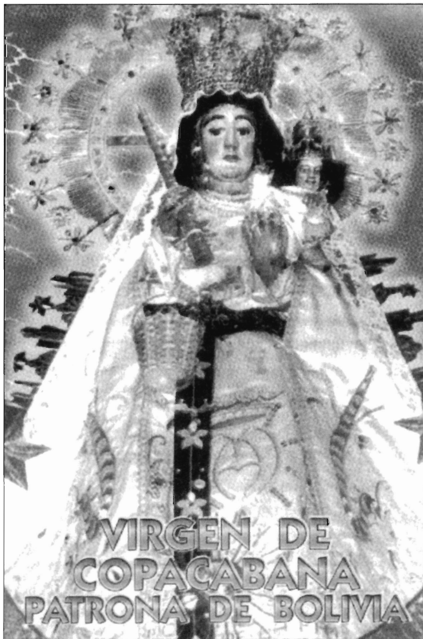
LÁMINA 2. Bolivia. Imagen Vestida de N ra . S ra . de Copacabana realizada por Francisco Tito Yupanqui.