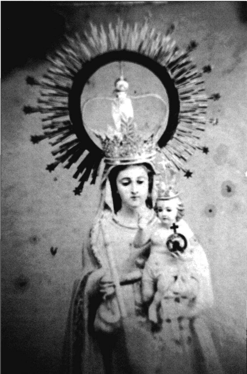
LÁMINA 8. Rubielos Altos. Detalle de la Antigua imagen de N. a . S. a . de Copacabana. (Fotografía anterior a 1936).