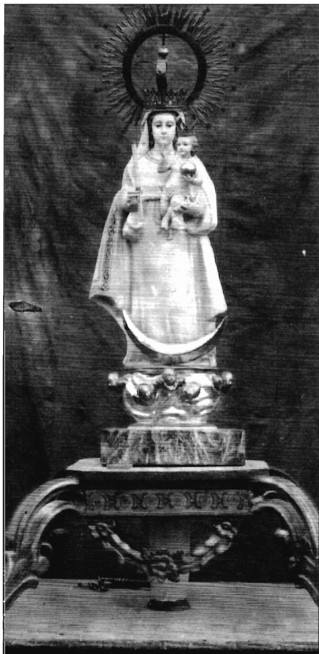
LÁMINA 7. Rubielos Altos. Antigua imagen de N ra . S ra . de Copacabana. (Fotografía anterior a 1936).