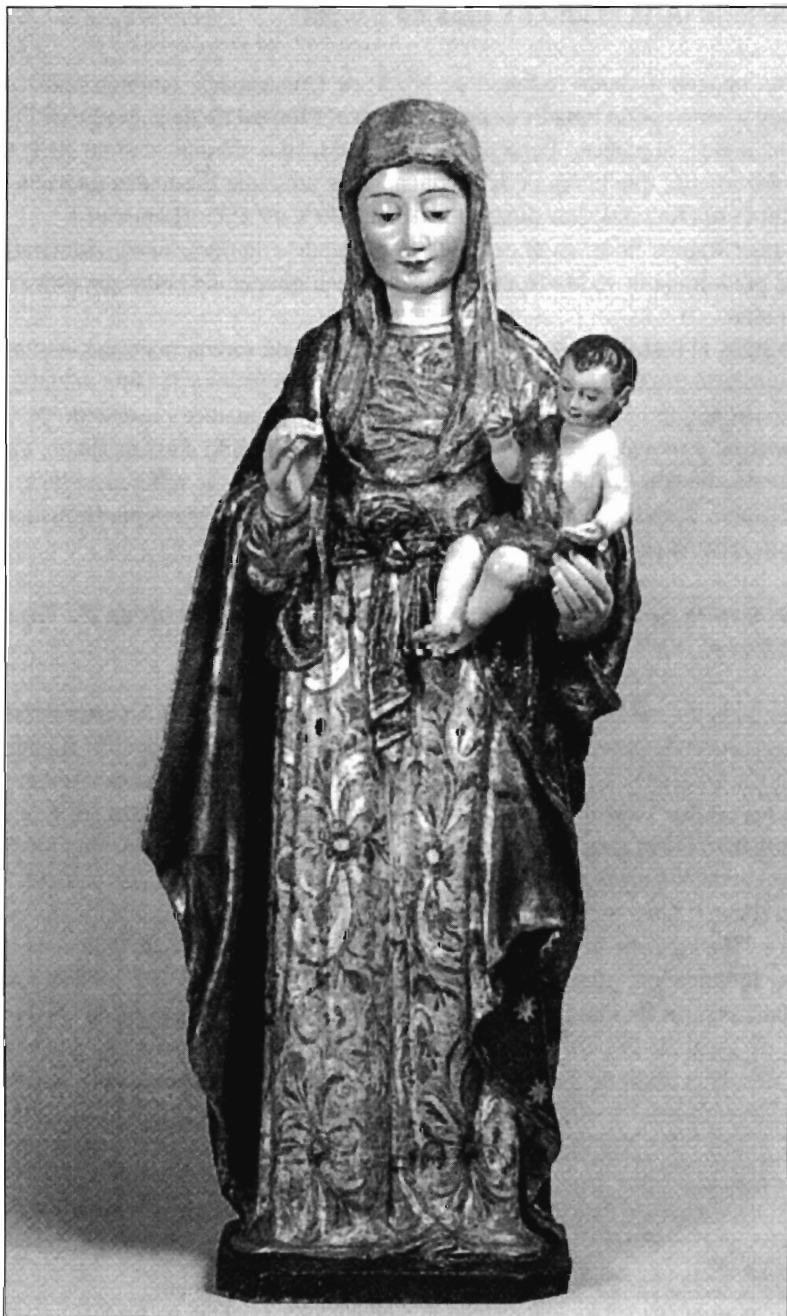
LÁMINA 5. Sevilla. Monasterio de la Madre de Dios. Imagen de N ra . S ra . de Copacabana. (Fotografía: los siglos de oro..., pág. 349).