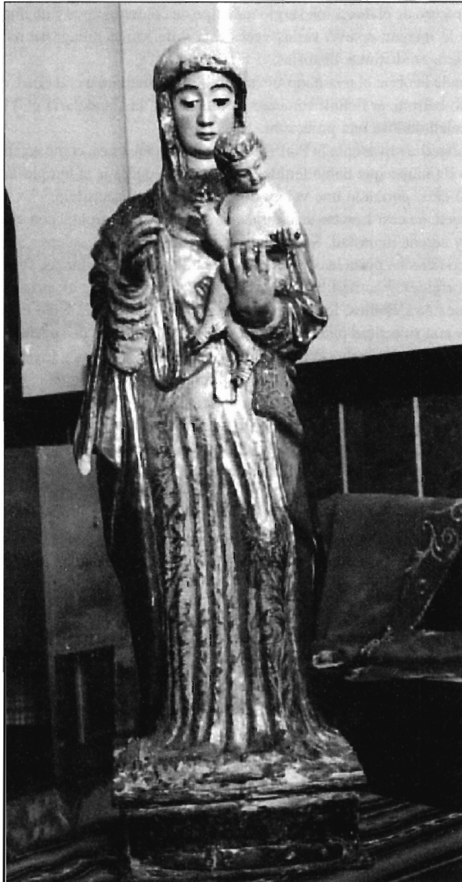
LÁMINA 1. Bolivia. Imagen de N ra . S ra . de Copacabana realizada por Francisco Tito Yupanqui.