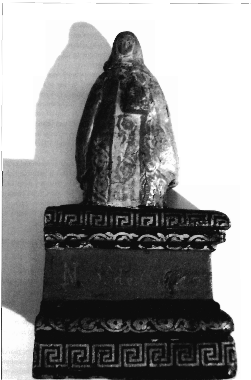
LÁMINA 6. Ntra. Sra. de Copacabana, Ermita de Ntra. Sra. del Encinar. Ceclavín (Cáceres). (Fotografía: Francisco B. Luján López).