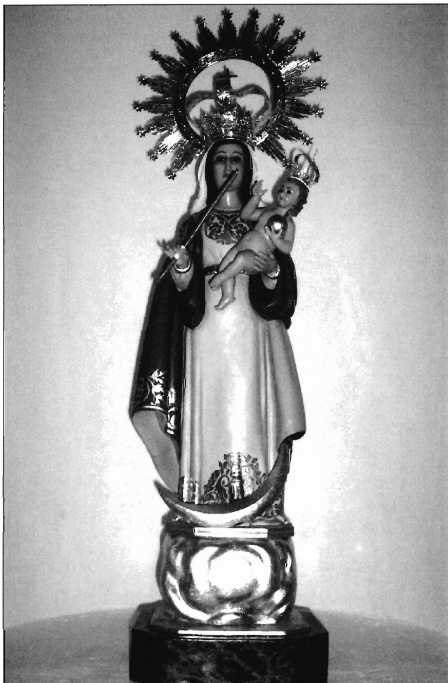
LÁMINA 11. Rubielos Altos. Imagen actual de N ra . S ra . de Copacabana. (Fotografía: Francisco B. Luján López).