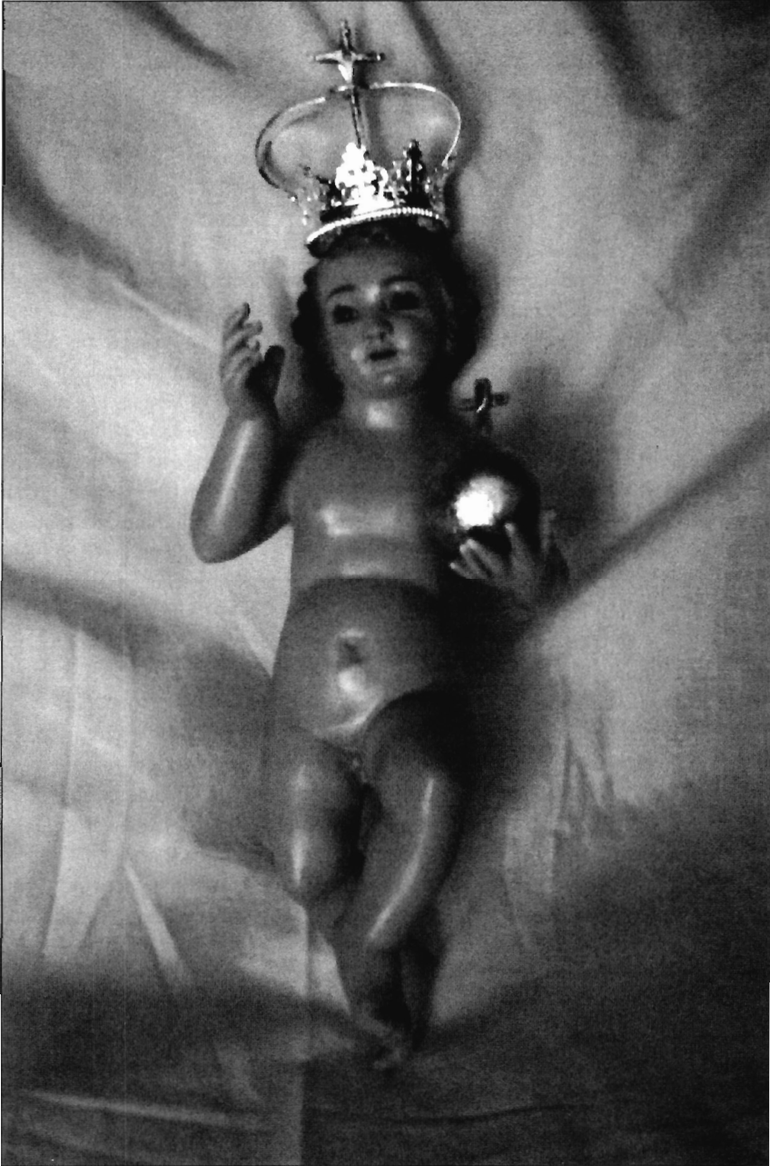
LÁMINA 9. Rubielos Altos. Niño Jesús de la imagen de N o . S o . de Copacabana. (Fotografía: Francisco Francisco B. Luján López).