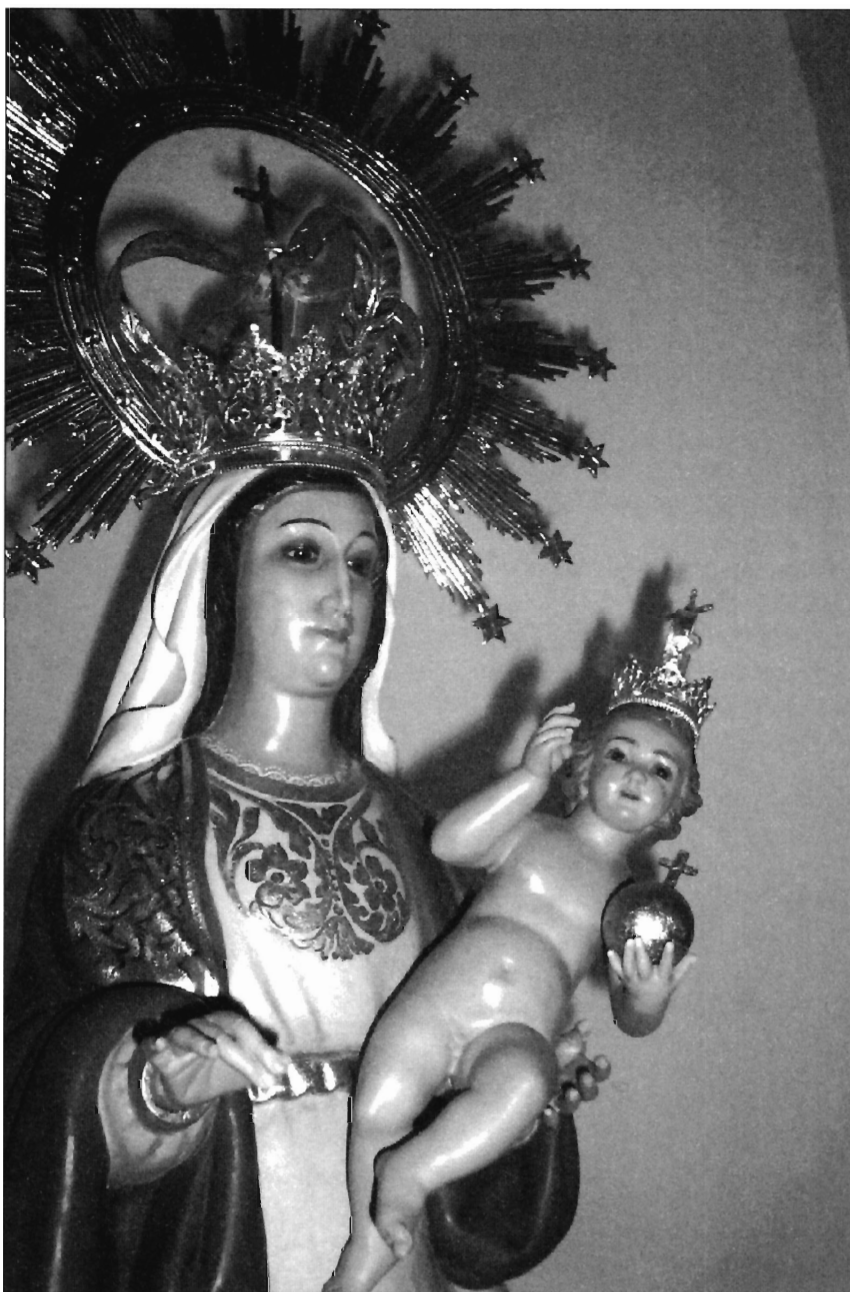
LÁMINA 12. Rubielos Altos. Detalle de la Imagen actual de N ra . S ra . de Copacabana.