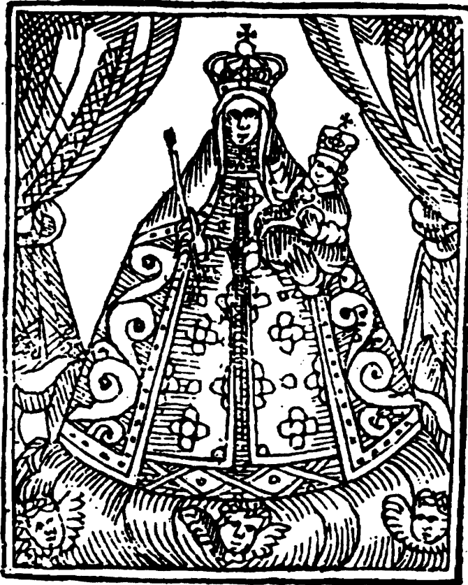
LÁMINA 4. Calatayud. Grabado de N.ª S.ª de Copacabana, incluido en «Los Gozos de la milagrosa V. de Copacabana. 1688». (A partir del publicado en García Marco, Fco.: op. cit., pág. 169).

En él, además de una composición de abalanza que concluye con una oración, se reproduce un grabado de la Virgen existente en el convento de Agustinos de Santa Mónica de aquella ciudad. (Lámina 4) Éste sigue la iconografía de la imagen vestida con un gran manto, que le proporciona la característica forma triangular, difundida a través de los grabados de la obra de Ramos Gavilán y Fernando Valverde. Según relata el autor del estudio, apareció como una hoja suelta en un protocolo notarial de Calatayud, lo que nos puede dar idea de la difusión alcanzada por este tipo de publicaciones, fomentando la divulgación de su devoción e iconografía.