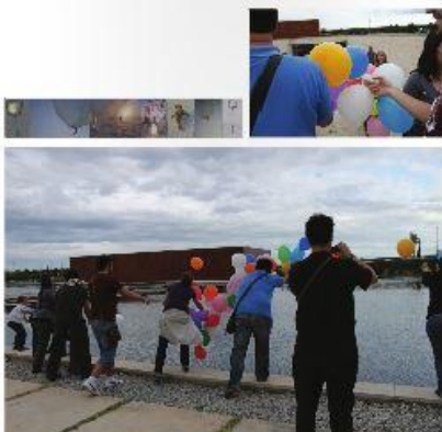
Figura 4. Cajas para el día de la familia (2011) con diferentes propuestas por parte de los autores y sus hijos para el día de la familia.