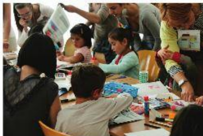
Figura 2. Libro de familia (2011) con diferentes propuestas por parte de los autores y sus hijos para el día de la familia.

Como ¿qué invitamos al lector a dar respuesta a un juego de preguntas asociadas a cada foto? De manera que observando las imágenes puede contestar a estas interrogantes que hemos tratado de suscitar visualmente y así cumplir el propósito de la investigación.