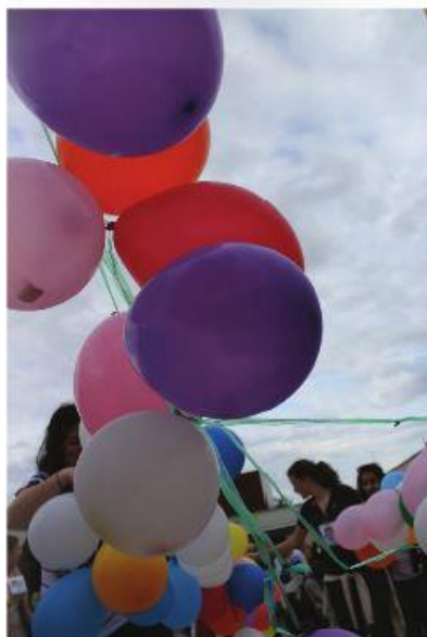
Figura 5. Cajas para el día de la familia (2011) con diferentes propuestas por parte de los autores y sus hijos para el día de la familia.