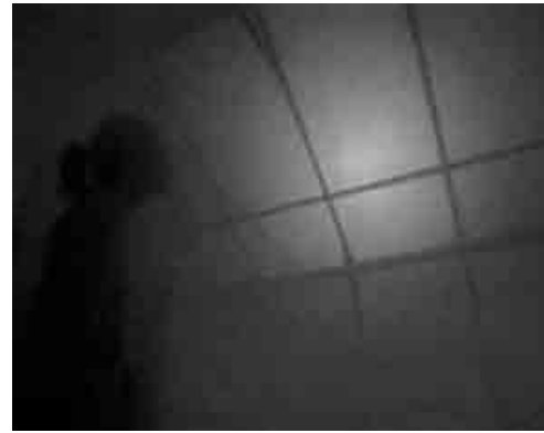
Figura 1. Ann Veronique Janssens, Ciel , 2003 (Film, installation).