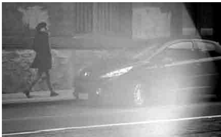
Figura 6. Ann Veronique Janssens, Bienal de Syney . First published.

Nuestra elección por Ann V. Janssens ya implica una empatía con su obra, y planteamos como hipótesis a su acercamiento que su propuesta acentúa lo intangible, en una actitud hacia lo infra-leve, quedando dicha actitud como la impronta que subyace en su producción. En esta apreciación de su producción artística es donde descansa la búsqueda reflexiva y crítica a su proximidad y comprensión. Precisamente hemos elegido obras de Janssens en las que es evidente su actitud alegórica e infra-leve.