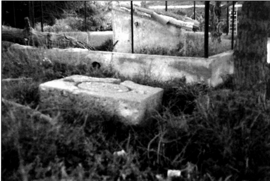
LÁMINA II (FOTOGRAFÍA N° 2). Pie de prensa localizado en el Río Seco.