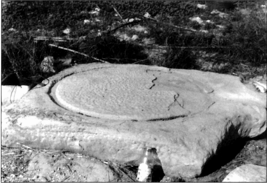
LÁMINA I (FOTOGRAFÍA N° 1). Pie de prensa procente del Convento de San Ginés.