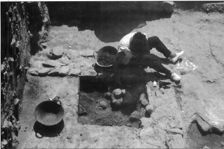
LÁMINA 4. La gestión de los EAP supone nuevas facetas profesionales para los arqueólogos.

nar excavaciones o prospecciones en cualquier terreno, público o privado, del territorio español (art. 43). En términos parecidos se expresan las legislaciones francesa e italiana. Las CC.AA. establecen normas que especifican la ley general.