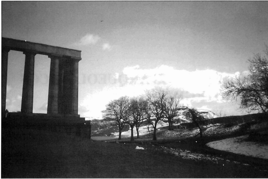
LÁMINA 1. Los Espacios Arqueológicos Protegidos.