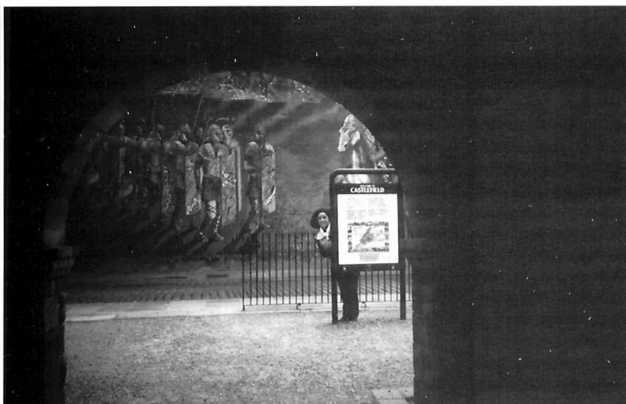
LÁMINA 7. Pintura mural realizada por distintos grupos sociales en un EAP llamado CASHEFIELD. Manchester (Inglaterra).

arqueólogo en su formación específica. Sin embargo, es indudable que para proyectar un trabajo arqueológico previo a cualquier obra de construcción, se requiere un arqueólogo titulado en una Facultad de Historia. Pero ¿puede afirmarse lo mismo cuando se trata de la gestión de una ciudad declarada Patrimonio de la Humanidad, de un paisaje histórico o espacio arqueológico protegido?