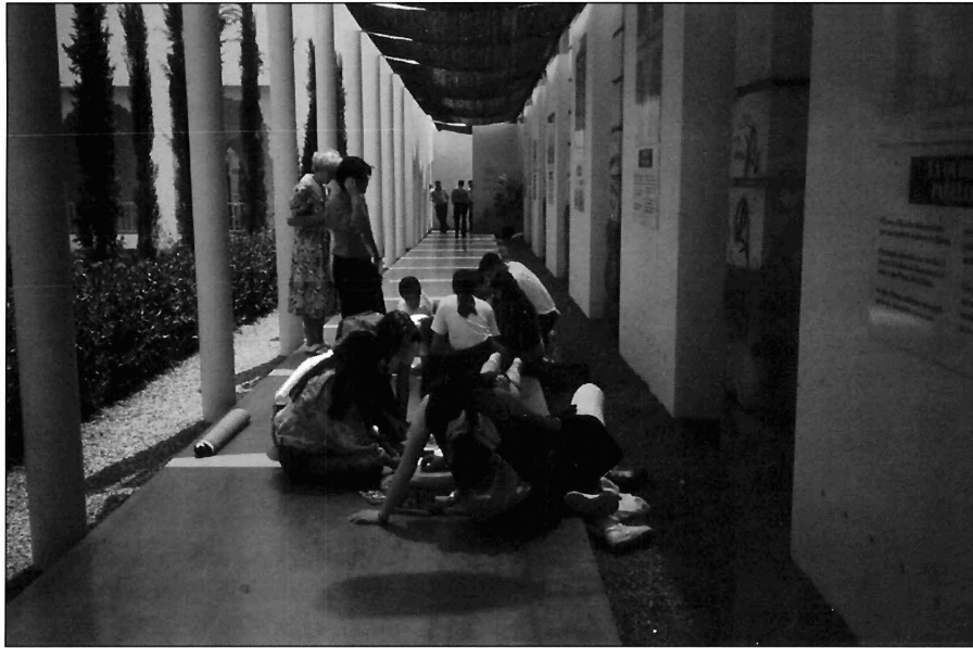
LÁMINA 5. El interés cultural se amplía a espacios nuevos.

habilidad para competir, de la calidad del servicio que se presta y de los precios.