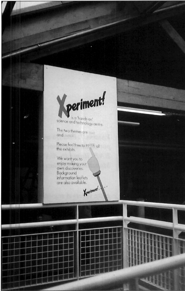
LÁMINA 6. Actualmente las exposiciones sistemáticas de objetos son reemplazadas por aproximaciones temáticas: se exponen ideas y valores.

lógico, se ha ensanchado e intensificado el interés de la sociedad por conocer y gozar de esos bienes de gran interés cultural. Esto ha influido tanto en la transformación del concepto de Museo clásico, como en la ampliación del interés por otros bienes que, por su naturaleza, no se pueden ni se deben depositar en los espacios de un Museo (lám. 5). El interés cultural se extiende a espacios amplísimos. Nuestra sociedad está influida por esa percepción de la cultura material, que corresponde a la definición que de ella hace Deetz: «aquél sector de nuestro medio físico que es modificado mediante un comportamiento determinado culturalmente»: obras de arte y campos, arados, jardines, monumentos, iglesias, bailes, fiestas e incluso el idioma. Las exposiciones sistemáticas de objetos son reemplazadas por aproximaciones temáticas: se exponen ideas y valores, como se hace en los parques temáticos. D. Horne establece un paralelismo entre los peregrinos medievales y la actual industria turística, como ejemplo de la tendencia que el