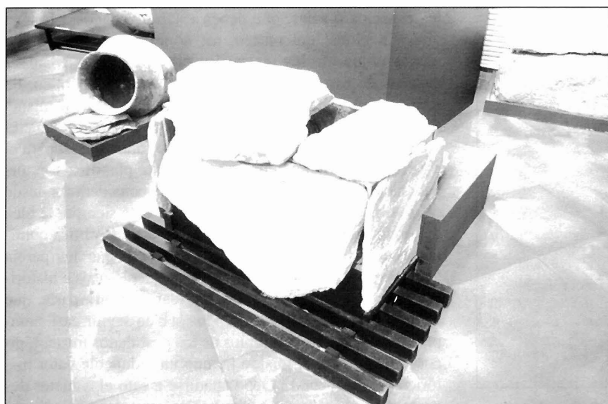
LÁMINA IV. Enterramiento en cista de El Puntarrón Chico, en la actual sala de El Argar.

pero de manera tal que no se altere su verdadero carácter ni la personalidad que le da el hecho de ser un museo arqueológico regional y, al mismo tiempo y en buena medida, local.