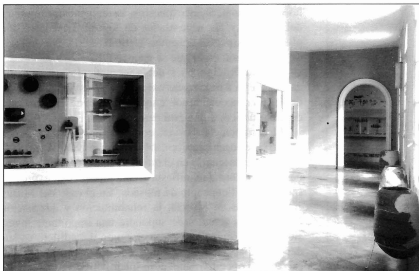
LÁMINA III. Sala y vitrinas de las dependencias actuales.