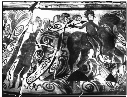
Lámina 6. Tocado de trompa. Escena de la figura anterior (según L. Pericot).