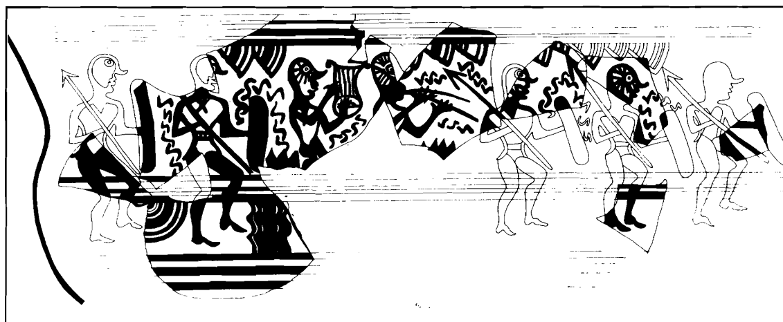
Figura 1. Vaso de los guerreros de El Cigarralejo (según E. Cuadrado).

En Etruria, en la Tumba de los Augures, fechada en torno al 520 a.C., se representaron personajes con el rostro cubierto por máscaras. Uno participa en un duelo con derramamiento de sangre. La composición designa a este varón con la palabra phersu , palabra