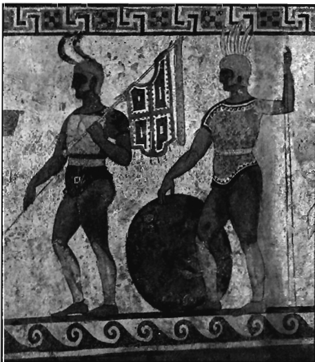
Lámina 3. Infantes lucanos. Paestum.

Una tinaja de gran tamaño procedente de la necrópolis de La Oliva (Valencia) (lám. 4) va decorada con infantes armados de lanzas y defendidos con escudos de La Tene II. Por tratarse de una tinaja hallada en una necrópolis cabe la posibilidad de que se tratase de un desfile de carácter funerario como el del vaso de El Cigarralejo 15 . En esce-