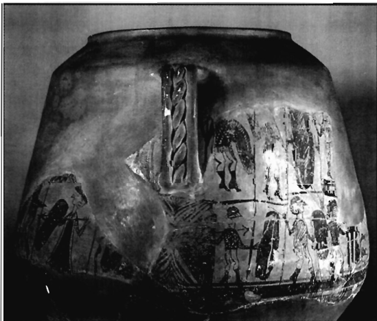
Lámina 4. Tinaja de La Oliva (Valencia) (según L. Pericot).

nas de lucha de otros vasos iberos aparecen músicos tocando la aulé (lám. 5) o la trompa 16 (lám. 6), como en un gran recipiente procedente de San Miguel de Liria (Valencia).