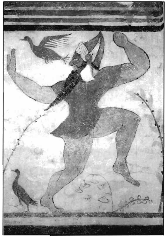
Lámina 2. Varón huyendo con máscara sobre el rostro. Tumba de los Augures. Tarquinia (según St. Steingraber).

El uso de la máscara con carácter funerario podía deberse a influjo fenicio. La mayoría de las máscaras