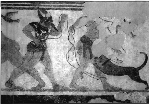
Lámina 1. Varón con máscara sobre el rostro. Tumba de los Augures. Tarquinia (según St. Steingraber).

na izquierda de un segundo combatiente. Éste va desnudo. Este mismo grupo se repite en la pared opuesta. Aquí, el varón con máscara sobre el rostro (lám. 2) huye perseguido por su adversario. Vuelve la cabeza atrás. Extiende el brazo derecho y levanta la mano.