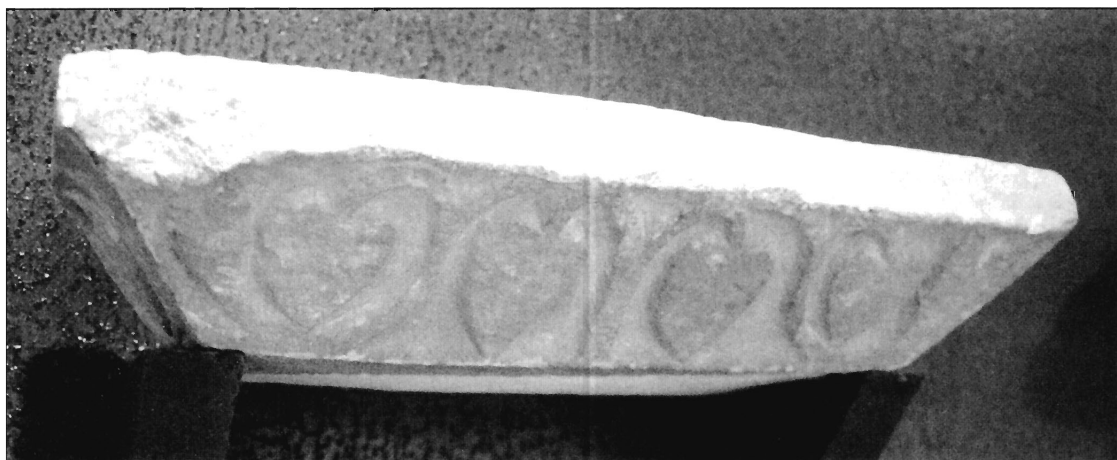
LÁMINA 13. Museo de Badajoz, cimacio.

Dentro del mismo marco de relaciones, otra de las piezas del conjunto de Casa Pilatos, el cimacio nº 3 (lám. 4), destaca por mostrar el elemento de las hojas acorazonadas de hiedra saliendo de un tallo común, tema presente, de un modo extremadamente similar en un cimacio del Museo de Badajoz (lám. 13) 48 . Tal y como sucedía con los cimacios decorados con flores de Casa Pilatos —nuestro nº 4— y Casa Herrera, la semejanza, tanto formal como funcional, llega a un nivel que hace más que factible plantear una relación que va más allá de la mera coincidencia formal. No es este el lugar, sin duda, de plantear la problemática vigente respecto a la existencia de un taller de escultura en época visigoda en la ciudad de Badajoz o si, por el contrario, las piezas anteriores a la invasión musulmana son traídas desde Mérida, tema hoy todavía no zanjado y sobre el que existe un debate abierto 49 . En todo caso, la factura de ambos cimacios se enmarca en un mismo contexto escultórico, siguiendo un tipo de pautas similar al que comentábamos más arriba al comparar Casa Herrera con nuestro grupo de Casa Pilatos.