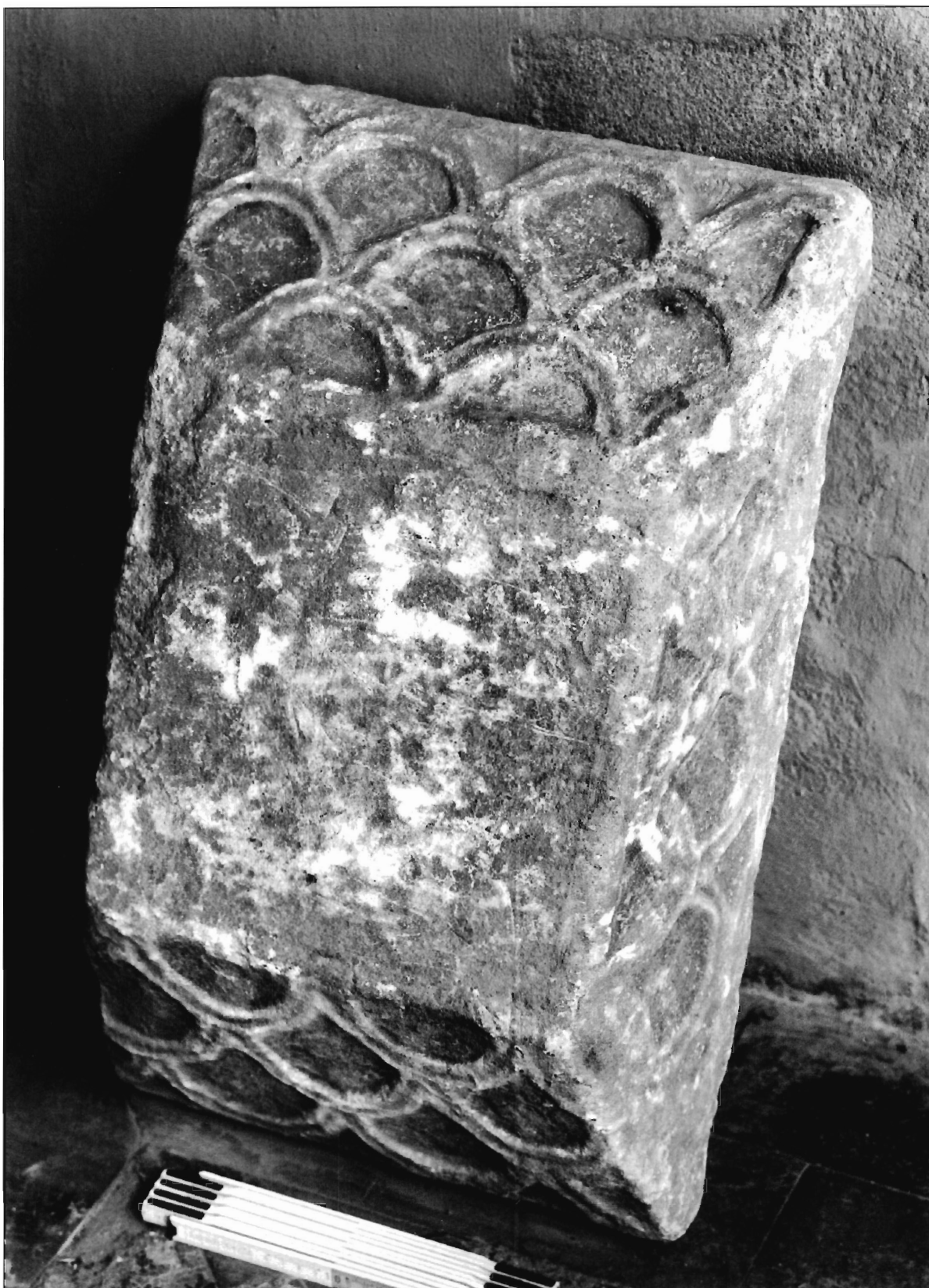
LÁMINA 3. Casa de Pilatos (Sevilla), cimacio (neg. DAI-MAD-R57-97-11).