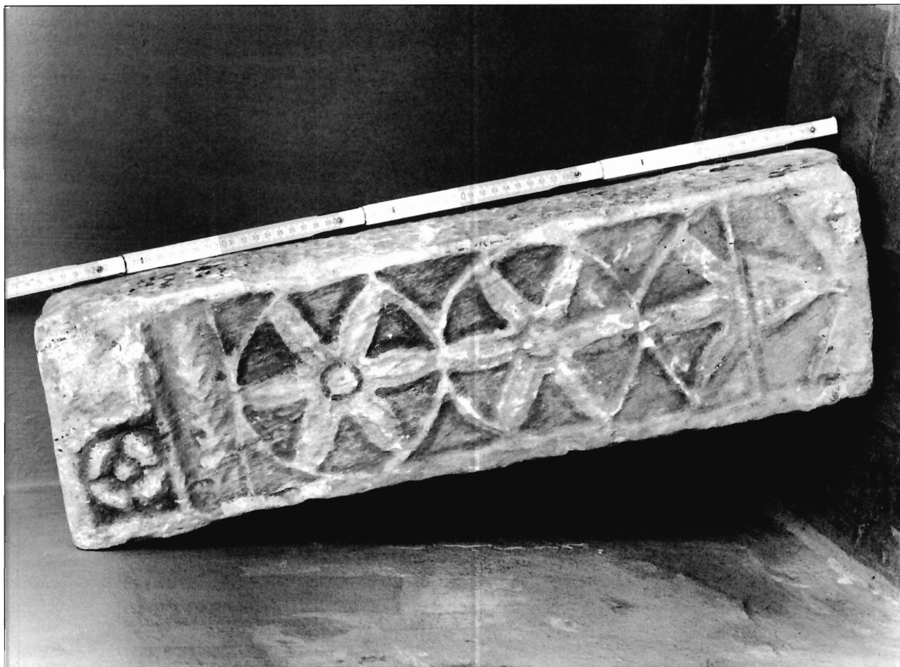
LÁMINA 9. Casa de Pilatos (Sevilla), tenante de altar? (neg. DAI-MAD-R57-97-2).