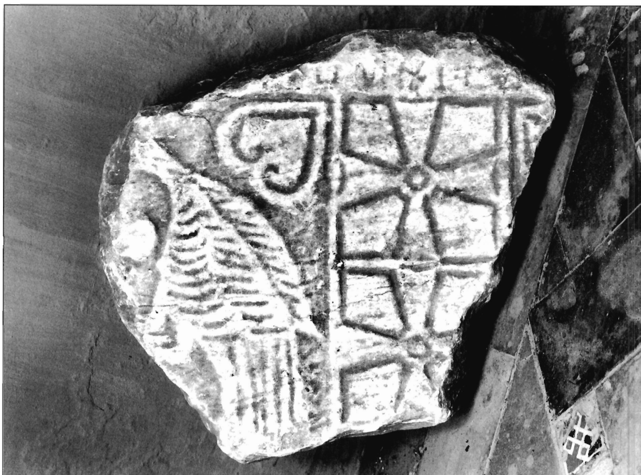
LÁMINA 6. Casa de Pilatos (Sevilla), fragmento de placa (neg. DAI-MAD.R57-97-8).

T. Esta diferencia de formato se corresponde con el diferente papel estructural que la pieza jugaría en su contexto arquitectónico 3 .