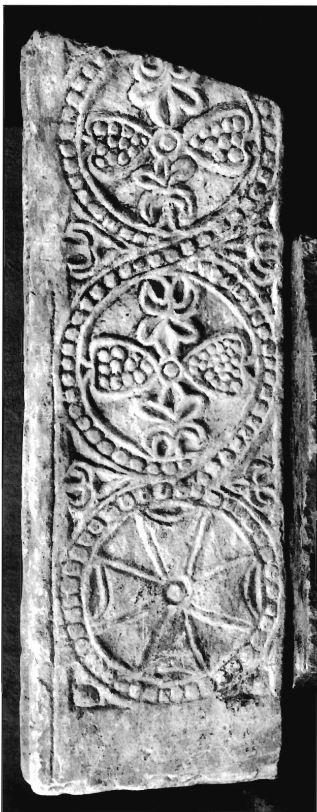
LÁMINA 8. Casa de Pilatos (Sevilla), barrotera (neg. DAI-MAD-R-57-97-1).