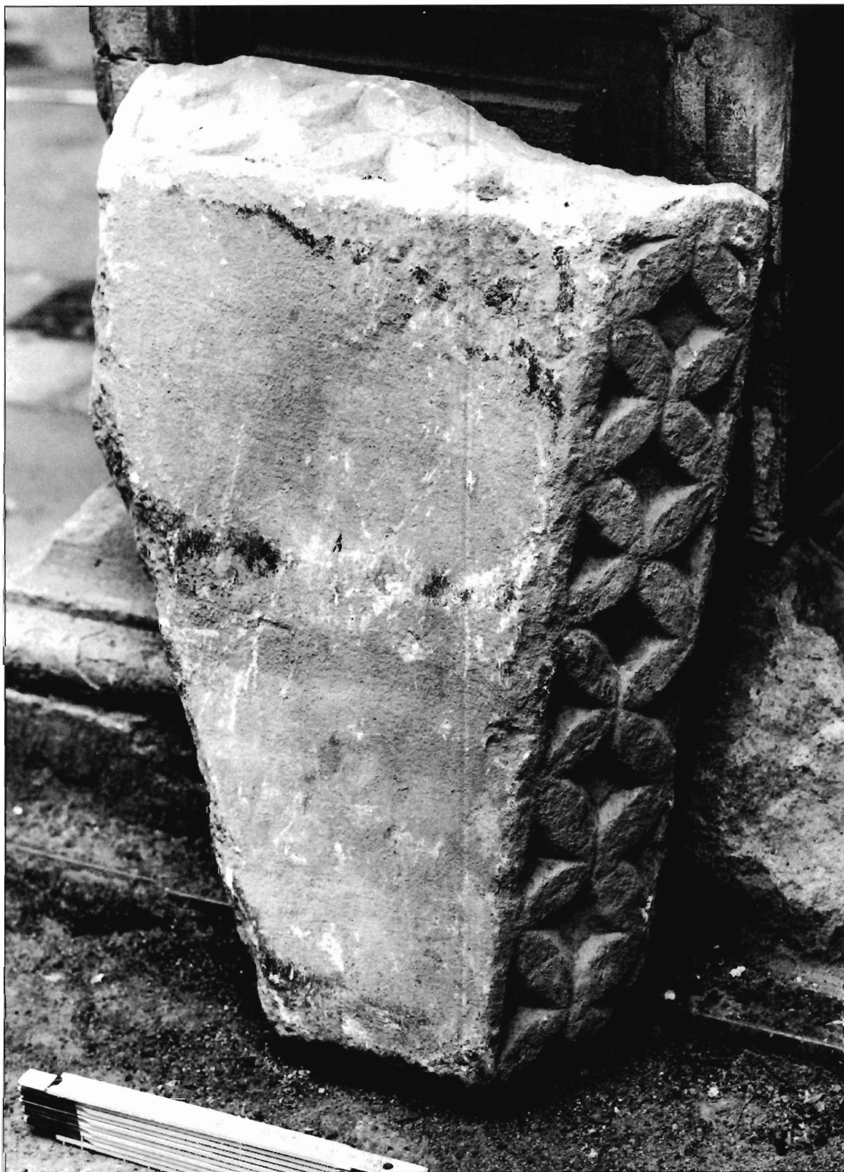
LÁMINA 5. Casa de Pilatos (Sevilla), cimacio (neg. DAI-MAD-R58-97-6).