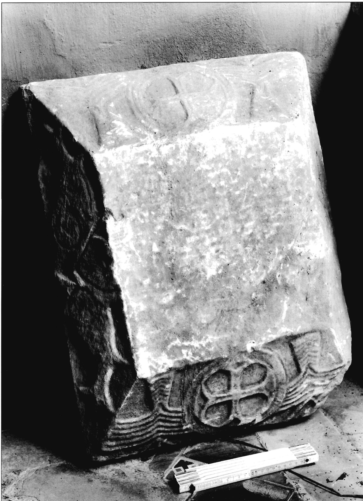
LÁMINA 1. Casa de Pilatos (Sevilla), cimacio (neg. DAI-MAD-R57-97-12).