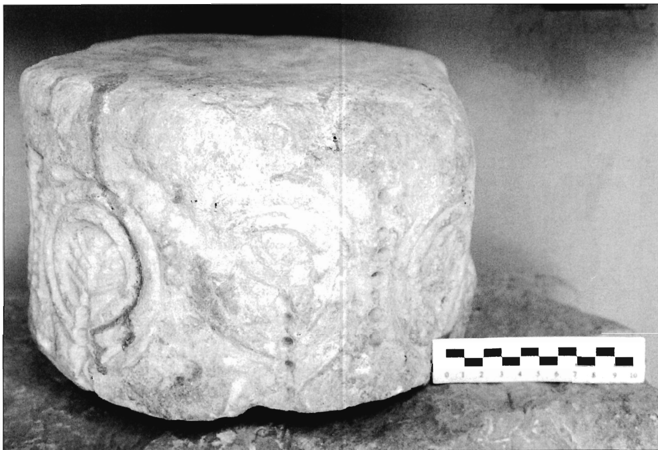
LÁMINA 7. Casa de Pilatos (Sevilla), fragmento cilíndrico (fuste?).

Este motivo se aprecia perfectamente en dos ocasiones, observándose cómo en el ángulo superior derecho existe un pequeño fragmento del arranque de un tercer cuadro con cruz semejante a los anteriores lo cual sugiere, por ley de simetría, que el número de cruces representadas era, como mínimo, de cuatro.