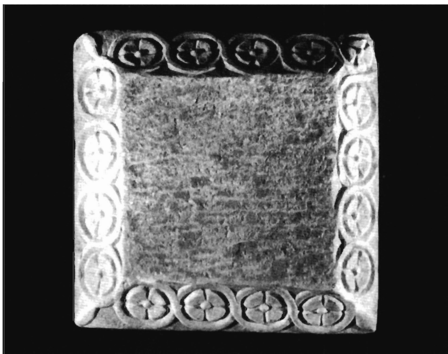
LÁMINA 12. Casa Herrera (Badajoz), cimacio (Ulbert, 1991, lám. 61b).

del cimacio con peces, como el resto de piezas del grupo de Casa Pilatos, ejemplares con los que, veremos, se constatan las pautas constatadas hasta el momento. Como recordaremos, el cimacio catalogado con el nº 1, posee en sus caras menores una composición centrada por una cruz dentro de un círculo flanqueado por dos palmeras sin frutos (lám. 1). Se observa, por tanto, que desde un punto de vista litúrgico hay una clara alusión a dos de los principales sacramentos del cristianismo: el Bautismo y la Eucaristía, al combinar la directa referencia al bautismo que brindan los peces y la concha, con la más sutil pero concisa relación con la Eucaristía y Redención de Jesucristo a través del símbolo de la cruz 37 . Como tal no existen paralelos hispánicos exactos para esta composición y menos en un cimacio, sin embargo, sí podemos verificar en la zona de Mérida la presencia de sus elementos por separado, es decir, tanto las palmeras 38 como el tipo de cruz de brazos patados en forma de ancla 39 . A pesar de tal carencia, el mismo arquetipo compositivo que plasma el cimacio de