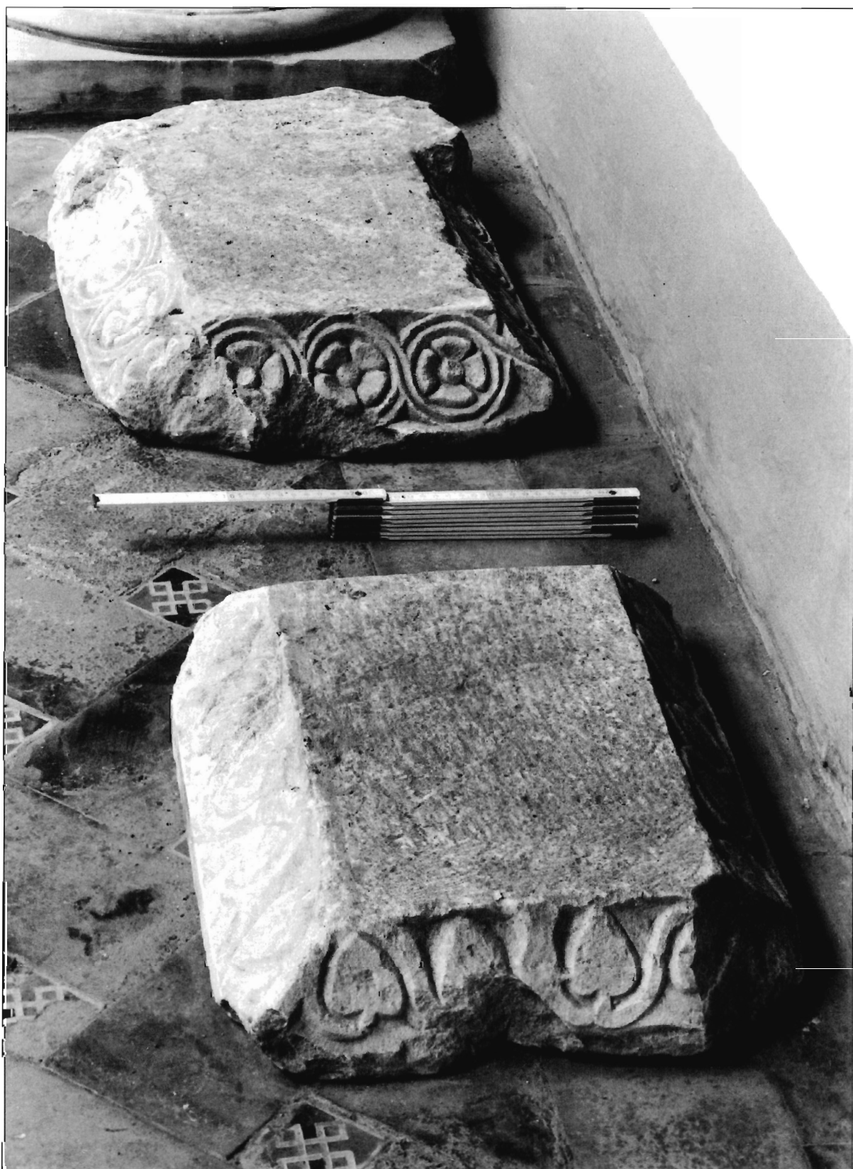
LÁMINA 4. Casa de Pilatos (Sevilla), cimacios (neg. DAI.MAD.R57-97-9).