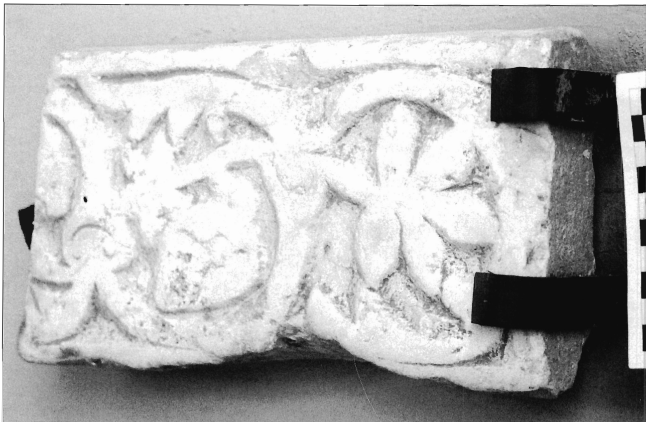
LÁMINA 10. Casa de Pilatos (Sevilla), fragmento de friso?.

solamente dos completos. Los roleos parten de esquemáticas cornucopias de las que surgen circularmente tallos vegetales en direcciones opuestas, cuyas extensiones pueden terminar en otra cornucopia, en una hoja compuesta —pentafoliada—, una palmeta o, en una única ocasión, un racimo de uvas. La superficie aparece bastante erosionada, por lo que no se aprecian bien detalles como los granos de uva o los perfiles de las cornucopias. Así mismo, dadas sus dimensiones y la ausencia de elementos que denoten ensamblaje con otras piezas, etc., resulta difícil definir una función concreta para este ejemplar. Posiblemente tales carencias indiquen que estemos ante un pequeño friso decorativo situado, por ejemplo, en una imposta correspondiendo, tal y como indican la decoración y el borde externo, a uno de sus extremos.