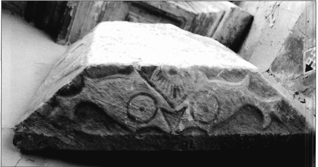
LÁMINA 2. Casa de Pilatos (Sevilla), cimacio, detalle (foto S. Vidal).