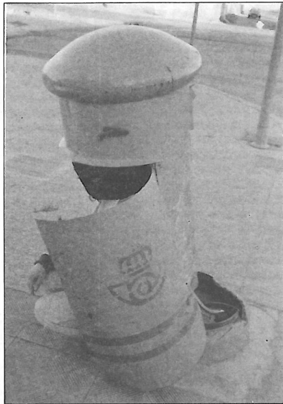
Nuestro fotógrafo pudo captar una violación postal perpetrada en nuestra Región.