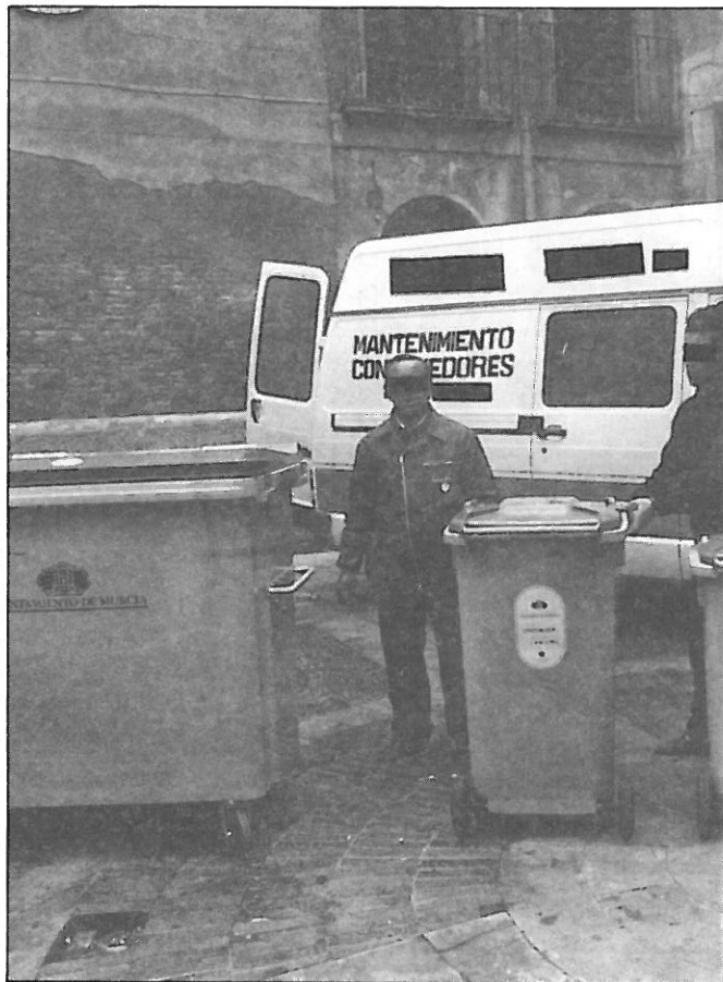
Un momento del Congreso de contenedores móviles.

Así que, olvídense de la tele, del trabajo, de las clases y de las grietas que le han salido en el talón, y véngase al cafebar Lloyps, ambiente selecto, también lo es su café. Todos los Martes y Jueves, de 6 a 9 de la tarde, hacemos lo mismo que cualquier otro día a esa hora.