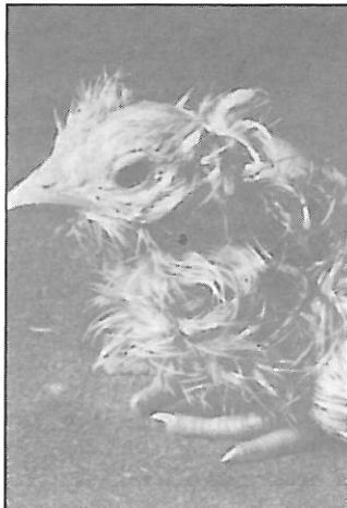
Esto es un pollo.