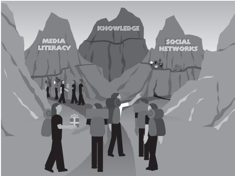
Fig. 2. Enseñanza Abierta – El Sherpa de la Red. Open Teaching – Network Sherpa

A pesar de ello, considero que estos tres elementos (la definición de trabajo de la enseñanza abierta, la disolución de los muros en las aulas y el entendimiento del profesor como “Sherpa de la Red”) pueden entenderse como definitorios de algunos de los cambios percibidos en la enseñanza y el aprendizaje y que estas analogías y metáforas nos ayudan a entenderlos y debatir en torno a ellos.