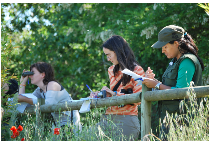
Algunas de las estudiantes que han pasado por los cursos de MONA, tomando datos del comportamiento de los chimpancés.

Nuestro objetivo principal siempre ha sido dar una solución ética al problema de los primates ilegales del territorio español así como iniciar a otras personas en el mundo de la conservación y la primatología, pero sobretodo, difundir a toda la sociedad la importancia de preservar y respetar a nuestros parientes evolutivos más cercanos y con ellos su hábitat. El centro de recuperación de primates de la Fundación MONA ofrece un ambiente idóneo para concienciar a las personas que todavía hoy se cuestionan la importancia de conservar a estas especies tan fascinantes.