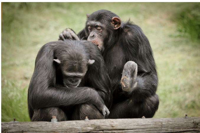
Una vez se forman los grupos, pasan a vivir permanentemente en la gran instalación exterior.