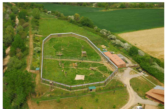
Instalaciones de MONA. Los chimpancés disfrutaban de unas instalaciones exteriores de más de 5.600 m2.

La Fundación MONA pretendía crear ese proyecto pionero donde poder rehabilitar y recuperar a estos chimpancés procedentes del tráfico ilegal, integrando esta actividad dentro de un marco de estudio, divulgación y socialización. En aquella época no existían, ni aquí ni en el extranjero, centros de referencia que aglutinaran todas estas facetas y que nos pudieran servir de guía.