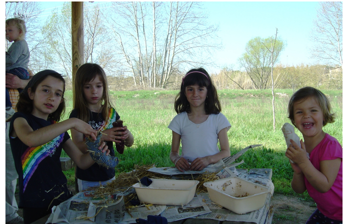
Escuelas y familias tienen las puertas de MONA abiertas. Mediante visitas guiadas se da a conocer el trabajo del centro de rescate.

mejorar el bienestar de los primates del centro así como para aumentar el conocimiento sobre nuestros parientes evolutivos.