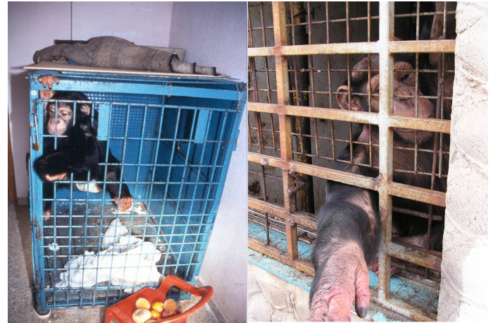
Sara (izq.) y África (dcha.) Situación anterior de algunos de los chimpancés rescatados por Mona.

de su especie. Conductas que les fueron truncadas cuando fueron separados de sus congéneres.