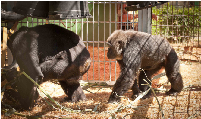
Dos chimpancés en las jaulas de asociación, por donde han de pasar todos los nuevos primates rescatados para conocer a sus nuevos compañeros.

todos los frentes necesarios para luchar por la supervivencia de los primates: Educación, Sensibilización, Investigación, Divulgación y Socialización. En estos 10 años el centro de recuperación de primates de Fundación MONA se ha consolidado como un centro de referencia a nivel internacional.