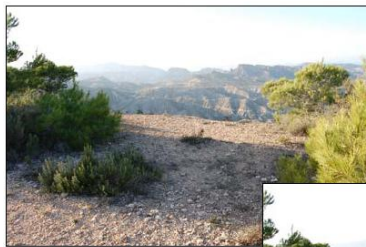
VISTA 1 ESTADO PREVIO

Murcia - La Cresta del Gallo - La Fuensanta - El Miravete - Ermita de San Roque - Cabezo del Alto - Pico del Quemao - Torregüil