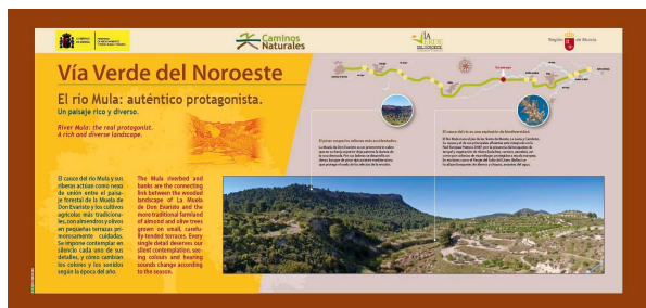
Señalización paisajística de la vía verde del Noroeste.

El Consorcio Turístico que gestiona esta infraestructura solicitó en 2009 una subvención de la Comunidad Autónoma de la Región de Murcia (Dirección General de Territorio y Vivienda) en el marco de una convocatoria destinada específicamente a la realización de estudios, elaboración de proyectos y ejecución de obras destinadas a la mejora, sensibilización y revalorización de los paisajes. En 2010 ECOPATRIMONIO realizó el estudio "Planificación interpretativa, contenidos y diseño de la Señalización Paisajística