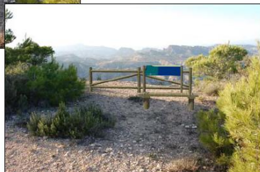
VISTA 2 ESTADO TRAS ACTUACIÓN

Algunas imágenes del Proyecto de Red de Miradores paisajísticos del municipio de Murcia.