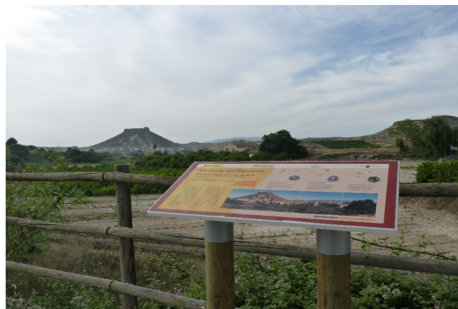
Señalización paisajística de la vía verde del Noroeste.

ta busca lugares-destino que no sean idénticos a su lugar de residencia y que por tanto contribuyan psicológicamente a producir un placentero “momento de cambio” en su vida.