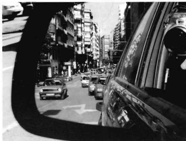
Manifestación en la Gran Vía

Dicha caravana se desarrolló sin ningún accidente a lo largo de todo el recorrido, pasando por los lugares donde se había producido esa gran transformación del Medio. Impresionante fue, sin duda, la majestuosidad de esos chalets de lujo, en contraste absoluto con el paisaje anterior agrícola o con los paisajes típicos de la Región.