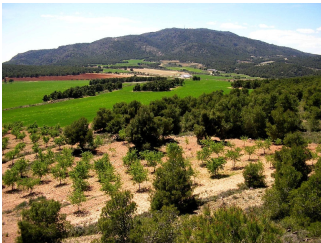
Vista de la cumbre de Carrascoy desde la altiplanicie de La Naveta.

El pasado 7 de agosto finalizó el periodo de exposición pública del Plan de Ordenación de los Recursos Naturales del Parque Regional de Carrascoy-El Valle (en adelante PORN), aprobado inicialmente por Orden de 18 de mayo de 2005 de la Consejería de Industria y Medio Ambiente (BORM 129, de 7/06/05). Los autores de este artículo, profesores del Departamento de Ecología e Hidrología de la Universidad de Murcia, hemos analizado y presentado alegaciones al borrador de este Plan, con la intención de mejorar algunos aspectos de su contenido, que a continuación trataremos de resumir.