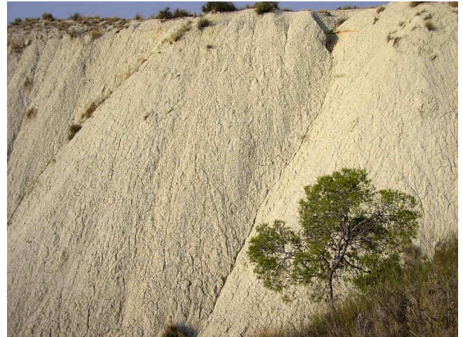
La diversidad geomorfológica y paisajística que alberga el ámbito del PORN se manifiesta en formaciones tan singulares como las margas del Barranco Blanco.

Conviene primero hacer dos comentarios, uno referido a la importancia de este Parque Regional, tan cercano a la ciudad Murcia como desconocido en algunos de sus valores más destacables. El Valle-Carrascoy es a la vez el “pulmón verde” de Murcia y un área de interés ecológico sobresaliente, por no citar su importancia cultural e histórica. Otro, relativo a la calidad y oportunidad del propio documento que se ha presentado al público, que consideramos adecuado a la realidad biofísica y socioeconómica de este espacio natural, y capaz de hacer frente a los factores de presión que le afectan, que derivan principalmente del aumento de la población que lo utiliza y reside en su periferia. Este PORN supone un avance cuantitativo y cualitativo notable, y es deseable que se apruebe en una redacción semejante a la que se ha propuesto, incorporando las alegaciones que, por una vez, son cuestiones más de detalle que de fondo.