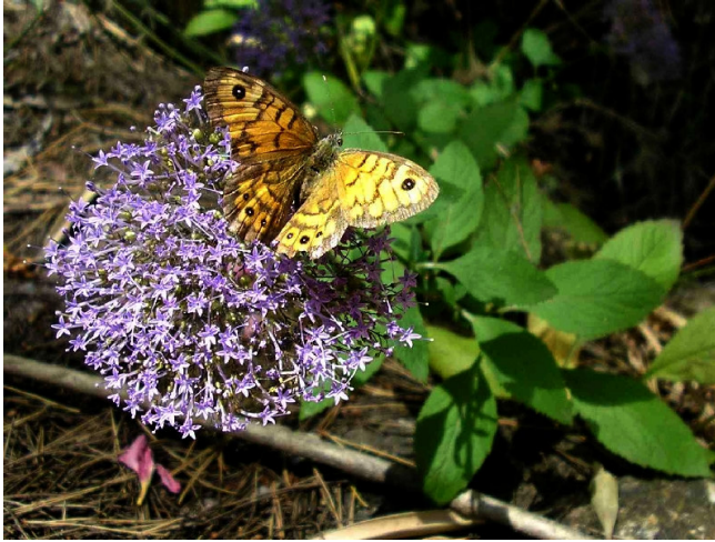
Los enclaves húmedos constituyen refugios para la biodiversidad ligada al medio acuático. Imagen de uno de estos enclaves (Barranco de las Cuevas del Buitre) en la umbría de Carrascoy.