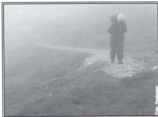
Larga ruta a pie, un día de inesperada niebla.

Alguien me dijo una vez que la respuesta a todo eso esta dentro de mí... pero la verdad es que no lo entendí y sigo sin entenderlo. Supongo que en esto consiste la aventura... también la interior, y yo me lo he buscado... reconozco pasar miedo... aunque imagino que ganan la batalla sutilmente las endorfinas que toda esta situación genera. Y como buena drogadicta seguro que repetiré.