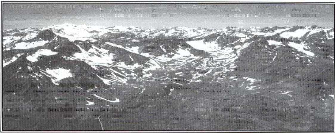
Sobrecogedora panorámica de Los Alpes, tomada desde el monte Schrankogel, a unos 3200 m.

Los Alpes son un lujo para cualquier amante de la alta montaña y siento además que son un lujo mayor para un biólogo. En estos días me está pareciendo vivir inmersa en un documental de La 2. Todo a mi alrededor luce plagado de pequeñas herbáceas en flor, de vivos colores, me sorprenden minúsculos y extraños insectos y, sobre todo, llaman mi atención las innumerables rocas cubiertas de líquenes y briófitos, tan bien adaptados a estas inhóspitas condiciones. Frío y viento se aúnan para hacer que los organismos generen sus estrategias de defensa si quieren sobrevivir aquí. Y yo, como un componente más de este ecosistema, ya empiezo a acurrucarme sobre este cuaderno para intentar no perder el poco calor que mi cuerpo es capaz de retener, con esta chapuza de adaptación al medio que es el forro polar de la tienda de artículos de montaña.