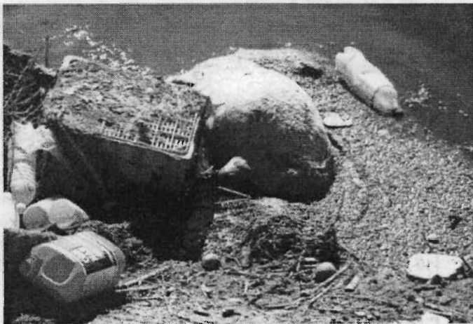
Un Segura limpio según la administración, a su paso por Murcia

La marcha se inició a las 5 de la tarde en el Auditorio de Murcia, con las personas que vinieron de la Vega Baja a la cabeza de la misma. En la cola, pero no por ello, menos importantes, marchábamos los colectivos de Murcia y entre ellos, nosotros. Se podían leer pancartas de todo tipo. Todas resumían la idea fundamental: "Por un río limpio". Al parecer, estos políticos todavía no se han dado cuenta de que el río se muere (puede que hayan sufrido algún tipo de mutación en el sentido del olfato que les impide percibir todos esos olores que emana el río, involuntariamente claro). Por ello, nosotros que somos tan considerados, pretendíamos con estas pancartas informarles de la situación. Queríamos hacerles partícipes de todo ese paisaje grotesco que se abre ante sus ojos (véase río) para que así, en la próxima manifestación que se organice puedan formar parte de ella en la medida de sus deseos y no se escondan en la excusa de la ignorancia.