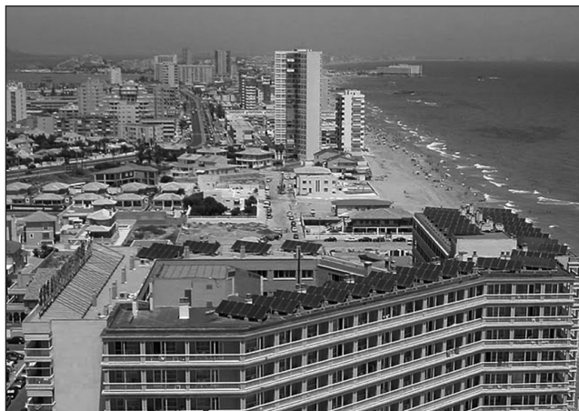
Figura 2 LA MANGA DEL MAR MENOR