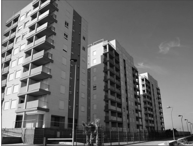
Figura 4 RESIDENCIAL VENEZIOLA GOLF II, EN EL NORTE DE LA MANGA DEL MAR MENOR