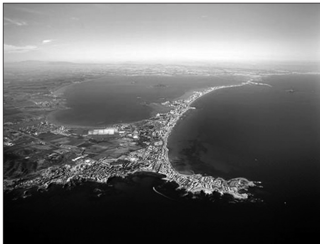
Figura 1 CABO DE PALOS Y LA MANGA DEL MAR MENOR