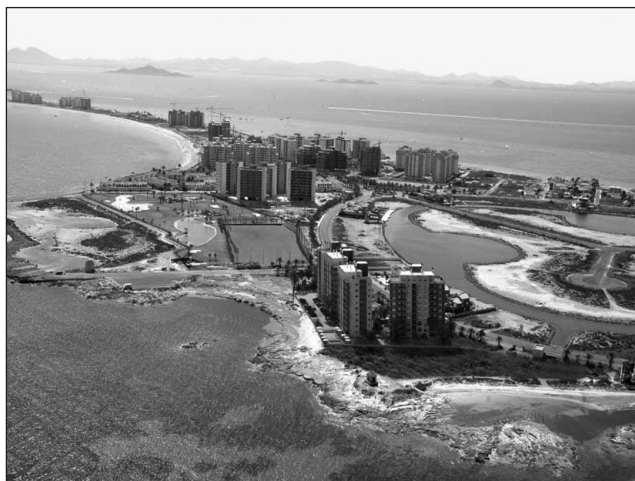
Figura 3 VENEZIOLA EN LA ZONA NORTE DE LA MANGA DEL MAR MENOR