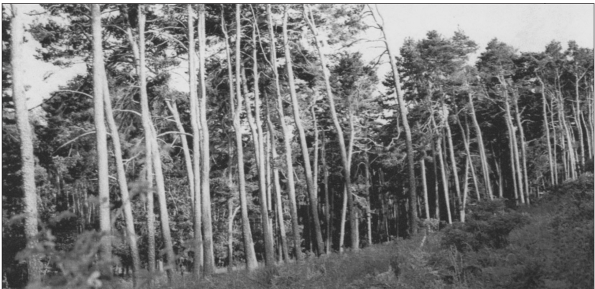
Figura 5. Tres panorámicas del Pinar de Hoyocasero. Figure 5 Three views of the Hoyocasero pine wood.