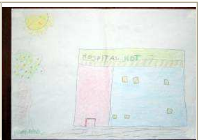
Figura 2 - Dibujo del hospital por Alberto durante la Evaluación Final . Título dado: "El hospital HDT"