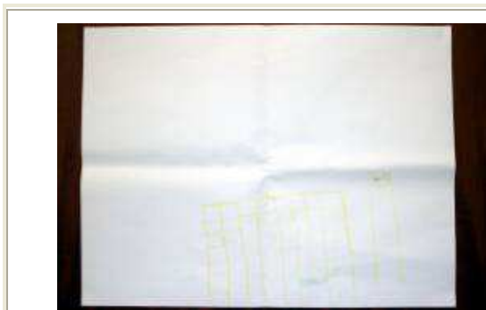
Figura 5 - Dibujo del hospital por Délcio durante la Evaluación Inicial . Título dado: "Hospital"