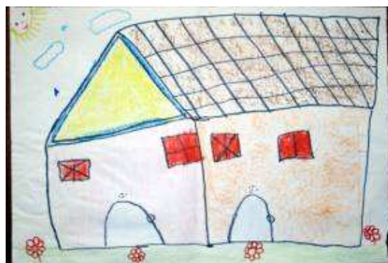
Figura 4 - Dibujo del hospital por Vera durante la Evaluación Final . Título dado: "El hospital"