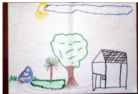
Figura 6 - Dibujo del hospital por Délcio durante la Evaluación Final . Título dado: "El hospital"