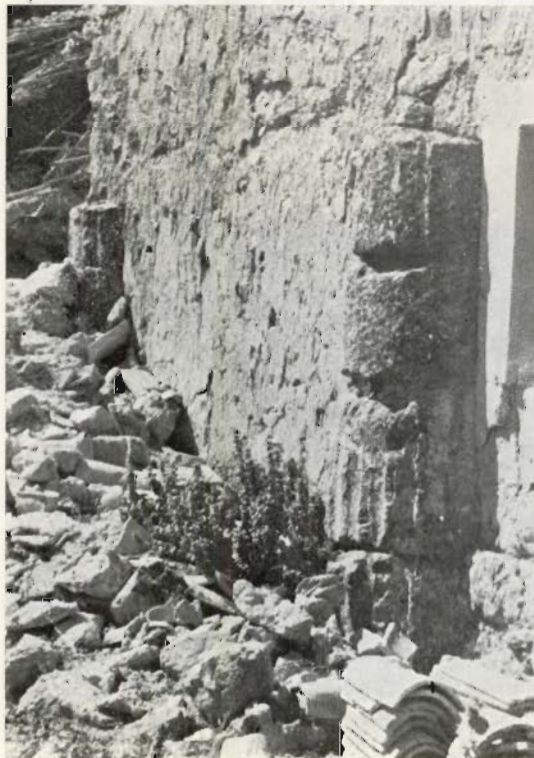
2: Restos de columnas del Templo romano adosadas al actual Santuario de La Encarnación (Caravaca).