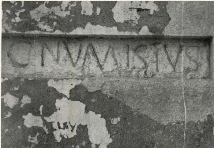
1: Lápida epigráfica (C. NUMISIVS) "in situ" en el actual santuario de San Ginés de la Jara, testigo del anterior emplazamiento de una "villa" romana.