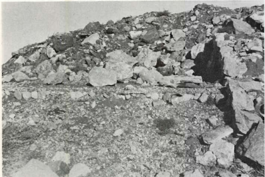
1: Restos de la "villa" romana del monte del "Castillet" (Cabo de Palos).