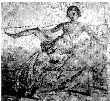
Fig. 4: Pintura mural ( Escena IV ), c. 60/70 d. C. Termas Suburbanas de Pompeya.