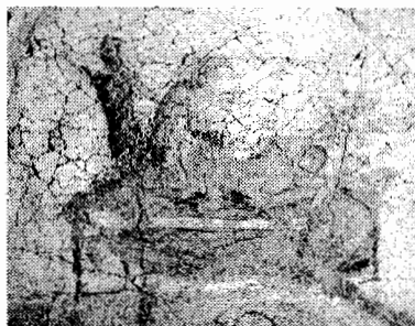
Fig. 5: Pintura mural ( Escena VII ), c. 60/70 d. C. Termas Suburbanas de Pompeya.