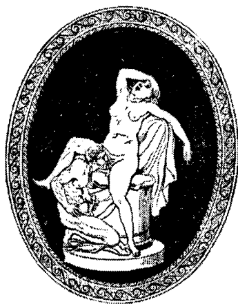
Fig. 1: Medalla: “Tiberio saciando su lascivia de viejo en la virgen Malonia” (D'Hancarville, Monuments de la vie privée... , grabado XXII).

En España, Joaquín López Barbadillo tradujo y editó ambas obras de d'Hancarville junto con sus grabados, aunque suprimiendo algunos considerados por él “completamente desprovistos de interés”, por lo que el grabado XXII de los Monuments de la vie privée... que cita aquí Forberg corresponde en la edición española (Madrid, 1919) al grabado XXI, que aquí reproducimos (fig. 1; véase igualmente el final del cap. III [pág. 304], donde Forberg se refiere también al grabado XXI de d'Hancarville [= 20 en la edición española], que presenta a Tiberio practicando el cunnilingus con una mujer y siendo chupado por otra).