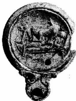
Fig. 3: Lámpara romana de terracota, siglo I d. C. Nicosia, Museo de Chipre.