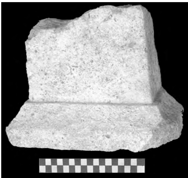
Ara n° 1

Ara 1: Apareció en la Campaña de 2001 en el relleno superior de la Capilla Sur, en un contexto cronológico de los siglos XVIII-XIX. Se trata de la mitad inferior de un ara de caliza de grano fino. Su base tiene 30 por 15 cm. y la altura máxima conservada es de 25 cm. Conserva en buen estado la cara anterior y las laterales, mientras que la posterior tiene una talla tosca, indicativa de que la pieza era para estar adosada a una pared.