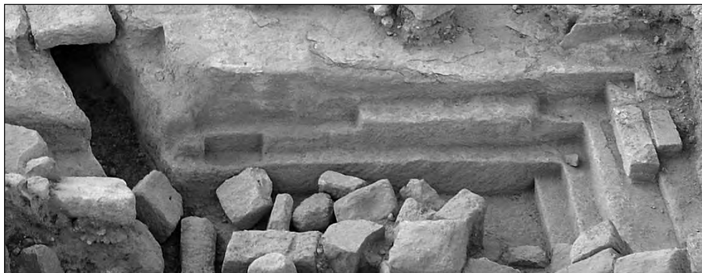
A la derecha las gradas de acceso a la piscina. En el frente las repisas para colocar exvotos.

Pero en Fortuna, tras años de excavaciones solo se había encontrado un ara y el fragmento de otra. Ambas como rellenos en niveles del siglo XVII y ambas anepigráficas.