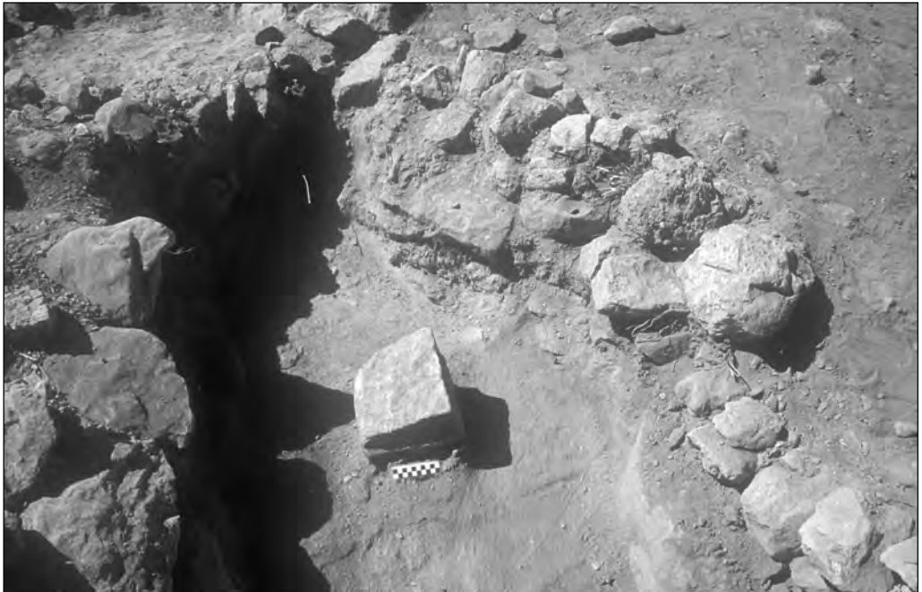
El Ara nº 2 en el momento de su hallazgo. Se ven con claridad las terrazas del siglo XVII.

La pieza tiene una talla tosca y no presenta ningún resto de inscripción ni la posibilidad de haberla tenido nunca.