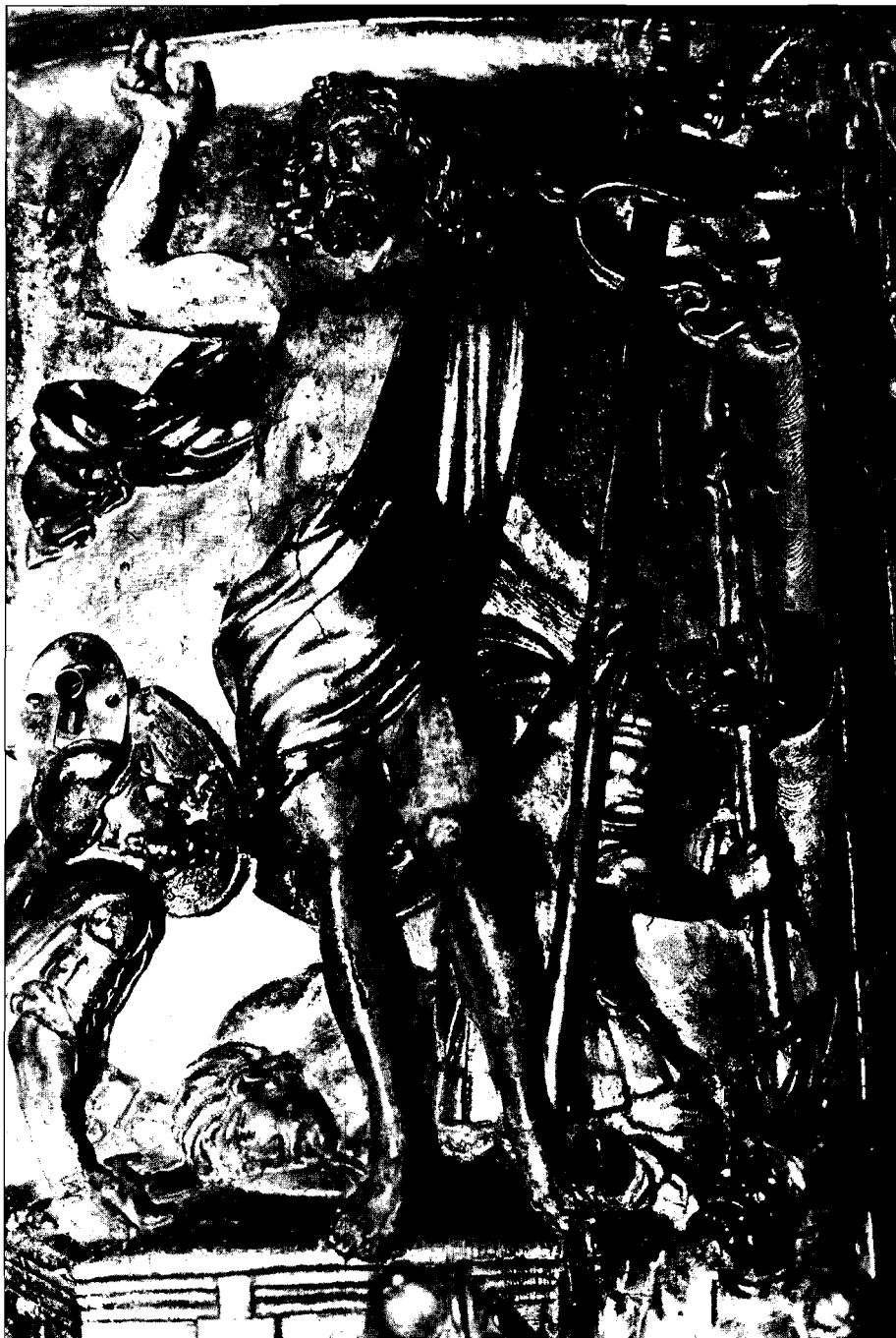
Fotografía 5. La Resurrección. Mansilla Mayor. Iglesia parroquial