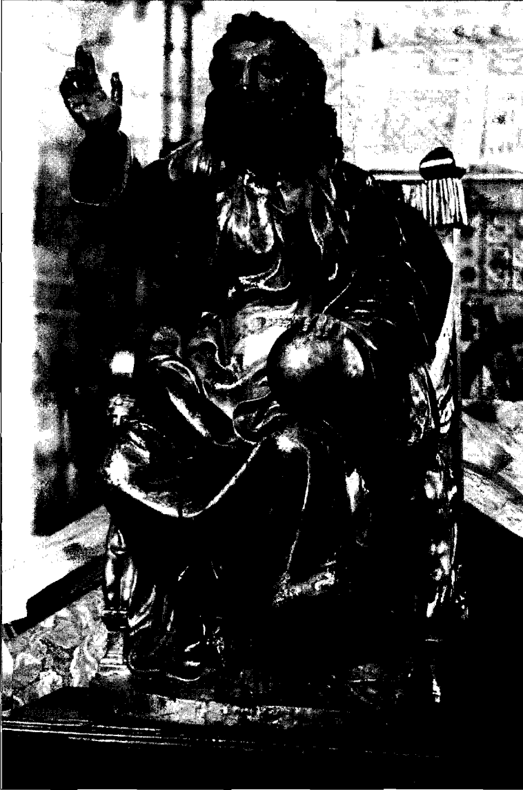
Fotografía 4. El Salvador. León. Iglesia de Palat de Rey

laciona muy directamente en el torso y fundamentalmente en el rostro será El Bautista del Museo Nacional de Escultura de Valladolid y con el busto de la medalla que efigia a Moisés en uno de los tondos de la sacristía de Juan de Badajoz, realizado por el propio Angés, donde el tratamiento de rostro, cabellos y barba poseen el mismo modelado.