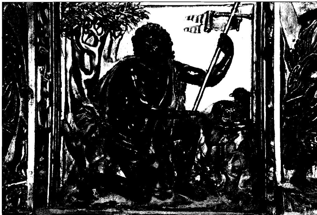
Fotografía 1. San Juan Bautista. León. Iglesia de Palat de Rey.

hemos de olvidar que es el primero de los apóstoles que entrega su sangre en el martirio, su patronato sobre España y la orden militar de su mismo nombre de claro arraigo en estas tierras.