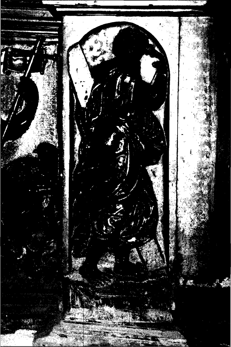
Fotografía 3. San Andrés. León. Iglesia de Palat de Rey

de rostro y cabellos enlaza en general con lo realizado para Carbajal, de un modo particular el rostro y la barba sigue el ejemplo de la figura de El Padre Eterno del mismo retablo.