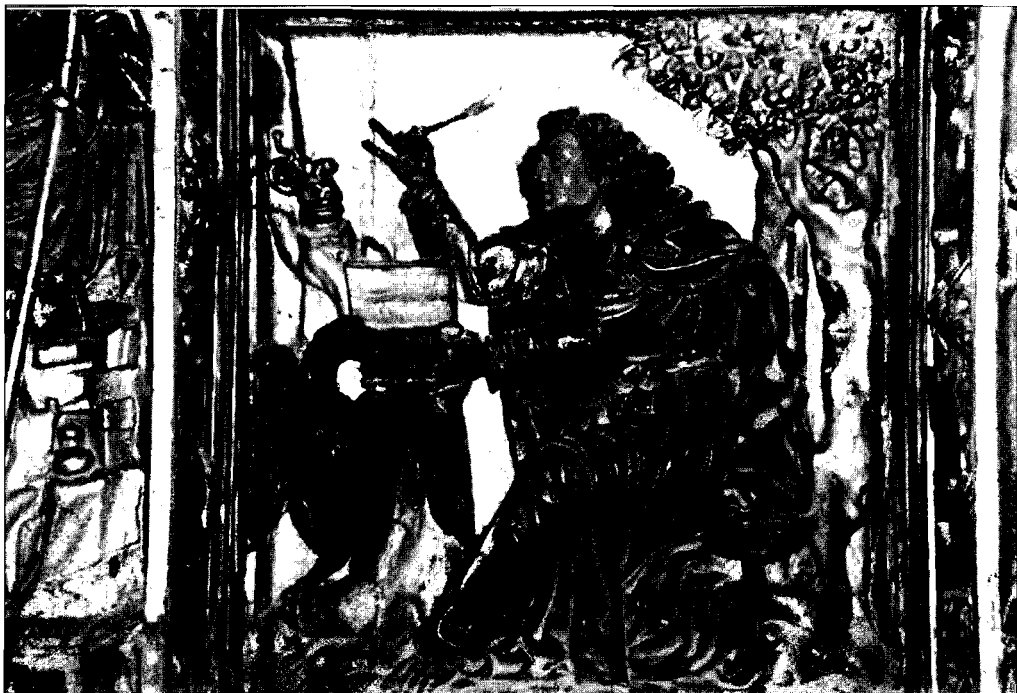
Fotografía 2. San Juan Evangelista. León. Iglesia de Palat de Rey

Durero, el martirio de san Sebastián. En simetría con éste, el segundo, también atado a un árbol, viste túnica y nos muestra la pierna derecha desde la rodilla a los pies desnuda. Aquí se ha preferido ofrecernos al santo no con sus atuendos pontificales de tiara y cruz de tres travesaños, sino que reproduce el momento preciso del martirio, amarrado al leño y con la espada tras él, como símbolo del instrumento de su decapitación.