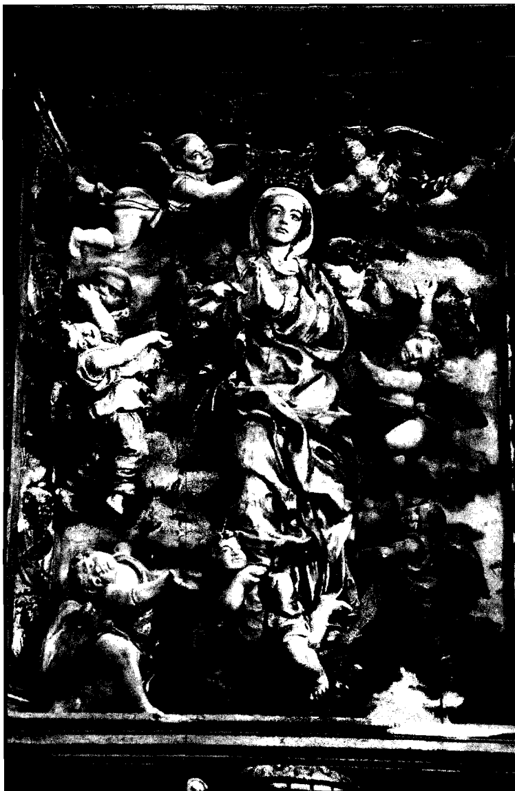
Fotografía 7. La Asunción. Villacelama. Iglesia parroquial.

su maestro. Así, en las esculturas de los dos evangelistas, san Marcos, teniendo siempre presente el tema inicial de la obra homónima de Juni en la sillería coral de san Marcos, se relaciona con el relieve del mismo motivo de Carbajal de la Legua, capilla de Jesús de Sahagún, sagrario de Mansilla Mayor y escultura exenta de Calzadilla de la Cueva, si bien la degradación estética en esta obra es más que notoria.