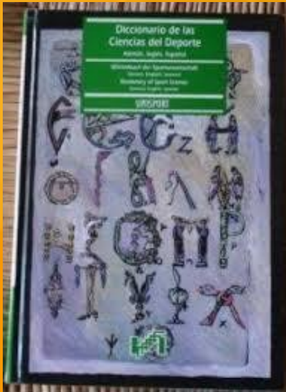
Diccionario de las Ciencias del Deporte, 1992