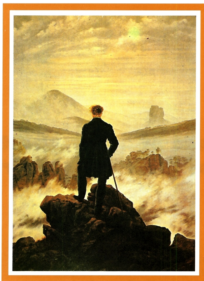
Caspar David Friedrich: Caminante sobre un mar de nubes (hacia 1819)