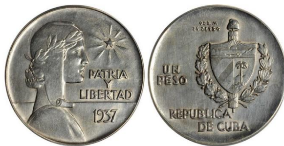
Figura 4: Anverso y reverso de una moneda “ABC” de un peso de 1937.

No obstante, las monedas acuñadas en 1937 han adquirido gran notoriedad debido al número excepcionalmente bajo de ejemplares que se han preservado a lo largo del tiempo. Esto las convierte en piezas sumamente difíciles de conseguir y que lógicamente alcanzan siempre precios elevados en las subastas internacionales. Algunos especialistas opinan que el número de piezas de este año que existen en la actualidad podría rondar entre 100 y 200, si bien esto es sumamente difícil de determinar con exactitud (Figura 4).