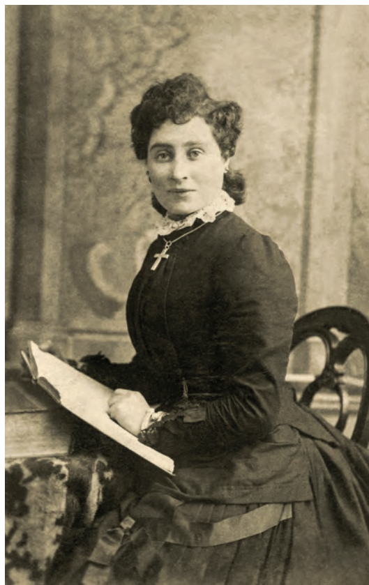
| Retrato de dama leyendo W. Thomson. Aberdeen, Inglaterra. 1884