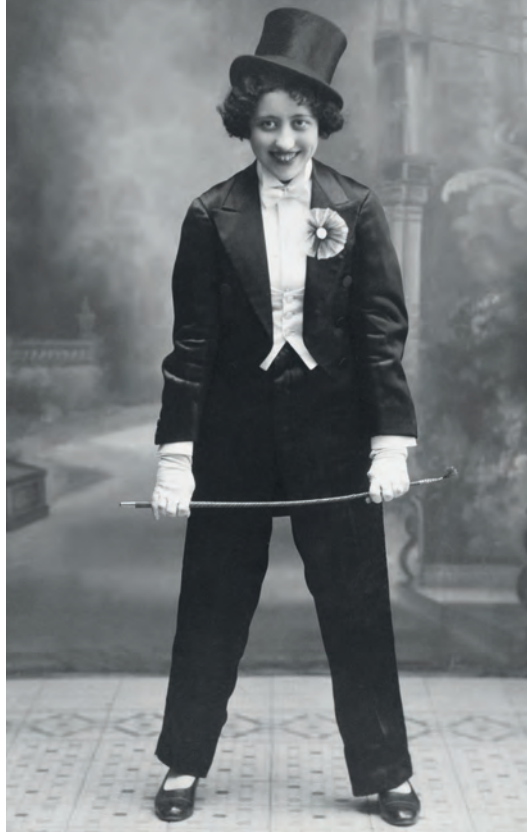
| Mujer disfrazada de hombre Arenas. Málaga, España. 1911