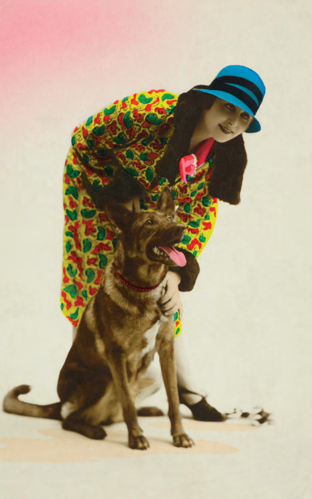
| Mujer con perro Colección LEO. París, Francia. 1920