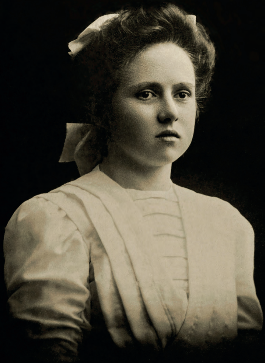
| Retrato artístico Eurenius. Karlskrona, Suecia. 1899