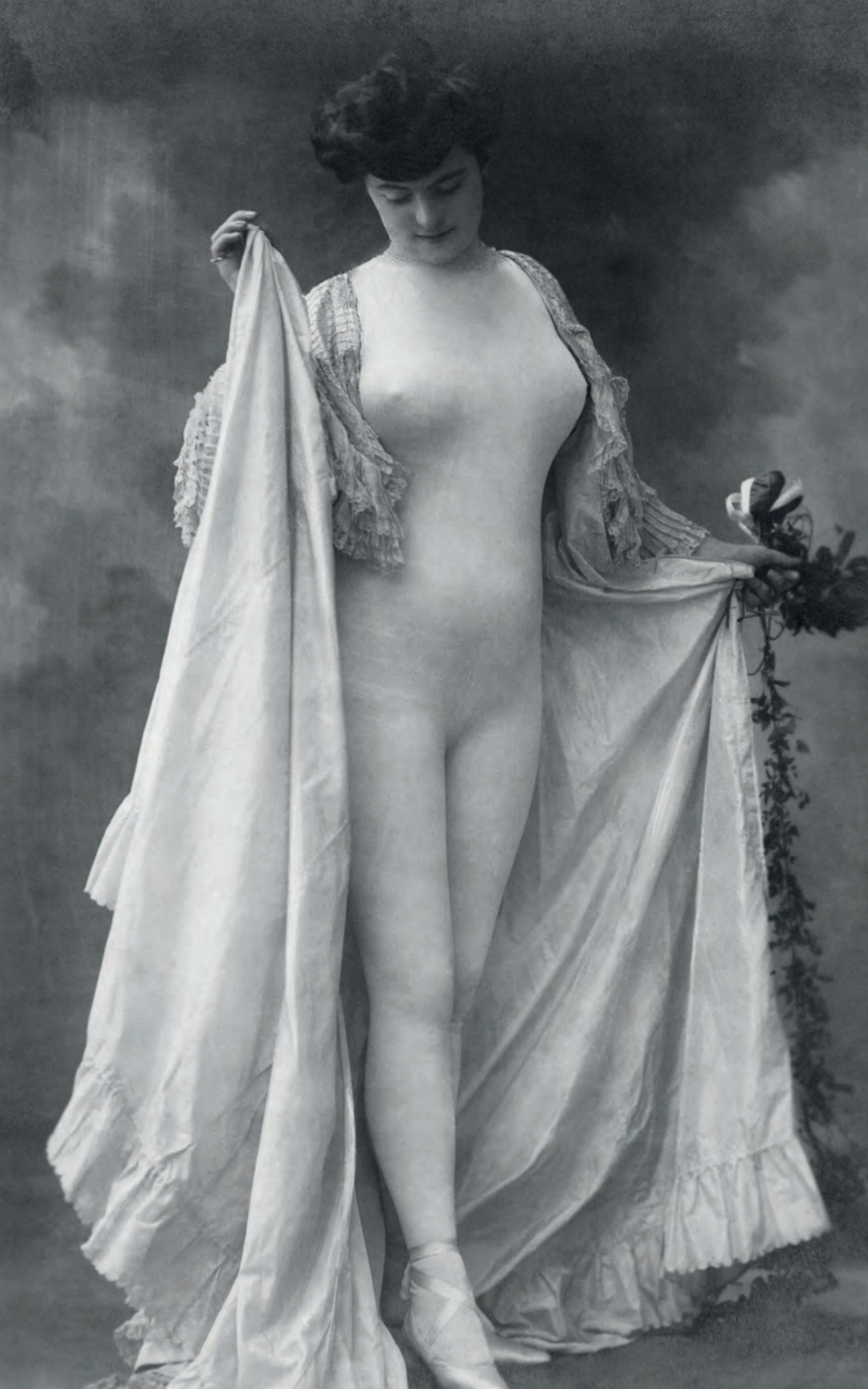
| Mujer disfrazada de desnudo Anónima. Berlín, Alemania. 1910