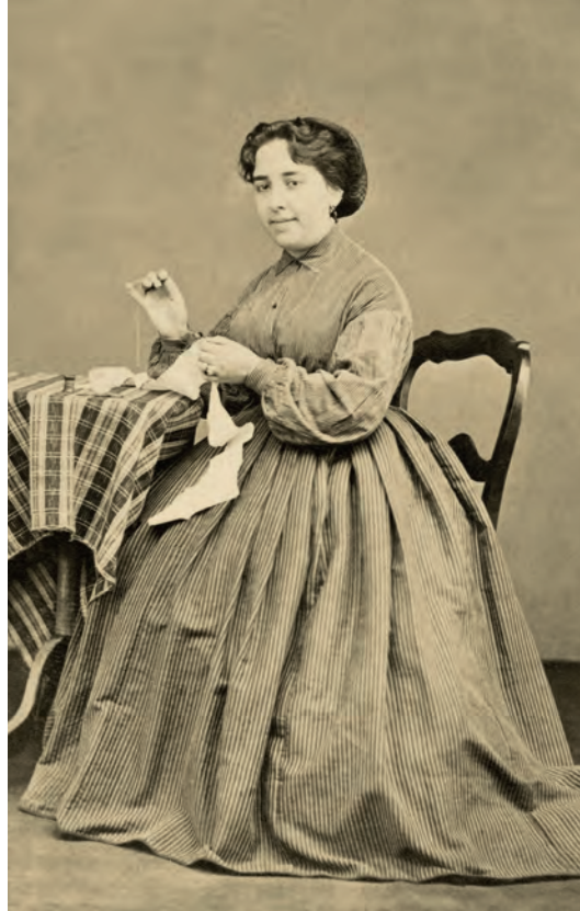
| Retrato de dama cosiendo Anónimo. Madrid, España. 1889