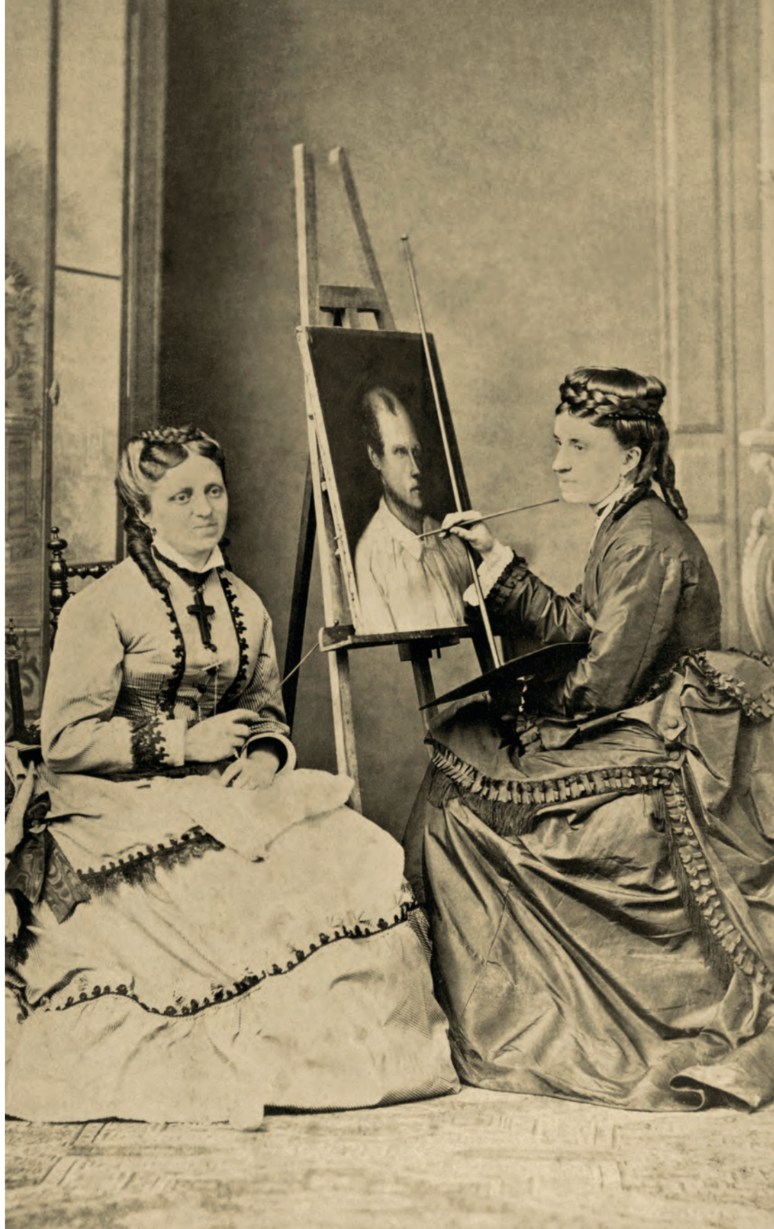
| Retrato de damas pintando A. Mallart. Amiens, Francia. 1878