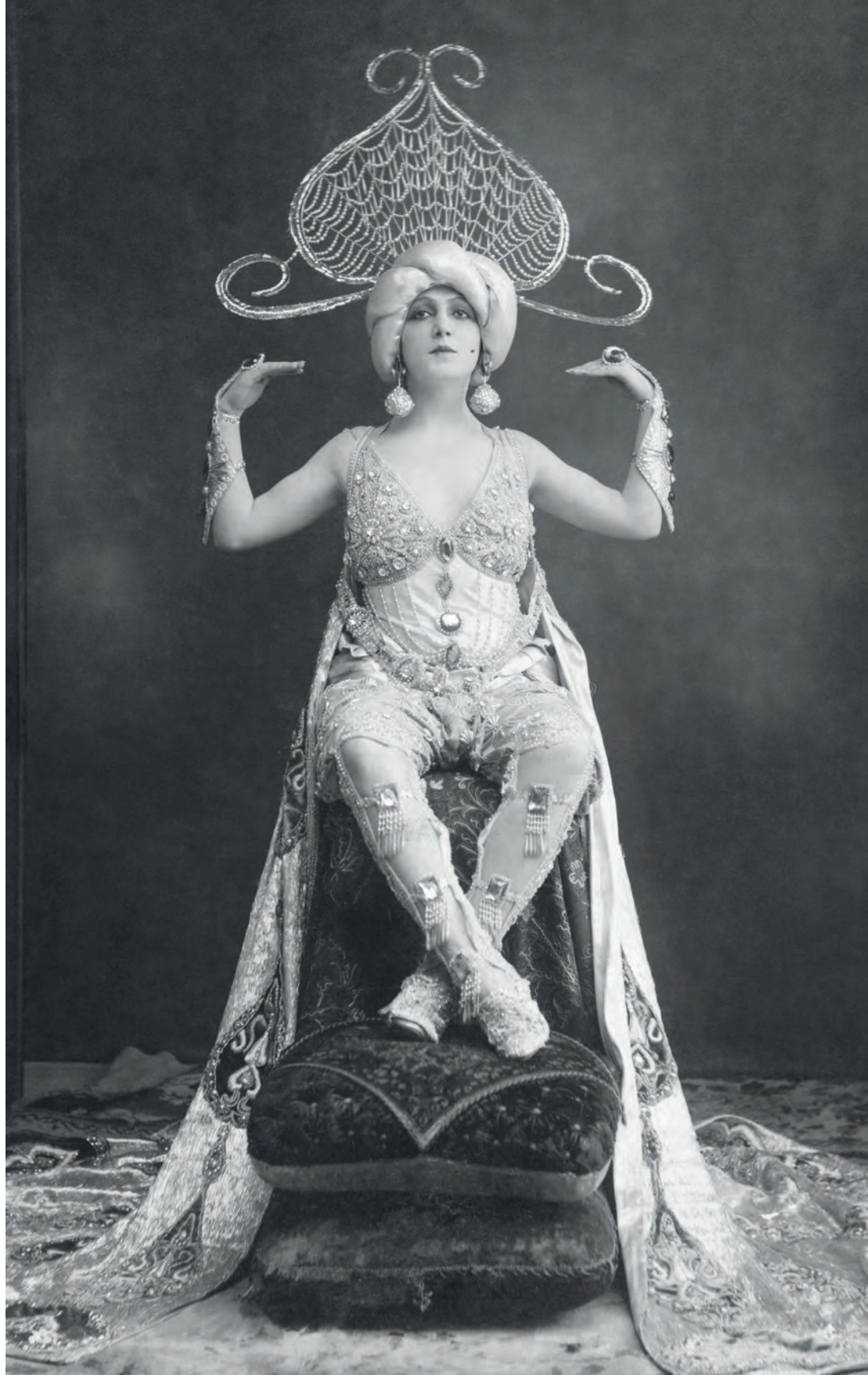
| Mujer disfrazada de fantasía Esplugas. Barcelona, España. 1922