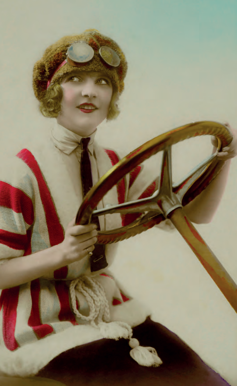
| Mujer automovilista