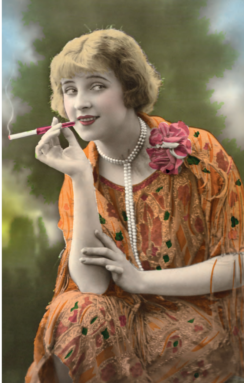
| Mujer fumando