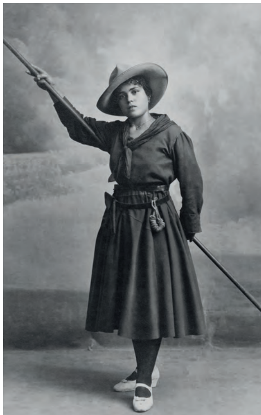
| Mujer vestida de exploradora Llopis. Valencia, España. 1921