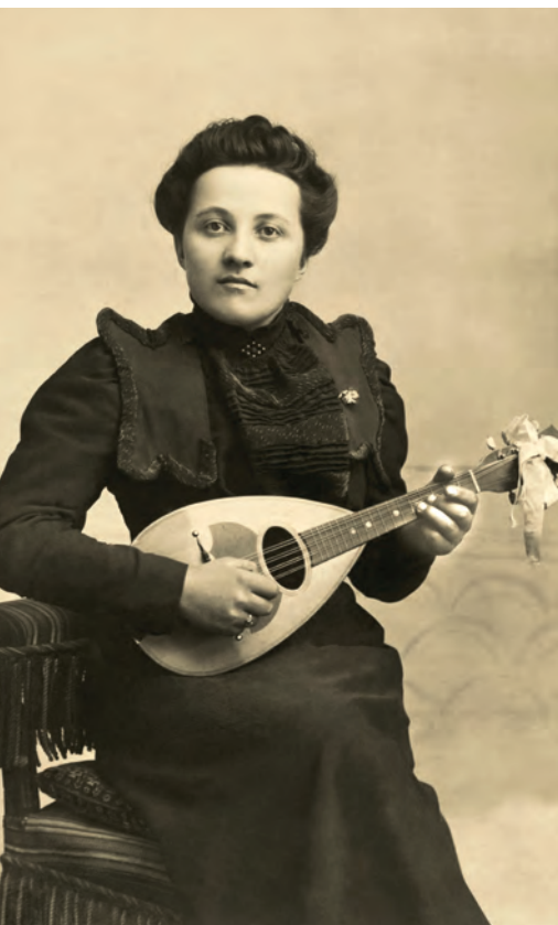
| Retrato de mujer con mandolina A. Mounier. Gap, Francia. 1899