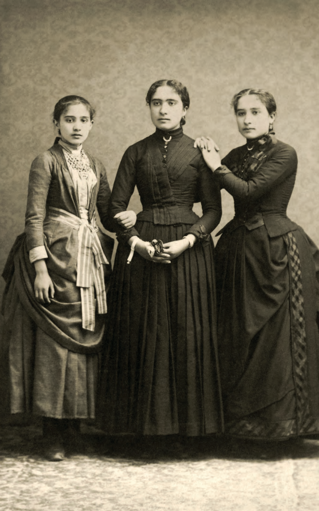
| Retrato de tres hermanas D. Bosch. Figueras, España. 1899