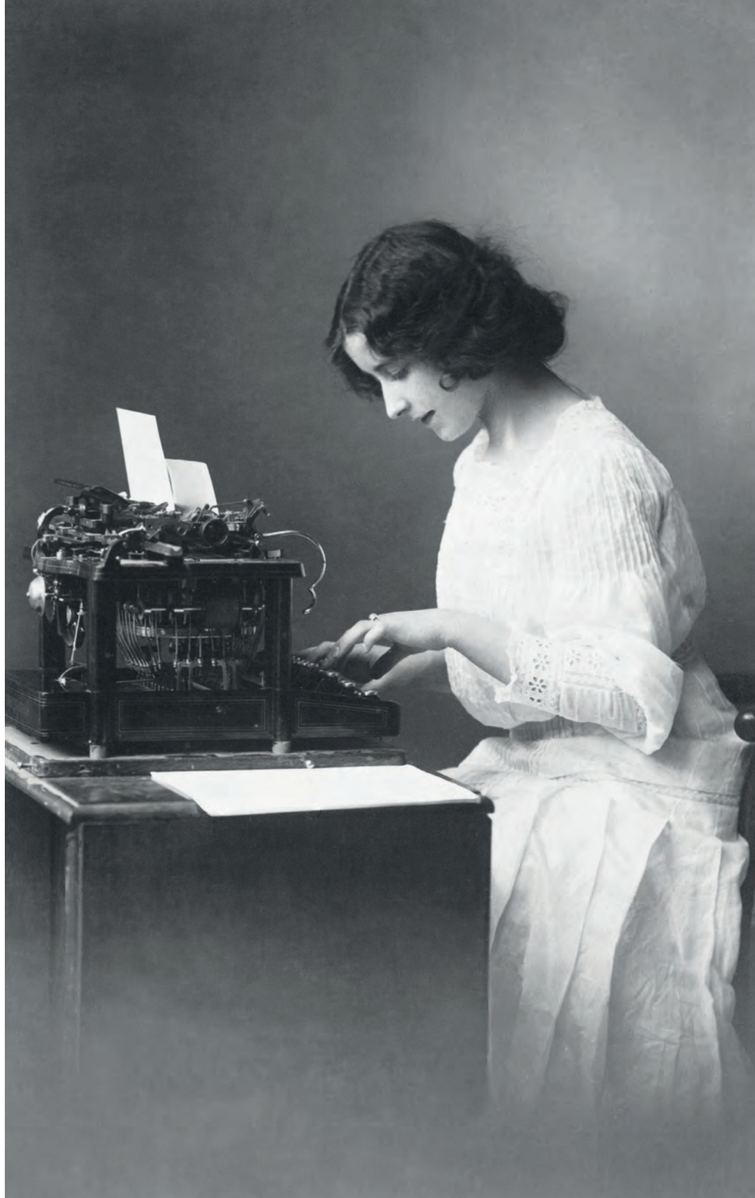
| Mujer escribiendo a máquina Colección PN. París, Francia. 1920