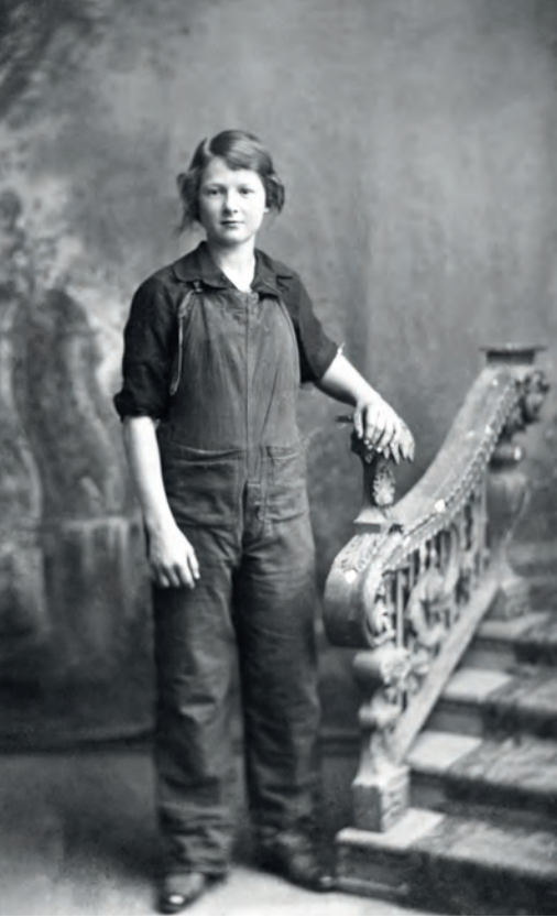
| Mujer vestida de obrera de fábrica Anónima. Maidstone, Inglaterra. 1927