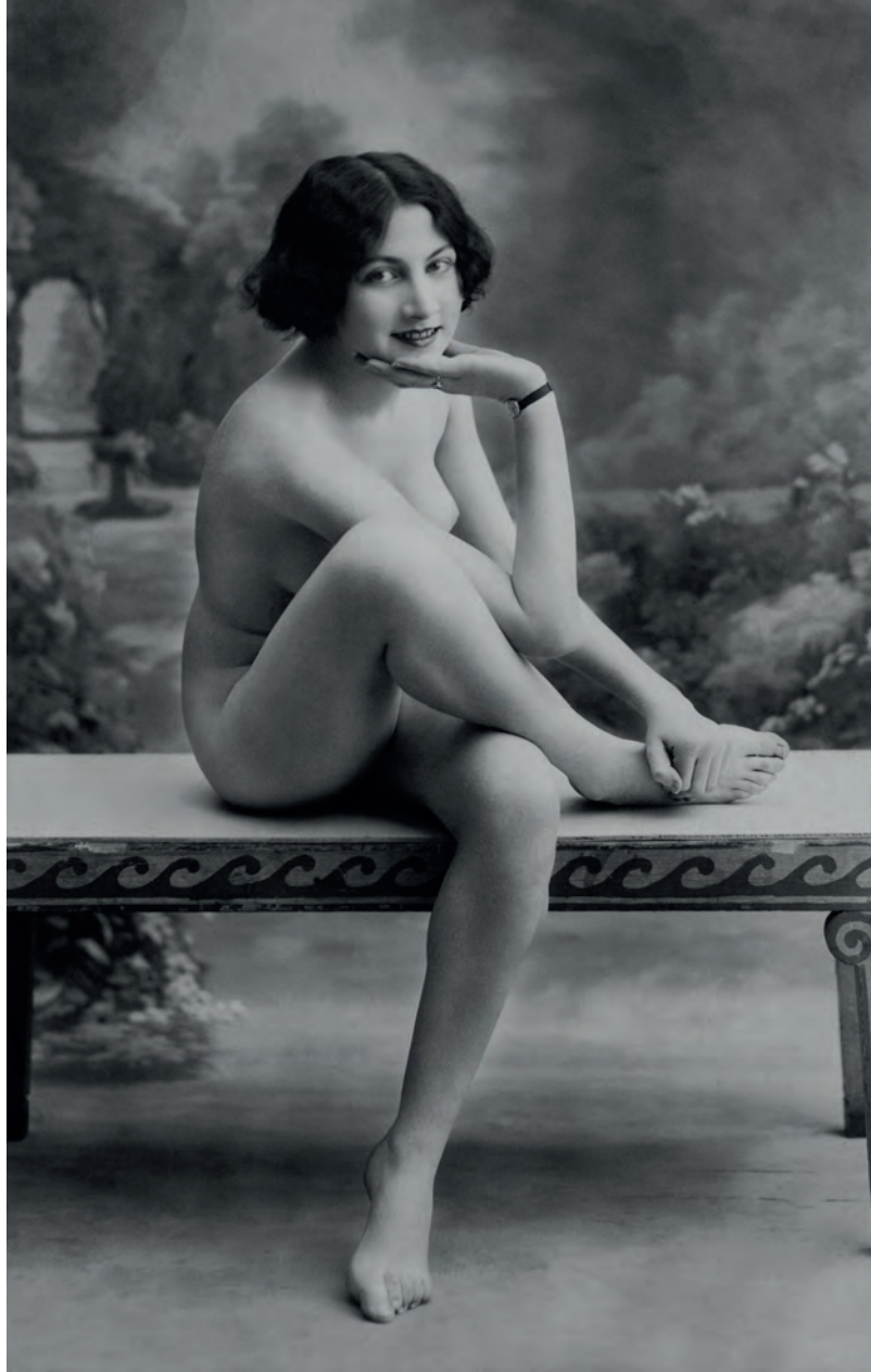
| Desnudo Anónima. París, Francia. 1912