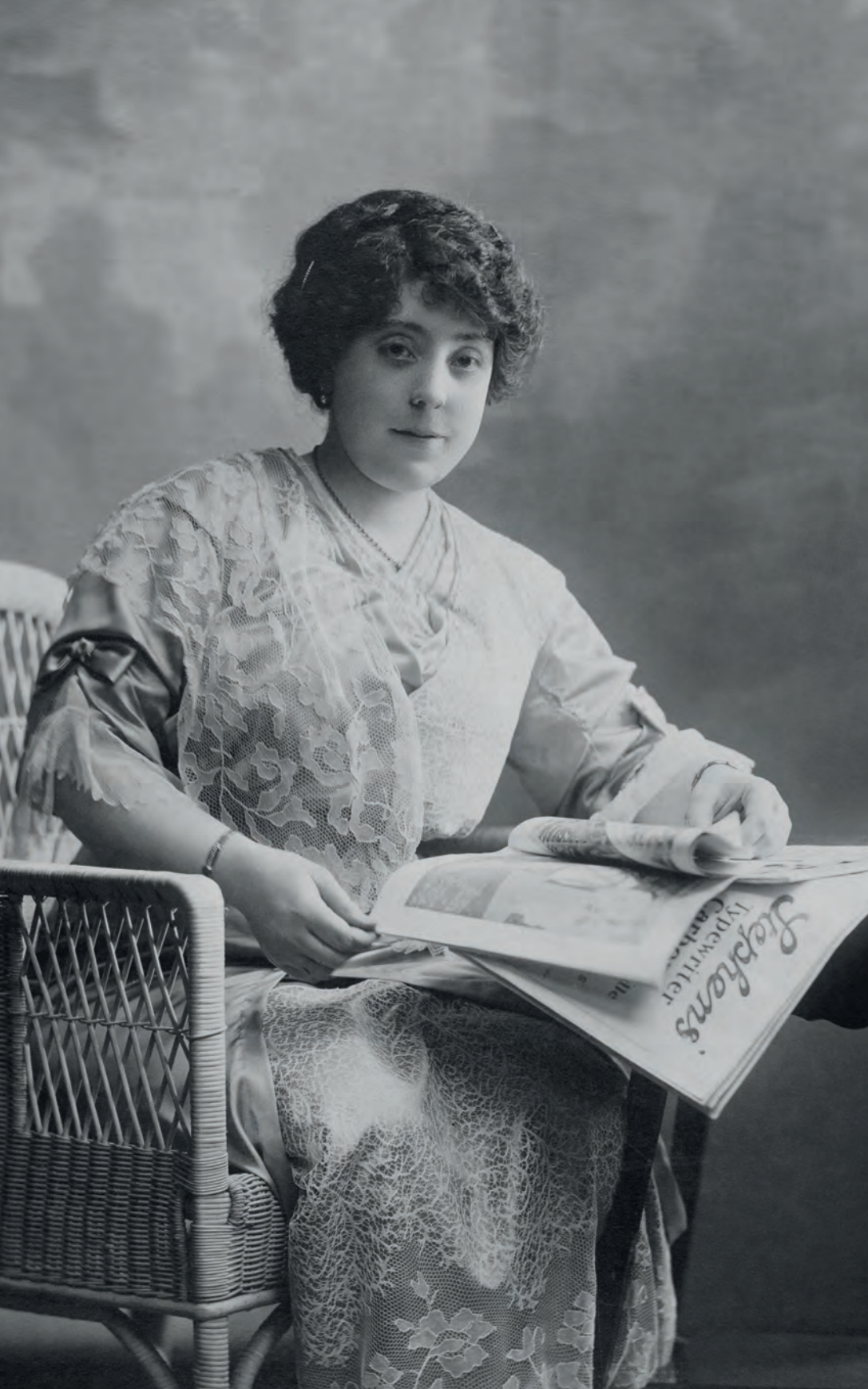
| Mujer leyendo diario Kávlak. Madrid, España. 1909