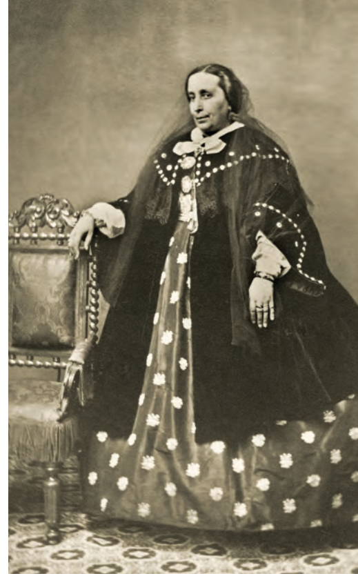
| Retrato de dama sobre fondo de paisaje E. Godínez. Sevilla, España. 1867