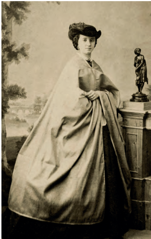
| Retrato de dama apoyada sobre un buró E. Otero. Madrid, España. 1874