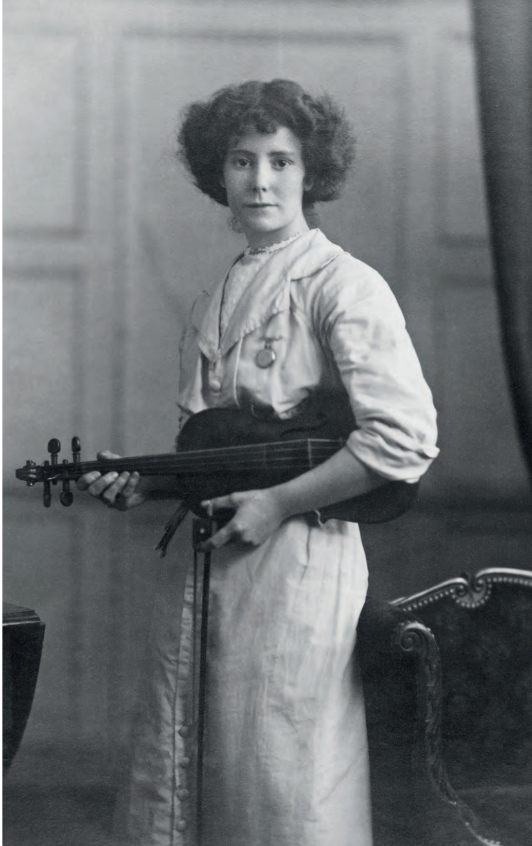
| Mujer con viola C.W. Greaves Ltd. Halifax. Inglaterra. 1913