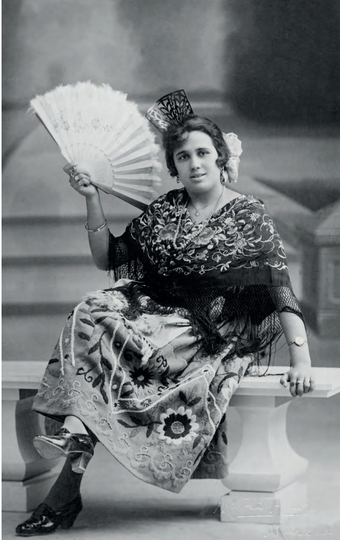
| Mujer vestida de huertana Mateo. Murcia, España. 1923