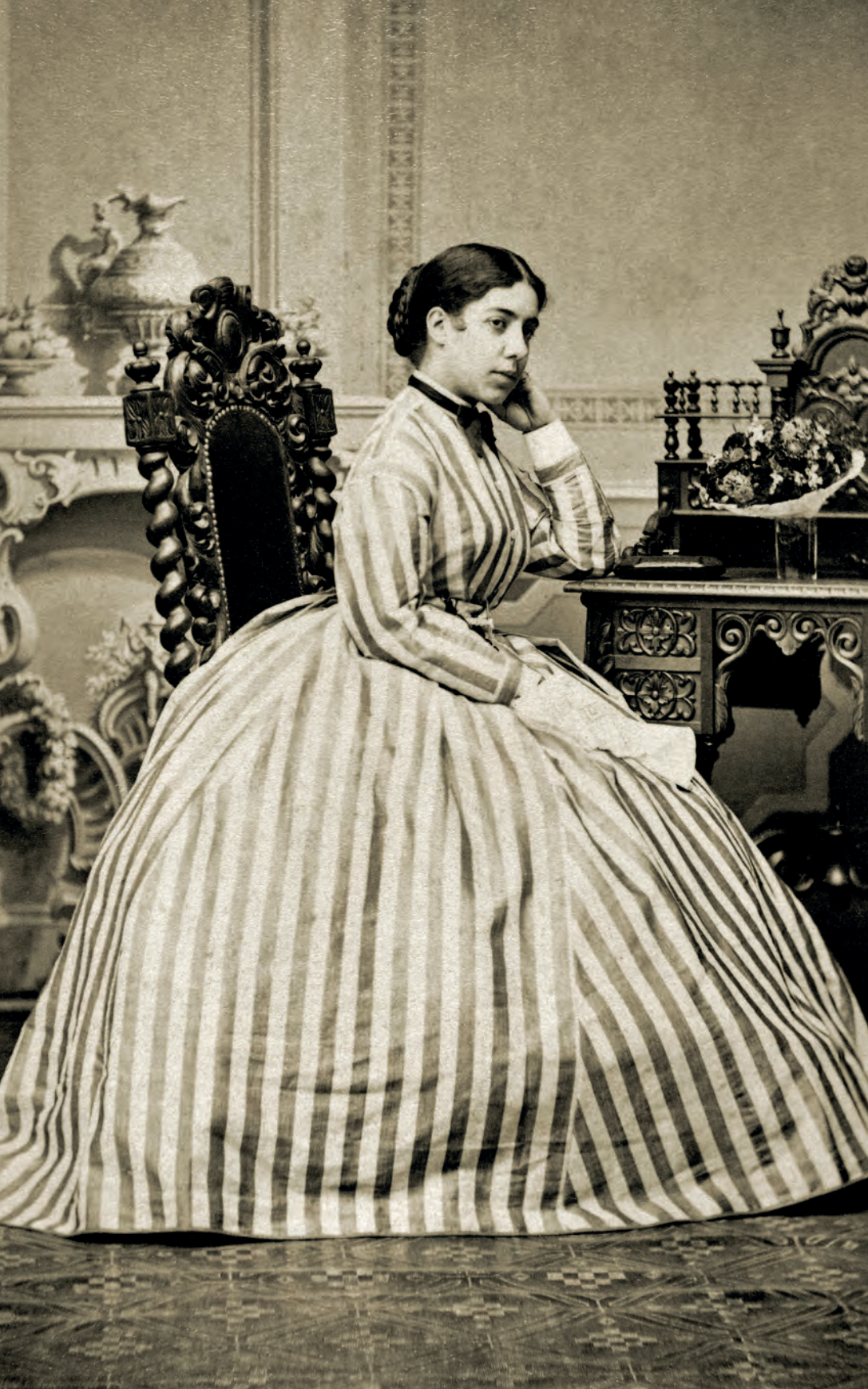
| Retrato de joven sedente F. Hertel. Weimar, Alemania. 1872