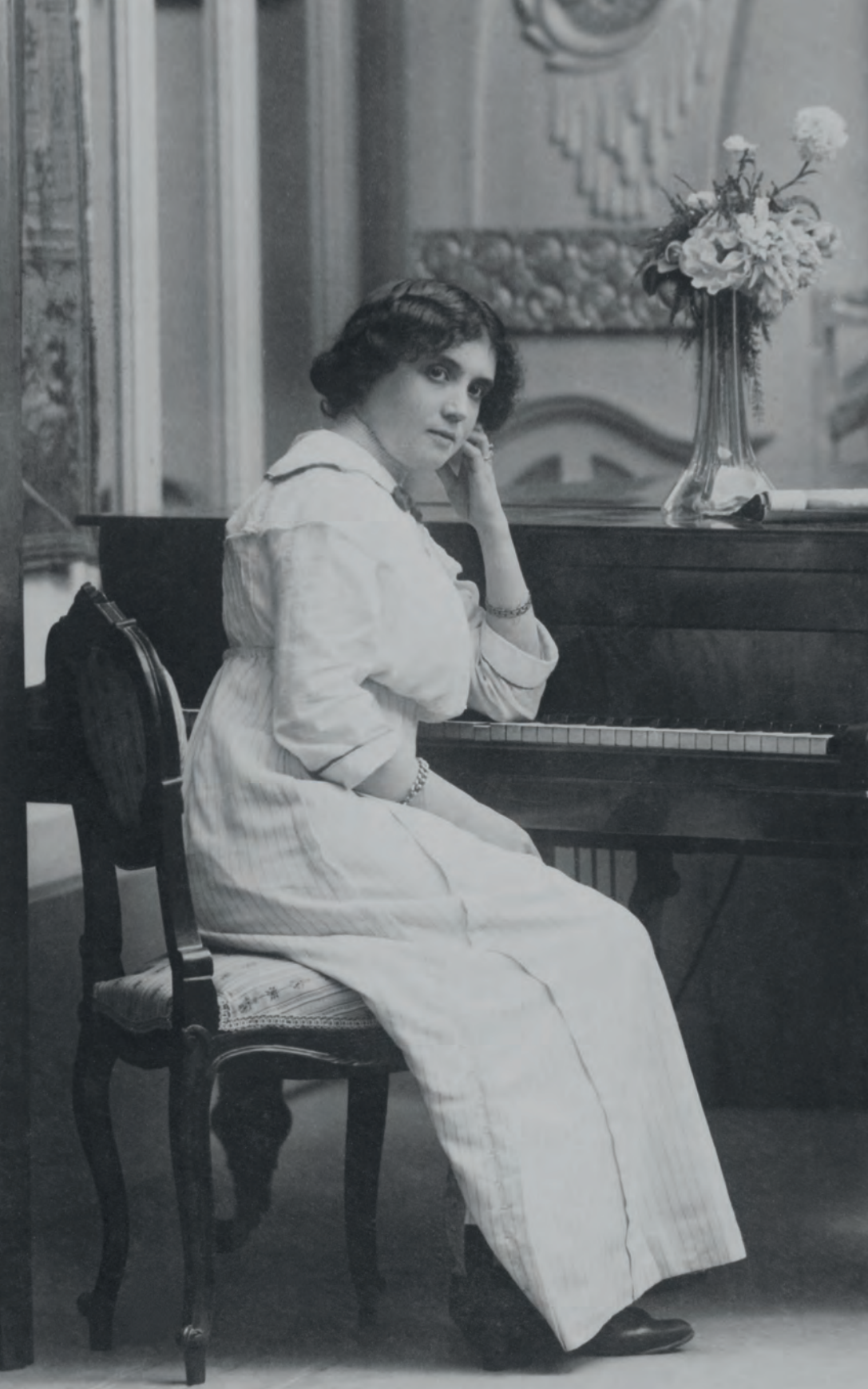
| Mujer con piano Modern Styl Ernest. Barcelona, España. 1914