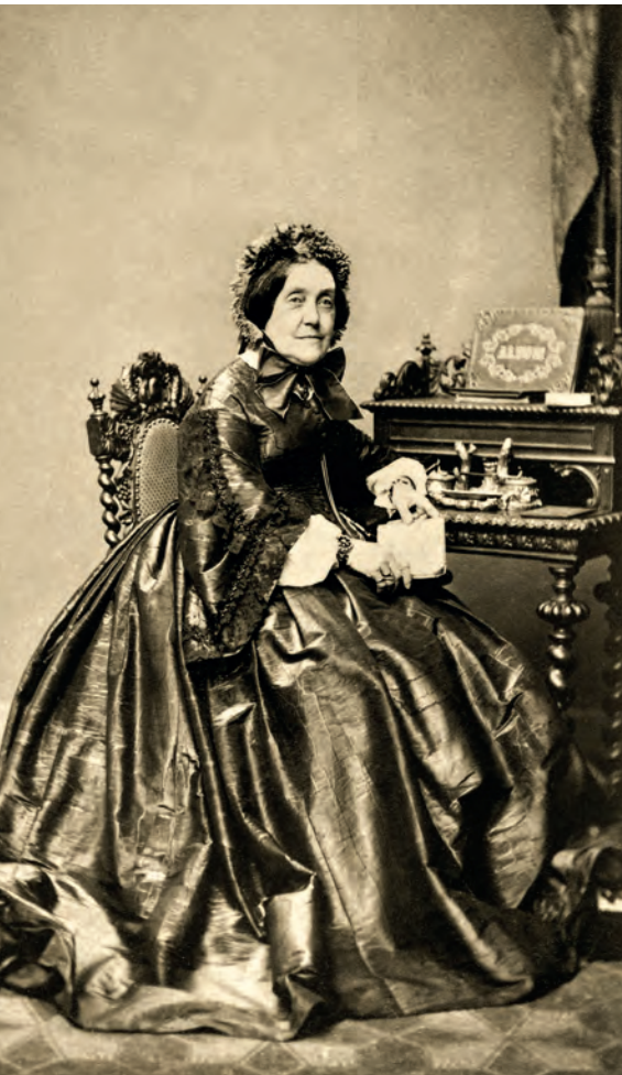
| Retrato de anciana con un álbum familiar W. Breuning. Hamburgo, Alemania. 1868

«Realidades y fantasías. Modelos de lo femenino (1860-1930)» es un ensayo que forma parte de los proyectos que desarrolla el Laboratorio de Investigación Fotográfica de la Universidad de Murcia (LIFUM), en torno a la recuperación, salvaguarda y puesta en valor de la fotografía doméstica, entendida en todas sus variantes de “álbum familiar”. En este sentido, desde el 2019, el grupo LIFUM viene efectuando exhibiciones de parte de sus fondos, colaborando con entidades privadas y públicas. Fruto de este último contexto es la presente muestra; un ejercicio que, realizado con la Unidad para la Igualdad entre Mujeres y Hombres de la Universidad de Murcia, une dos propuestas expositivas en un solo conjunto, como fueron: «Modelos de mujer en el siglo XIX. Una mirada fotográfica» y «Realidades e idealizaciones. Visiones femeninas entre 1900 y 1930». En consecuencia, se trata de un trabajo que, compuesto por un total de 71 imágenes, ahonda, conceptual y plásticamente, en las diferentes iconografías usadas para la representación de la mujer en la segunda mitad del siglo XIX y las primeras décadas del XX.