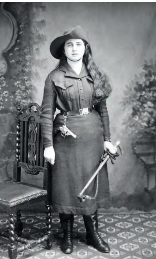
| Mujer vestida de domadora Anónima. Maidstone, Inglaterra. 1915