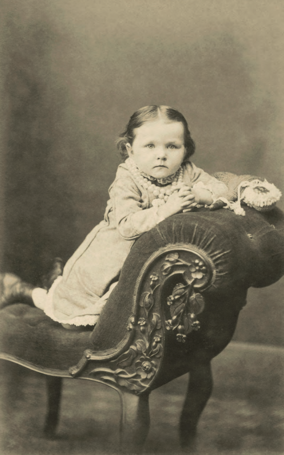
| Retrato de niña sobre diván W. H. Gill. Devonport, Australia. 1896