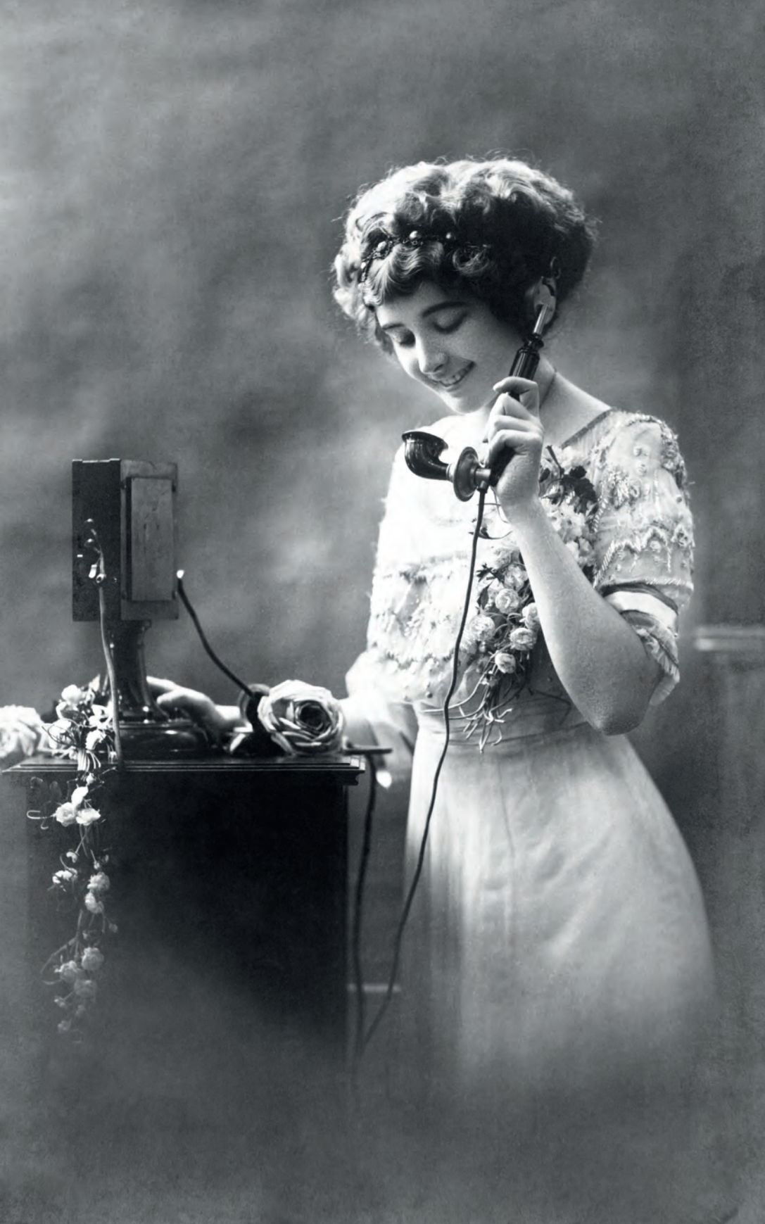
| Mujer hablando por teléfono París, Francia. 1912