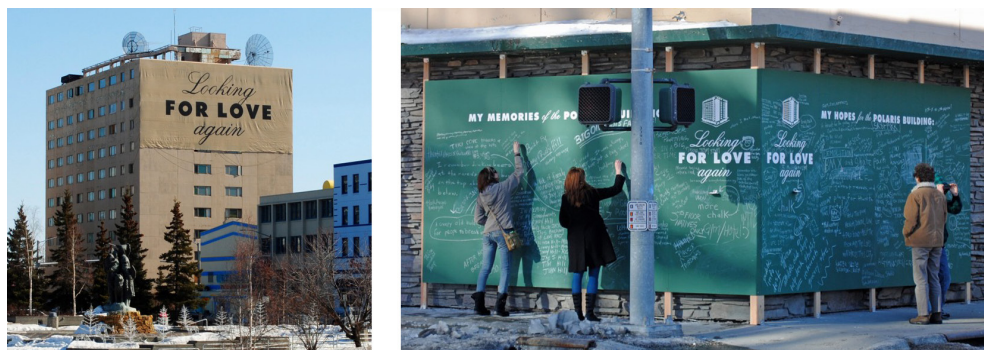
Figura 5. Looking for Love Again . Candy Chang, 2011.

urbanas realizadas por Alfredo Jaar en las calles de la ciudad de Santiago sobre el concepto social de la felicidad. “¿Es usted feliz?” era la pregunta que se les hacía a los viandantes. En el trasfondo dictatorial de aquellos años de represión, en los que las encuestas estaban prohibidas, adquiere claras connotaciones de denuncia política. Así, mientras que la publicidad intenta dar la respuesta a cómo conseguir la felicidad con el producto anunciado, estos carteles, por el contrario, se limitan a plantear preguntas, con el fin de que sea el receptor el encargado de encontrar una respuesta (Clemente, 2005). Suponen, en definitiva, una forma de activismo social que revela la complejidad del entramado vivo que habita y recorre la ciudad.