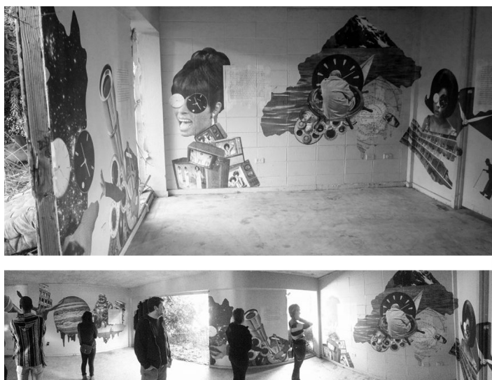
Figura 6. Estancias interiores del apartamento en el que se ubica Love Destroys Time . Candy Chang, 2014.