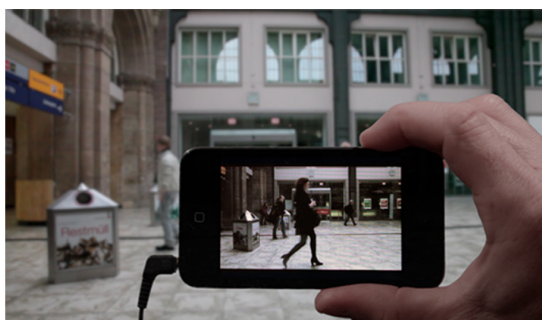
Figura 4A. Her Long Black Hair . Janet Cardiff, 2004.