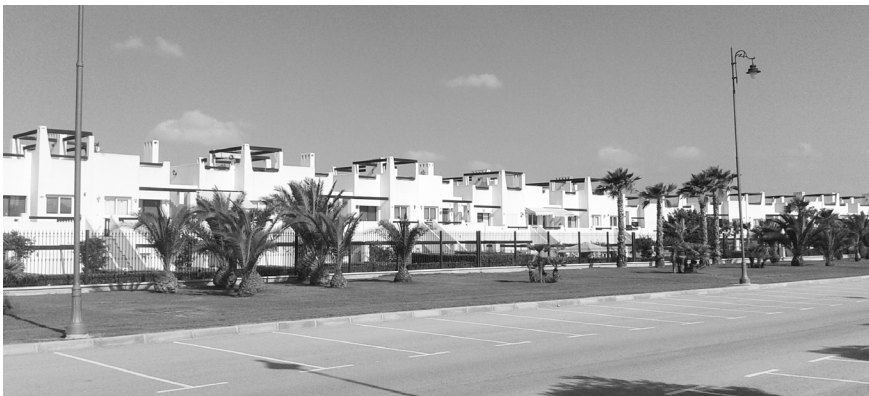
FIGURA 5 | Segundas residencias en la Urbanización Condado de Alhama (Costa Cálida, España)