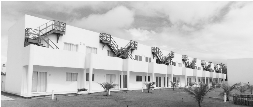
FIGURA 4 | Segundas residencias de arquitectura exógena en Pitangui, siguiendo el patrón edificador español