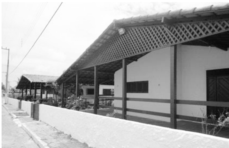
FIGURA 3 | Patrón de modelo convencional de segundas residencias (unidades aisladas) en Pitangui

El patrón de segundas residencias existente hasta entonces se caracterizaba por ser unidades aisladas con una misma tipología en la edificación (figura 3). Otros condominios fueron construidos con una arquitectura totalmente exógena al entorno (figura 4); entre ellos, los ubicados en el litoral mediterráneo español (figura 5).