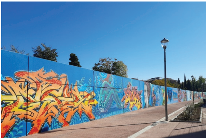
Figura 4. Muro cubierto de murales en 2021.

Pasando al análisis del último mural, Hilando culturas , de K-lina y Marta Pxzxs en 2021, hubo una opinión común sobre su localización. La tranquilidad caracteriza tanto al mural como a su entorno haciéndolos convivir para crear un nuevo conjunto. Otro punto interesante es la interpretación del mural en relación con La Chana: “Para él, el mural representa el futuro de La Chana. En su opinión, muestra cómo la generación más joven está siguiendo a su generación” (encuesta 41). Curiosamente, solo contra el contenido de este mural no se expresó ninguna opinión negativa. Según las respuestas, este mural es el que mejor refleja el carácter de La Chana: su tranquilidad y carácter familiar, la transmisión de tradiciones de generación en generación. Por lo tanto, no sólo es un elemento nuevo en el espacio, sino que también lleva a los encuestados, cuando se les pregunta por La Chana, a utilizar el mural como alegoría. La elección del emplazamiento para el mural también fue acertada: no sólo el escenario es una alegoría de La Chana, sino que el contenido de la obra parece relacionarse con ella, según los encuestados (36, 39, 40, 41). Así pues, el contenido del mural, su ubicación y el imaginario de La Chana interactúan entre sí.