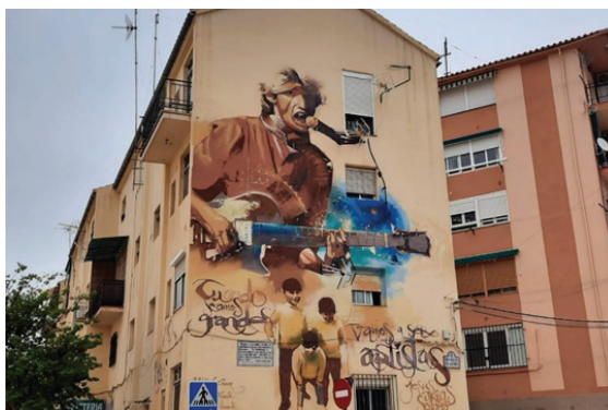
Figura 2. Mural de Jesús Arias pintado por El niño de las pinturas en 2017.

Así pues, el contenido del mural influye en la actividad de esta mujer, ya que lo convierte en parte de su práctica privada. También cabe señalar que el contenido del mural y la pregunta formulada permiten que surjan estas asociaciones y, por lo tanto, proporcionan cierta información sobre la encuestada, como por ejemplo a qué dedica su tiempo.