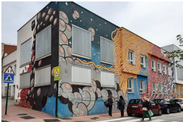
Figura 1. Primer mural en La Chana pintado por Boa Mistura en 2015.