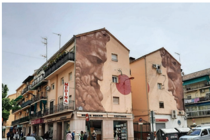
Figura 3. Hércules y Hermes pintado por Álvaro López en 2018.

Sin embargo, algunas personas buscaron los puntos fuertes del mural: da vida y alegría a la fachada (encuesta 15), el artista debe ser alguien experimentado en su oficio (encuesta 13). Otro encuestado dijo que “[...] aunque no entiende su significado, le gusta la obra” (encuesta 17).