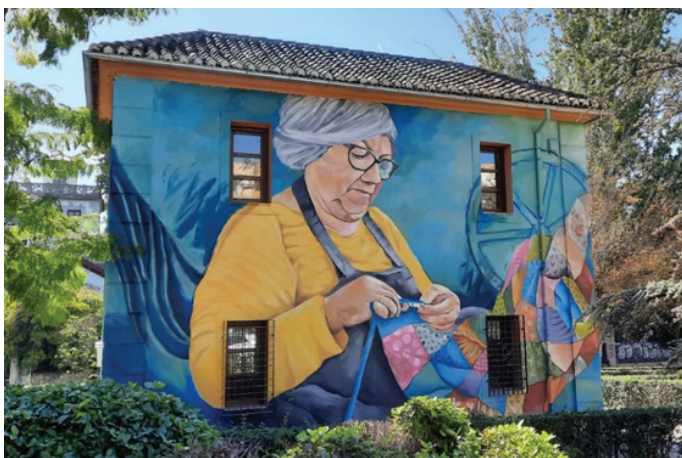
Figura 5. Mural Hilando culturas pintado por K-lina y Marta Pxzxs en 2021.

Pasando al análisis del último mural, Hilando culturas , de K-lina y Marta Pxzxs en 2021, hubo una opinión común sobre su localización. La tranquilidad caracteriza tanto al mural como a su entorno haciéndolos convivir para crear un nuevo conjunto. Otro punto interesante es la interpretación del mural en relación con La Chana: “Para él, el mural representa el futuro de La Chana. En su opinión, muestra cómo la generación más joven está siguiendo a su generación” (encuesta 41). Curiosamente, solo contra el contenido de este mural no se expresó ninguna opinión negativa. Según las respuestas, este mural es el que mejor refleja el carácter de La Chana: su tranquilidad y carácter familiar, la transmisión de tradiciones de generación en generación. Por lo tanto, no sólo es un elemento nuevo en el espacio, sino que también lleva a los encuestados, cuando se les pregunta por La Chana, a utilizar el mural como alegoría. La elección del emplazamiento para el mural también fue acertada: no sólo el escenario es una alegoría de La Chana, sino que el contenido de la obra parece relacionarse con ella, según los encuestados (36, 39, 40, 41). Así pues, el contenido del mural, su ubicación y el imaginario de La Chana interactúan entre sí.