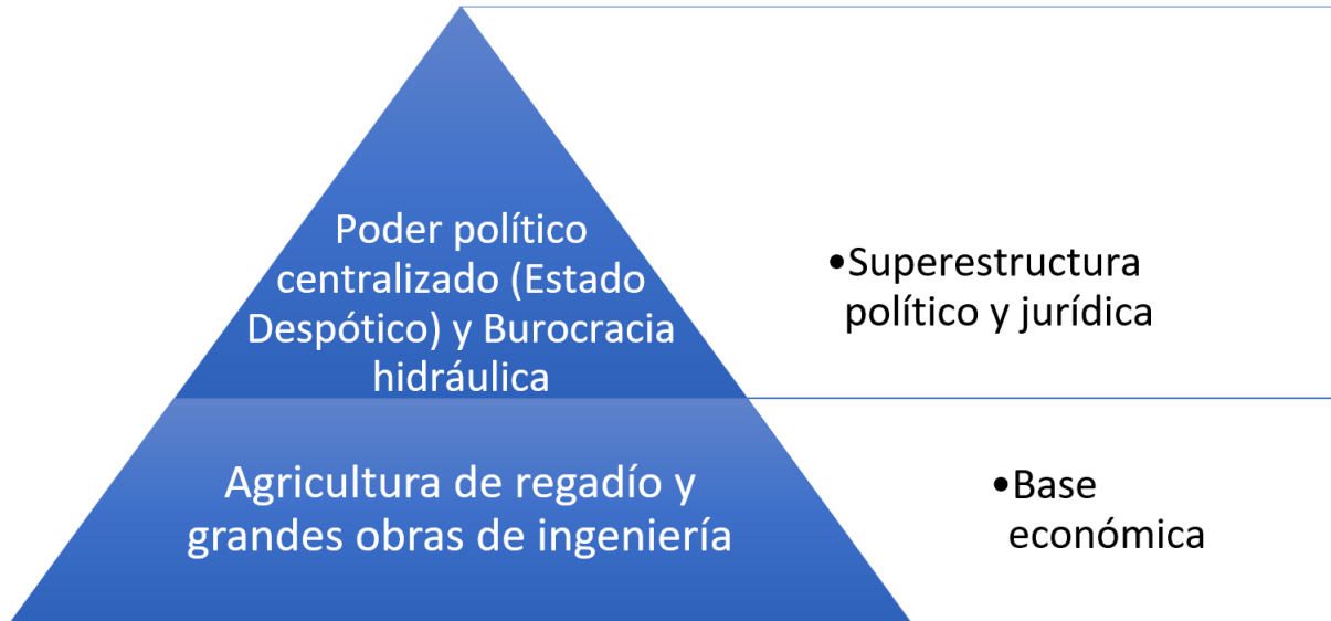
Figura 1. Esquema del Despotismo Oriental de las Sociedades Hidráulicas