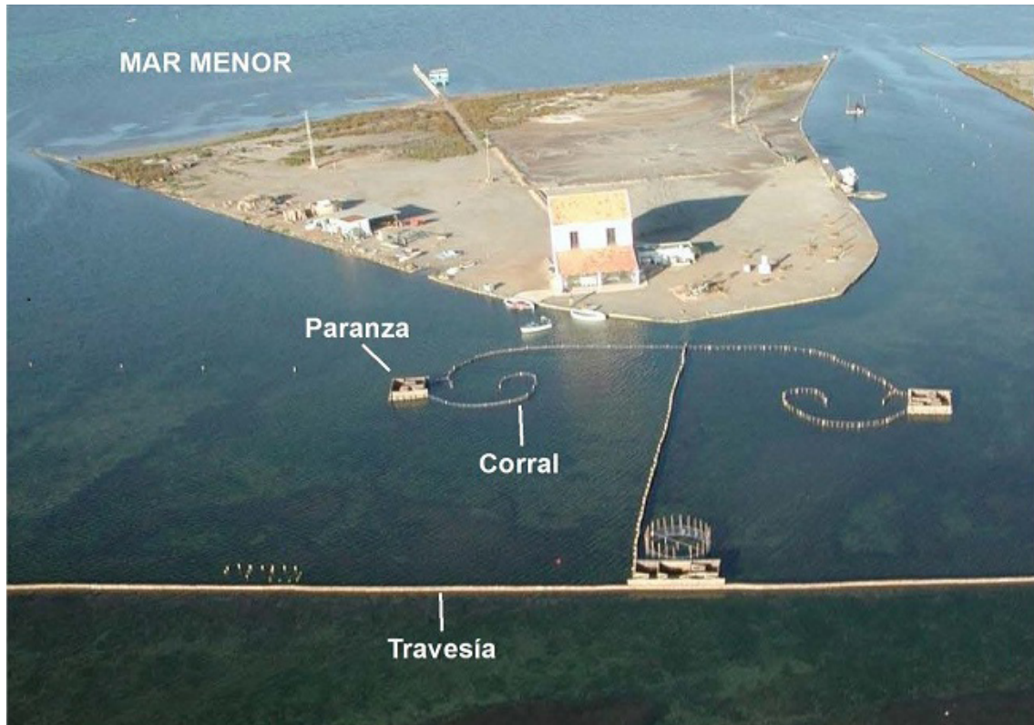
Imagen 5. Elementos esenciales del arte de pesca utilizados actualmente en las encañizadas (encañizada de La Torre).