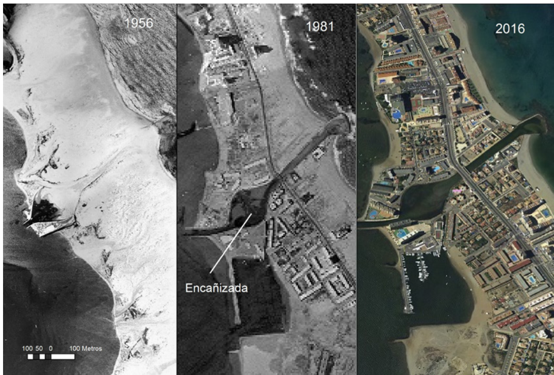
Mapa 4. Desarrollo urbanístico entorno a la encañizada de Marchamalo.