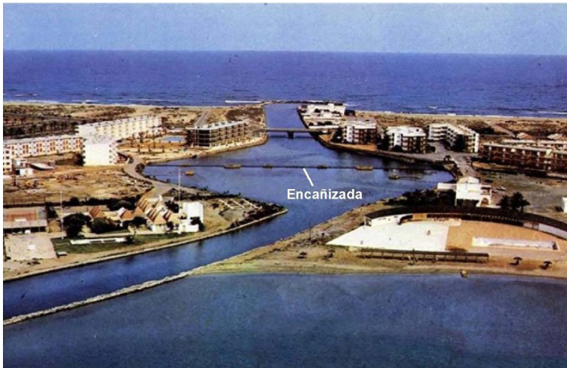
Imagen 3. Encañizada de Marchamalo en la década de los años 80