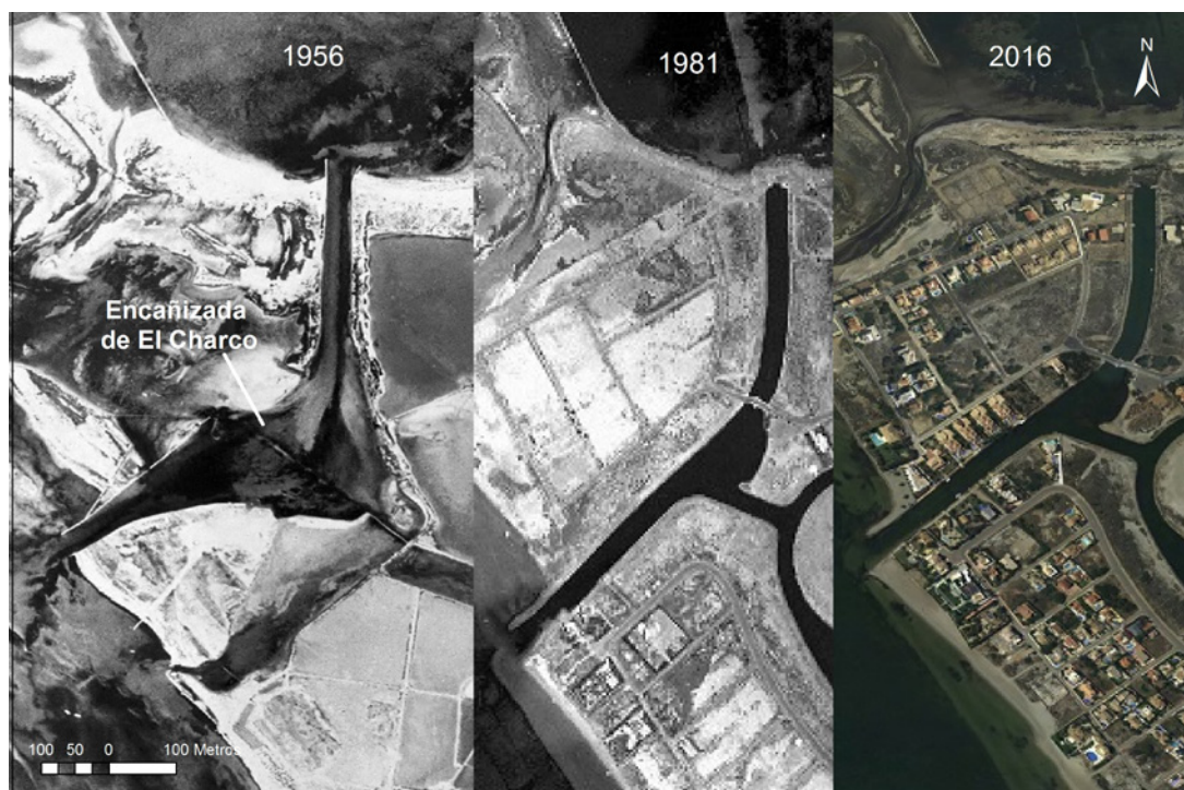
Mapa 2. Desaparición de la encañizada de El Charco y urbanización en su entorno.