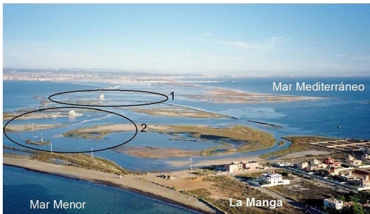
Imagen 4. Fotografía aérea de las encañizadas de El Ventorrillo (1) y La Torre (2).