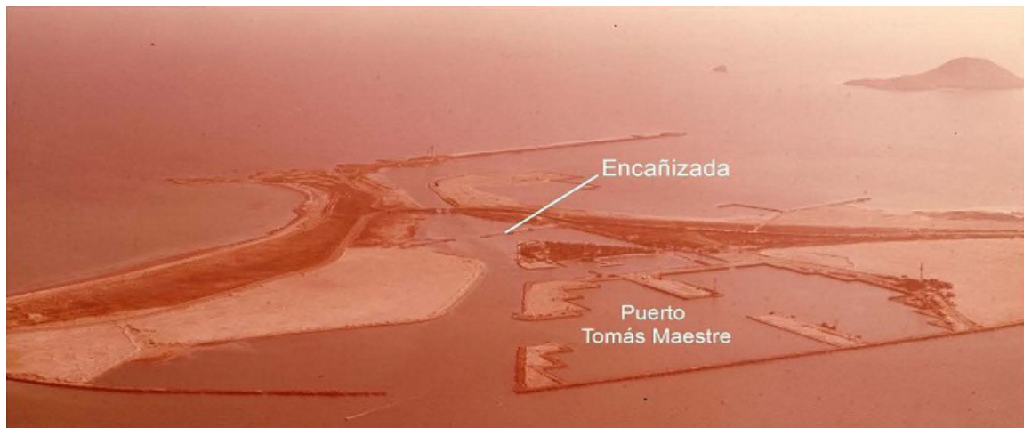
Imagen 1. Apertura de El Estacio para el paso de barcos a finales de los años 70.