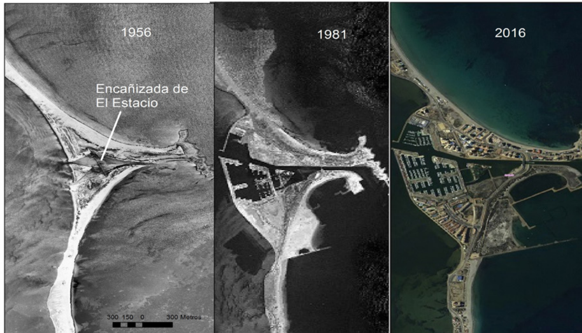
Mapa 3. Construcción del puerto deportivo «Tomás Maestre» y desarrollo urbano junto a la encañizada de El Estacio.