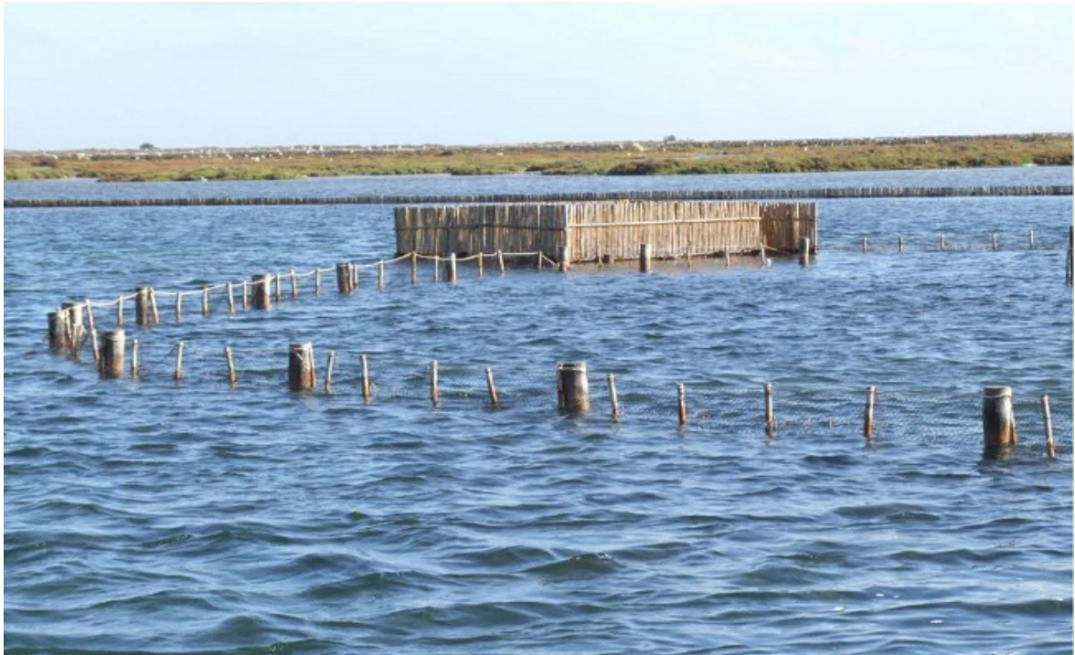
Imagen 6. Paranza en la Encañizada de La Torre

en cambio mayores en longitud y anchura. También se puede señalar que mientras las paranzas están fijas todo el año, los corrales o embustes solo se colocan en temporada –de julio a octubre–.