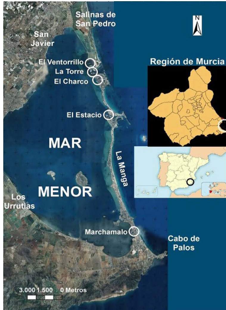
Mapa 1. Localización de las encañizadas del Mar Menor.

estrechas que comunican la laguna del Mar Menor con el Mar Mediterráneo, se desarrolló durante siglos un arte de pesca tradicional que consiste en bloquear dichos canales o golas mediante material de pesca fijo o móvil, que recibe el nombre de encañizadas y que ha perdurado hasta nuestros días (Mapa 1).