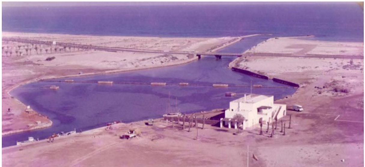
Imagen 2. Encañizada de Marchamalo a principios de los años 70.