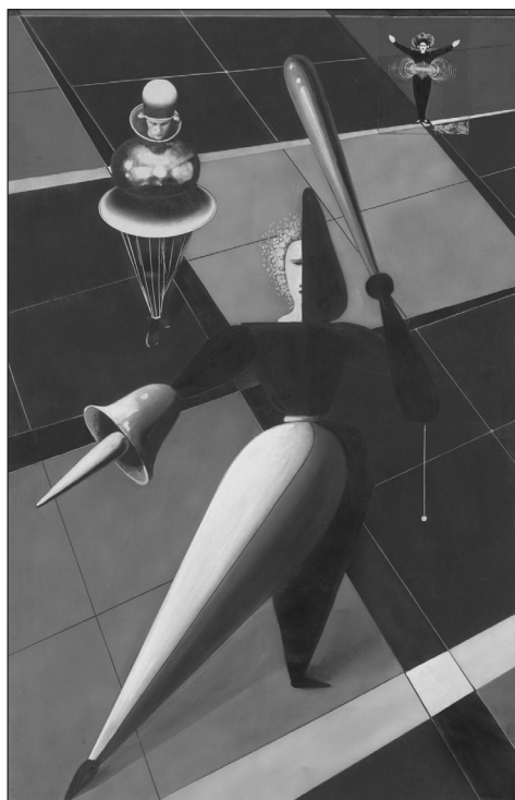
IMAGEN 8. Oskar Schlemmer, boceto para El ballet triádico , ca. 1924, gouache, tinta y collage sobre papel, 57,5 x 37 cm., MoMA, New York.

El cuerpo extático de la bailarina del cartel cuyos miembros se proyectan en el espacio infinito parece haber sido dibujado expresamente para negar esta separación entre lo funcional y lo lúdico, y afirmar a la inversa, un libre movimiento de los cuerpos libres homólogo al movimiento de las máquinas. Pero en ese caso es la película la que se convierte en una prueba para verificar esta adecuación. Sabemos que la película de Vertov se presenta como la aplicación radical de lo que en su cartel se anuncia: la manifestación de un arte totalmente convertido en vida y acción. No hay representación, solamente acciones, esas acciones que se realizan todos los días en las casas, las calles, las fábricas, las tiendas, los estadios o los clubs obreros. Pero la película no es una narración de estas acciones. Es la acción de coordinarlas, de materializar el vínculo de todas estas acciones organizándolas en una cosa-película que es ella misma una producción entre todas las producciones que construyen la nueva vida. Su operación principal consiste en igualar todas las acciones: al fragmentarlas en fragmentos cortos y al montarlas con un ritmo sincrónico