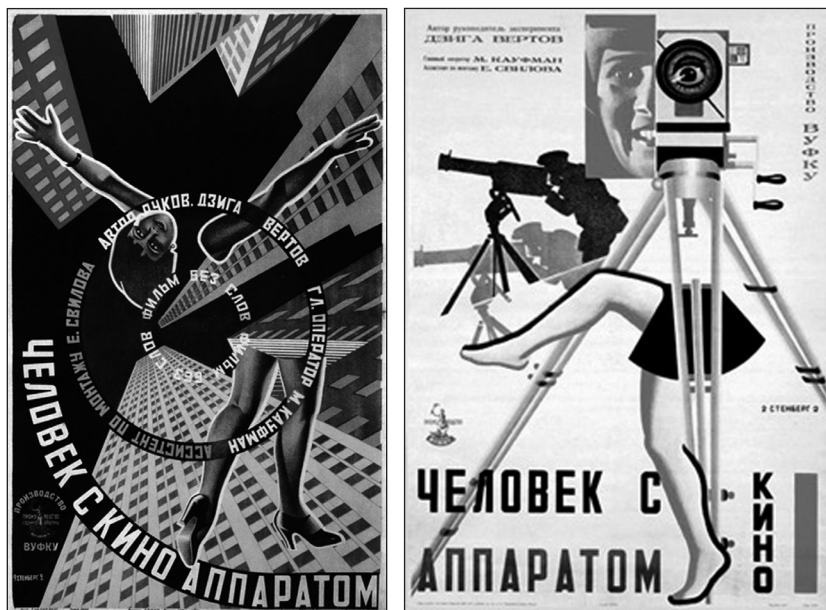
IMÁGENES 1-2. Vladimir A. Stenberg y Georgii A. Stenberg. Carteles para El hombre de la cámara , 1928.

Nos presentan la fusión de todos esos elementos en una superficie plana. Pero hay que entender bien lo que supone este aplanamiento. En efecto, no se trata simplemente de definir un denominador común que homogenice todos los elementos. Para poder unirlos, primero hay que destruir las jerarquías que les son inmanentes independientemente. Cada uno de ellos está habitado por una contradicción interna: ver no es lo mismo que ver, lo sabemos desde Platón, supone ser un espectador de sombras o un contemplador de lo bello. Hablar no es lo mismo que hablar –lo sabemos desde Aristóteles: existe la voz animal que expresa dolor o placer y existe el discurso humano que discute sobre lo justo y lo injusto. Sucede lo mismo, a fortiori , con el concepto que es central en el pensamiento de un arte enteramente moderno y enteramente político, el concepto de acción. La acción no supone hacer cualquier cosa en general. Supone una manera de hacer que expresa una determinada manera de ser. «Actuar», de hecho, se divide en dos. Existe la actividad de invención que los griegos han llamado poiesis , la que produce medios destinados a determinados fines, y existe la actividad que es, en sí misma, su propio fin a la que llamaron praxis .