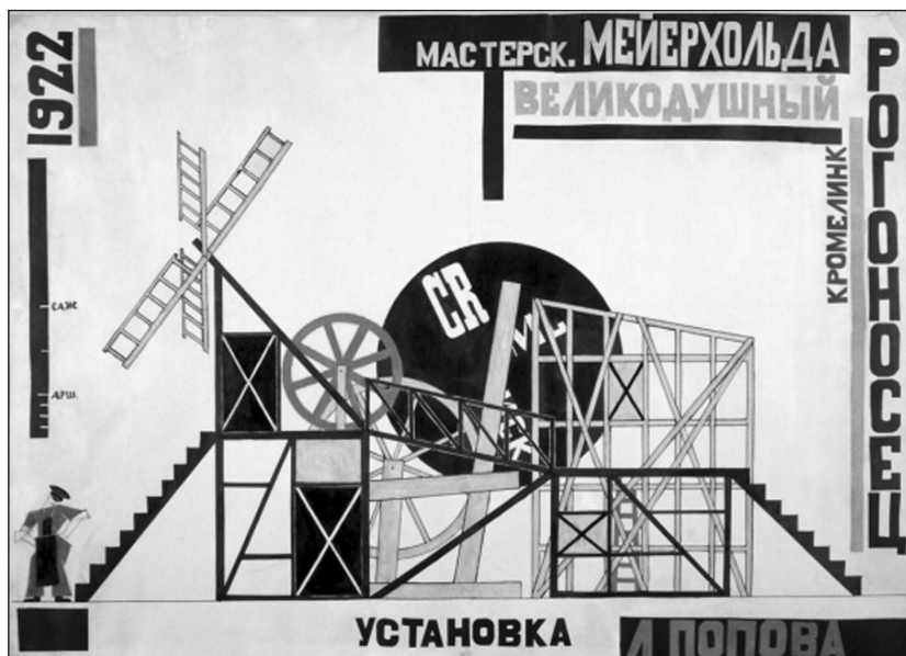
IMAGEN 5. Liubov Popova, cartel para El magnífico cornudo de F. Crommelynck, 1922; acuarela, gouache y collage sobre papel 50 x 69 cms. Galería Tetriakov. Moscú.

Observemos por ejemplo este dispositivo escénico concebido por Liubov Popova para la puesta en escena de «El Magnífico Cornudo» [IMAGEN 5]. Lo que este dispositivo ofrece a los actores no es el equivalente de la cadena taylorista. Es una máquina de juegos con sus escaleras, sus aparatos de gimnasia y toboganes que les permitirá transformarse ellos en gimnastas y transformar una comedia de costumbres burguesa en una serie de ejercicios acrobáticos y burlescos. Entre el sueño artístico-político de la acción directa sustituyendo a la vieja lógica representativa, y el sueño socialista taylorista, la coincidencia tan sólo es aparente: bajo el filtro de la racionalización taylorista, el modelo de la nueva actuación teatral no es el del obrero adaptado a su máquina, es el del acróbata que no se preocupa por nada ajeno a su actuación. O bien es el nuevo mimo, no el mimo expresivo soñado por Diderot sino el nuevo mimo mecánico, aquel cuyos gestos no imitan la eficacia de las máquinas sino su movimiento automático y repetitivo. Mirando el cartel en donde los miembros de la bailarina se transforman en hélice de avión, recordamos otra serie de dibujos soviéticos consagrada al mimo mecánico por excelencia, el que los artistas de la vanguardia soviética toman siempre como modelo, Charlie Chaplin. En dicha serie de dibujos realizada para el periódico Kino-Phot por Varvara Stepanova, vemos los gestos torpes del payaso de paso vacilante y a