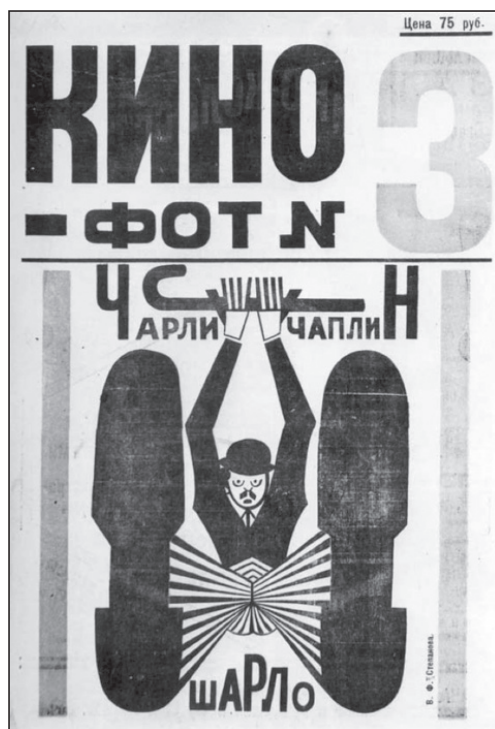
IMÁGENES 6 y 7. Varvara Stepanova, ilustraciones para Kino-Phot , 1922.