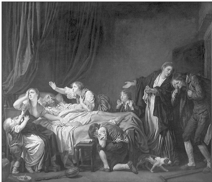
IMAGEN 3. Jean Baptiste Greuze, El hijo castigado , óleo sobre lienzo, 130 x 163 cm., Louvre, 1778.

que pueden desfilar en un desfile del Primero de Mayo, sino a un cuerpo dismantelado como los que representan los pintores cubistas o surrealistas. En general, esta es la razón por la que la destrucción del orden representativo no puede realizarse mediante un simple suplemento de acción y de expresión. Para ello, es necesario que los efectos de esta «activación» se combinen con los de un movimiento exactamente inverso: una pausa del movimiento y una ausencia de expresión.