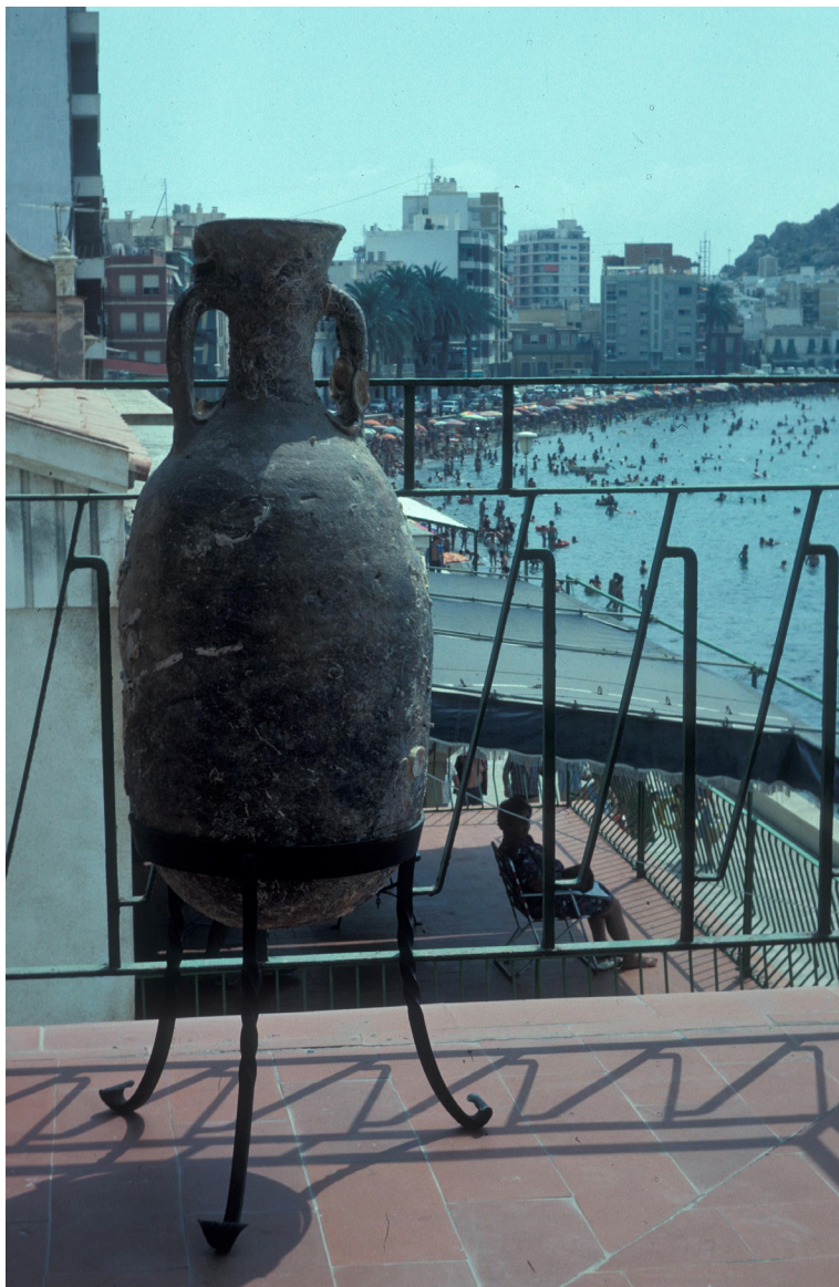
fig. 3. Ánfora romana tipo Haltern 70 expuesta en un balcón de Águilas durante los años 70 del siglo xx