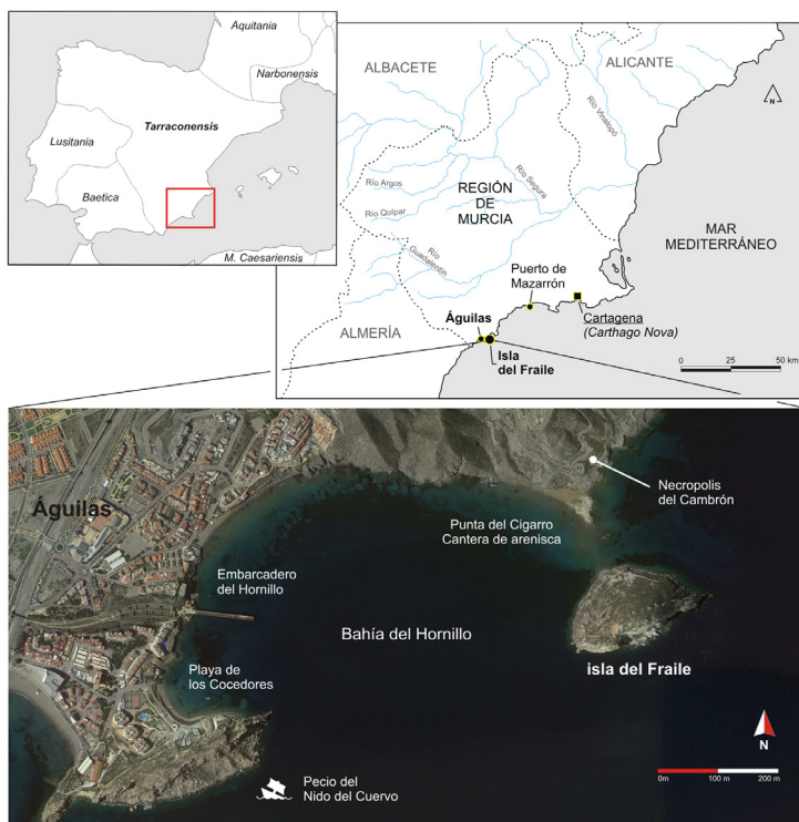
fig. 1. La isla del Fraile y la bahía del Hornillo (Águilas, Región de Murcia), principales zonas analizadas durante la prospección subacuática

o fondeaderos en el entorno de la isla, determinar cuál fue su inserción en los circuitos comerciales del momento y analizar las fases de mayor actividad en la bahía del Hornillo entre la Antigüedad y la Edad Moderna. En las páginas que siguen se recogen, de manera sintética, los primeros avances de la investigación (para un análisis en profundidad véase Quevedo et alii , en evaluación).