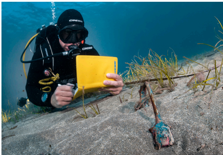
fig. 5. Momento del hallazgo del asa de bronce de una jarra romana, posteriormente recuperada y restaurada

especialmente singulares un spatheion 3 africano y un plato de terra sigillata africana D decorado en estilo E (ii), un posible tipo Hayes 103 o 104, pues suponen las primeras evidencias de circulación en torno al siglo VI, pudiendo perdurar incluso hasta el siglo VII.