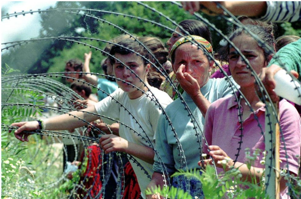
Figura 10. Foca, en el Hotel Vilina Vlas, Grbavica o Vogosca fueron puntos de un sistema de campos de concentración de mujeres, donde se violó y se torturó desde niñas de seis años hasta ancianas de 70.