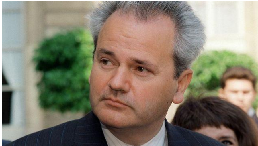
Figura 2. Slobodan Milošević, retratado en 1991 en París.