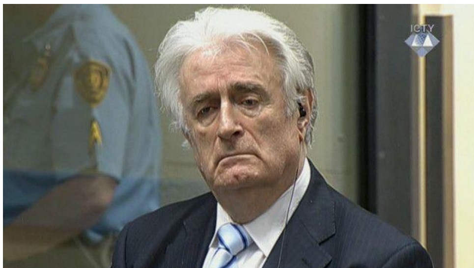
Figura 5. Radovan Karadžić mientras escuchaba el veredicto.