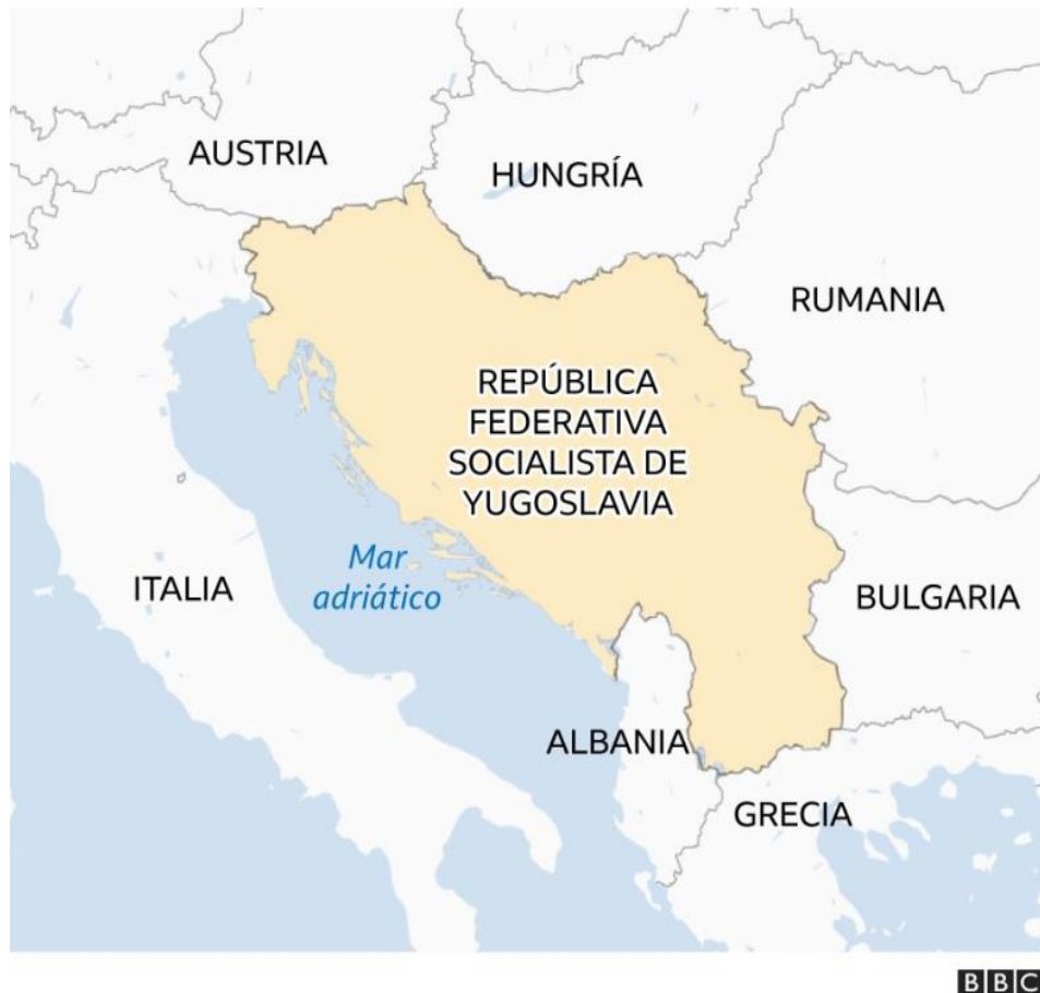
Figura 1. República Federativa Socialista de Yugoslavia (1943-1991).

Fuente: BBC News Mundo. Recuperado de https://www.bbc.com/mundo/noticias-internacional-57560270 (Consultado el 20/05/2023)