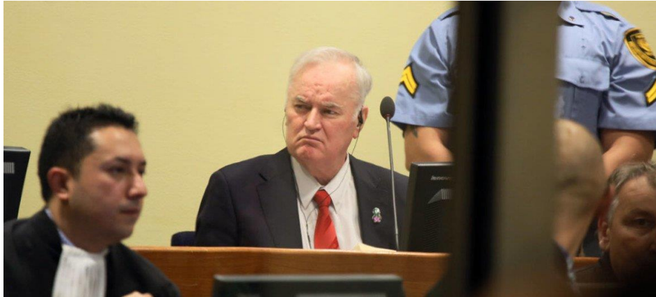
Figura 9. Ratko Mladić, ex comandante del Ejército Serbiobosnio, ante el TPIY.