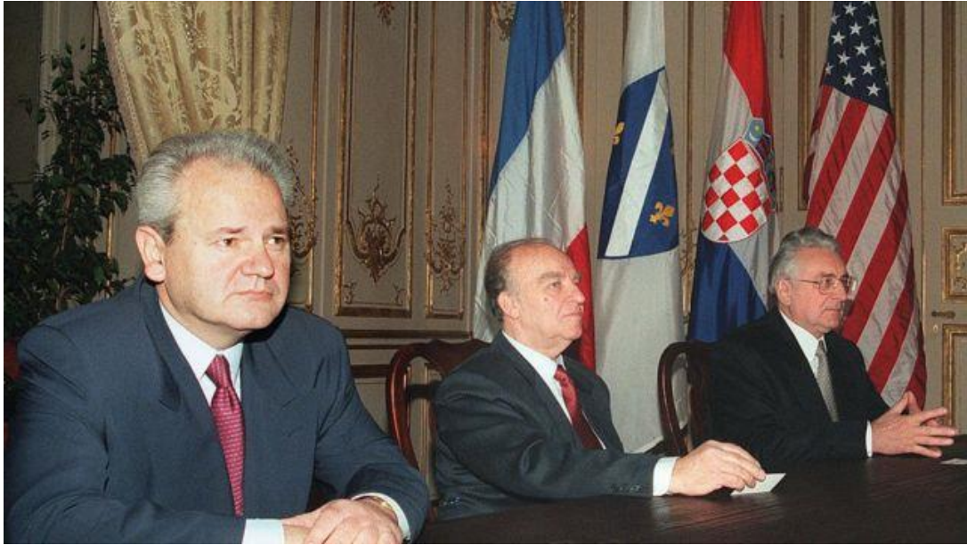
Figura 3. Milošević, Izetbegović y Tuđman en París, tras firmar los Acuerdos de Dayton en 1995.