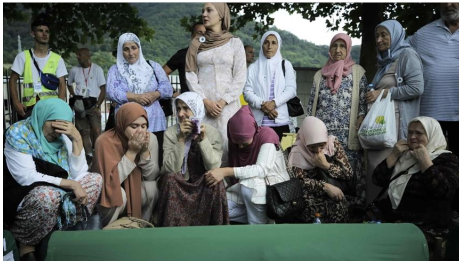
Figura 8. Varias mujeres lloran por sus familiares cerca de los ataúdes antes del 27 aniversario del genocidio de Srebrenica, ocurrido en 1995 en Bosnia y Herzegovina, luego de que 50 cuerpos fueran identificados recientemente.