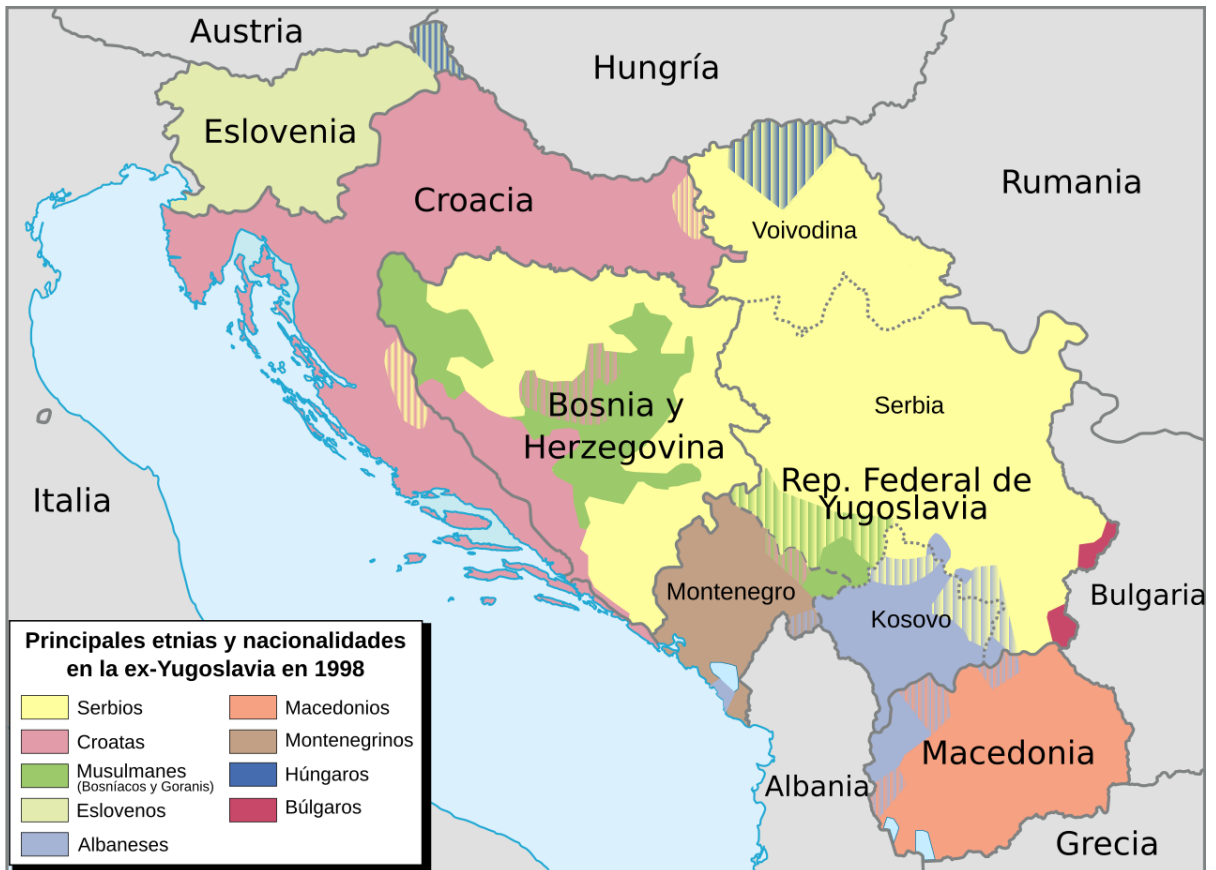
Figura 3. Principales etnias y nacionalidades en la ex Yugoslavia en 1998. Se aprecia la conversión de Croacia en una república prácticamente monoétnica, con una proporción mucho menor de serbios a comparación con el mapa de 1991.