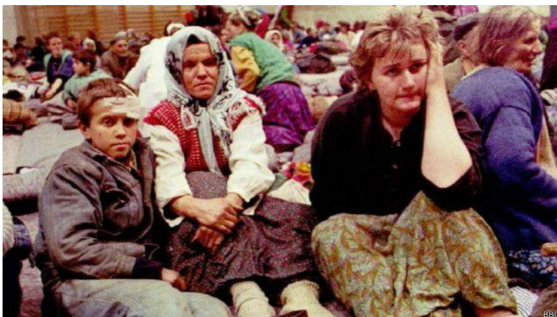
Figura 6. Las tropas serbobosnias separaron a los hombres y niños de las mujeres.