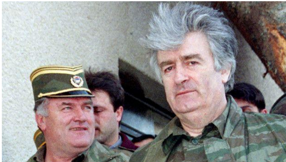
Figura 4. Radovan Karadžić y Ratko Mladić, dos de los principales cerebros de la masacre de Srebrenica.