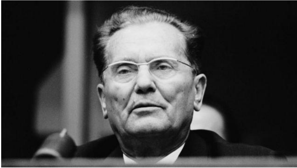
Figura 1. El Mariscal Josip Broz Tito en 1963.