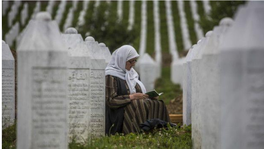
Figura 7. En el cementerio de Potocari, junto a Srebrenica, está la mayor parte de las víctimas.