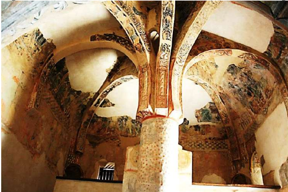
Figura 4: Interior de la ermita de San Baudelio de Berlanga

Tanto la ubicación como la composición artística y arquitectónica de esta ermita se entienden si nos remontamos a la época en la que fue erigida. Aunque se desconoce la fecha exacta, debió de ser construida a finales del siglo XI, en torno a un monasterio advocado a la figura de San Baudelio y erigido sobre un manantial y una cueva, seguramente empleada por algún eremita, como se ha mencionado con anterioridad (Guardia, 2011; Zozaya Stabel-Hansen, 1976).