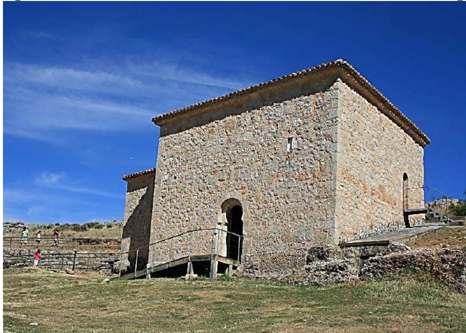
Figura 3: Exterior de la ermita de San Baudelio de Berlanga