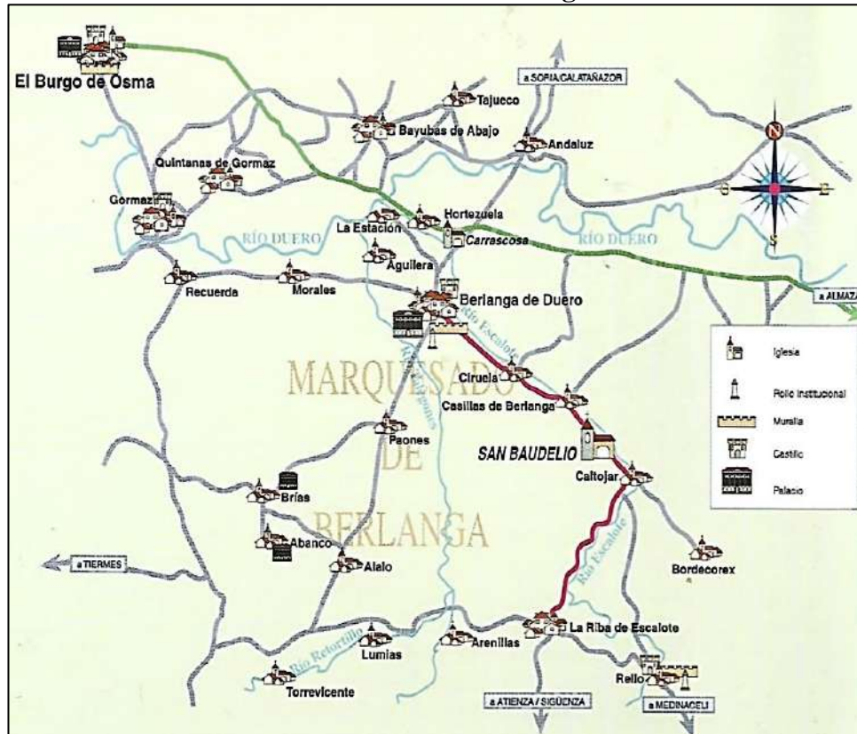
Figura 2: Esquema de situación de la ermita de San Baudelio de Berlanga