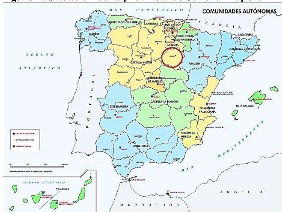
Figura 1: Situación de la provincia de Soria en España