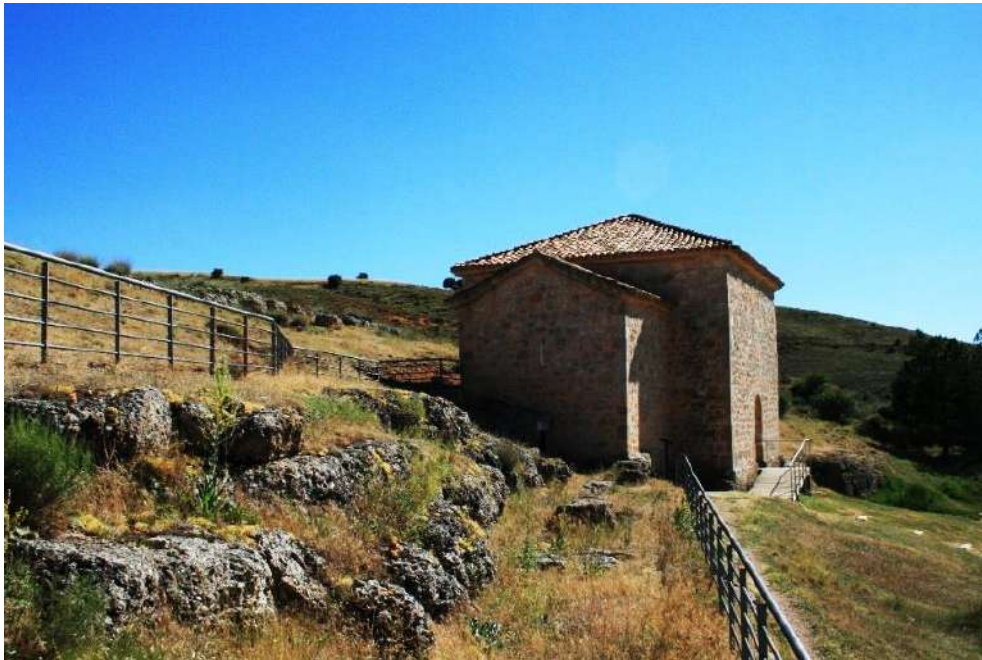
Figura 7: Detalle del sencillo acondicionamiento exterior a la ermita

Este espacio, a juicio del autor, se encuentra correctamente acondicionado para las visitas, ya que, dadas las pequeñas dimensiones del edificio y su fragilidad, no es conveniente ni necesario que albergue una gran y continua afluencia de visitantes. Sin embargo, sí que podrían realizarse algunas pequeñas mejoras que organizaran la entrada y salida tanto de vehículos como de personas, dadas las pequeñas dimensiones del lugar.