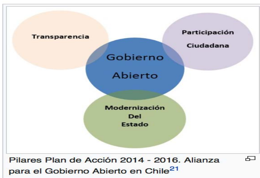
Figura 1. Principios del gobierno abierto.

El gobierno abierto es un modo de interacción sociopolítica, basado en la transparencia, la rendición de cuentas, la participación y la colaboración, que insta una manera de gobernar más dialogante, con mayor equilibrio entre el poder de los gobiernos y de los gobernados, al mismo tiempo que reconoce a la ciudadanía un papel corresponsable. Los fines pretendidos son la mejora en la toma de decisiones y la implicación de los ciudadanos en la gestión de lo público, a través de un aumento del conocimiento y la puesta en marcha de la innovación pública (Criado y Pastor, 2018, p. 7).