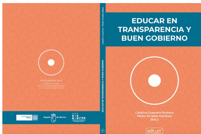
Imagen 1. Cubierta del libro Educación en Transparencia y Buen Gobierno