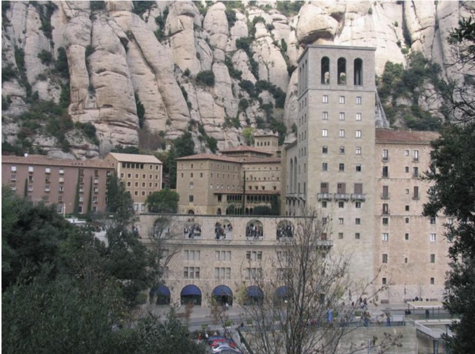
Figura 2 VISTA DEL MONASTERIO DE MONTSERRAT

lo que respecta a sus características geológicas y geomorfológicas. Y un macizo único en el mundo por sus dimensiones y formas tan singulares y espectaculares. La montaña fue declarada oficialmente Parque Natural en 1987 para garantizar su conservación, que está gestionada por el Patronato de la Montaña de Montserrat. El origen geológico del macizo es sedimentario, y sus rocas están constituidas por un conglomerado de guijarros asentados en cemento calcáreo. En el transcurso de los milenios, los movimientos tectónicos, los cambios climáticos y la erosión, han acabado modelando un relieve brusco, con grandes paredes y bloques redondeados. En su interior, los agentes físicos han abierto cuevas, simas y cavernas. El bosque mediterráneo por excelencia es también el tipo de vegetación predominante en Montserrat. El encinar, junto con variados sotobosques y hasta 1.250 especies de plantas, cubren gran parte de la montaña. No obstante, hay muchos otros tipos de vegetación, que tiñen de colores la montaña: el pino blanco, el arce, el tilo, el mostajo, el avellano, el acebo, el boje, el roble, el madroño y el tejo.