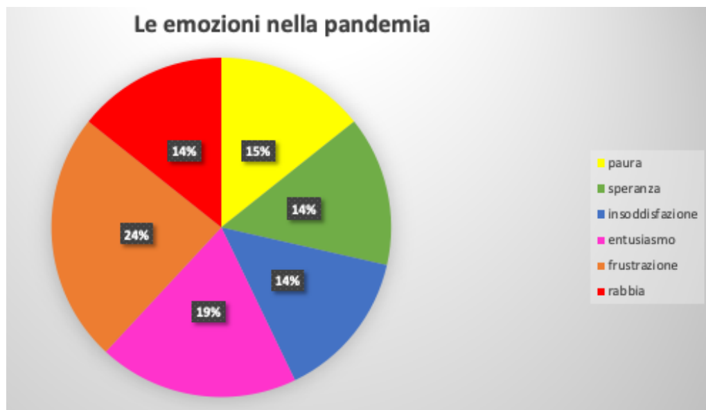
Figura 1 L'analisi quantitativa delle emozioni nel discorso sulla pandemia del covid19

do la situazione sembra migliorare) e la speranza che un giorno il coronavirus sparirà, la cura degli altri, l'empatia un tempo dimenticata, ora tutto questo è ritornato. Abbiamo analizzato le citazioni riportate nel testo, nel paragrafo dedicato all'atmosfera sociale, per quanto riguarda le emozioni rappresentateci, in particolare esaminando la loro frequenza, come si vede in Figura 1: