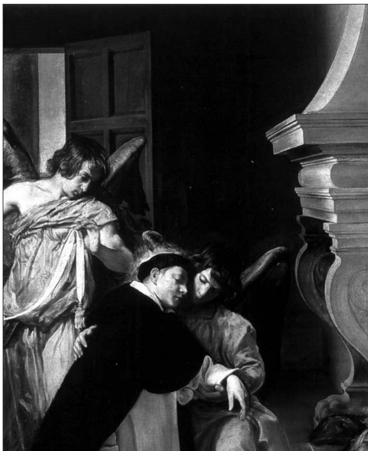
FOTO 3. Tentación de Santo Tomás de Aquino. Diego Velázquez. Año 1632-1633.

Así, se realizaron cuñas publicitarias de la región en TVE y Antena 3, se presentó la exposición en ferias de turismo de Inglaterra, Portugal y Alemania y se rodó un spot publicitario para ser emitido en Madrid y Valencia 12 , al tiempo que se presentaba la muestra por sus máximos responsables en Fitur 2002. Sin embargo, la mejor publicidad vino de la mano de los propios visitantes quienes transmitieron su entusiasmo a familiares y amigos a los que animaron a visitar Huellas. Sea como fuere, lo cierto es que esa afluencia masiva de público, que llegaba a la ciudad de Murcia para disfrutar de ese turismo cultural tan demandado en los últimos años y del que esta ciudad aún adolecía, tuvo repercusiones inmediatas en los ámbitos culturales y socioeconómicos de la región.