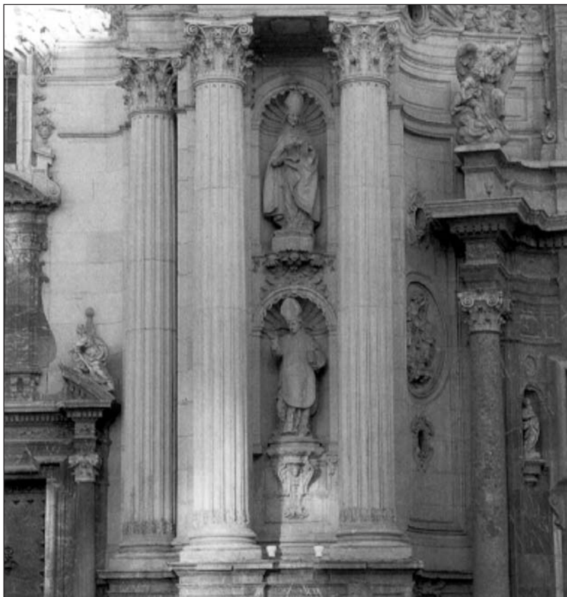
FOTO 1. Detalle de la fachada de la Catedral de Murcia.

Huellas en Murcia o La luz de las Imágenes inaugurada en Catedral de Valencia y continuada con las ediciones que actualmente se celebran en Orihuela y Segorbe.