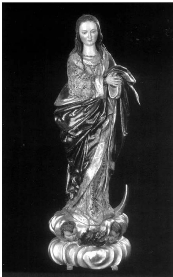
FOTO 5. Inmaculada. Taller de Pedro de Mena. 1655.