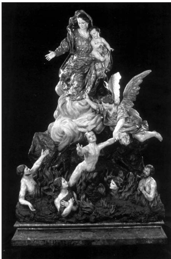
FOTO 2. Virgen del Carmen o de las Ánimas. Escuela de Salzillo. Siglo XVIII.