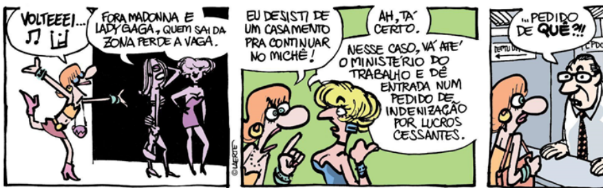
Figura 4. Laerte Coutinho. Historias de Muriel , 2020.

está recogida en el film Laerte-se (2017), dirigido por Lygia Barbosa y Eliane Brum.