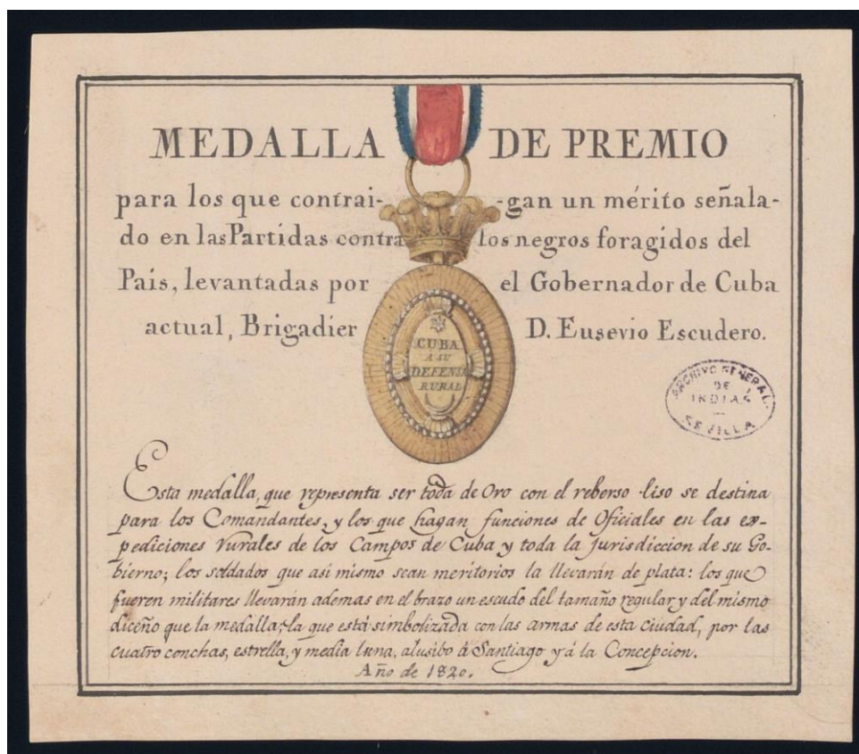
Fig. 2. Diseño original de medalla encontrado en el Archivo General de Indias en Sevilla, España. Según se desprende del documento, la medalla sería otorgada en Cuba a los soldados por capturar cimarrones en el año 1820 2 .

Desde el siglo XVI hasta casi finales del siglo XIX, en todo el continente Americano fue practicada la esclavitud de los negros africanos. Cuba, al igual que toda América (Puerto Rico incluido) fue parte del comercio trasatlántico de esclavos. La esclavitud pasaría a formar parte de la columna vertebral de la economía de las plantaciones azucareras españolas en el Caribe cuyos propietarios se dedicaban al comercio de dicho producto agrícola. La esclavitud se practicaba en la isla de Cuba desde principios del siglo XVI hasta que fue abolida por real decreto español en octubre 7, 1886. Además, la esclavitud desempeñó un papel importante en el desarrollo de la economía, principalmente en el sur, de las colonias británicas norteamericanas, de lo que más tarde se convertiría en los Estados Unidos de América. Así, dicha práctica tuvo un papel sumamente importante en el desarrollo económico del continente Americano.