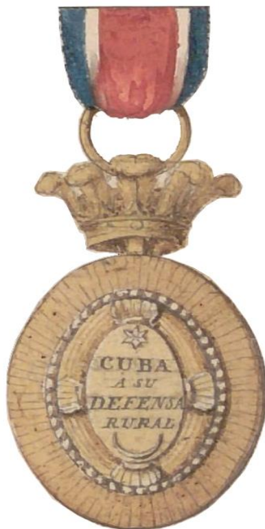
Fig. 3. Diseño original de medalla encontrado en el Archivo General de Indias en Sevilla, España. Esta medalla sería otorgada en Cuba a los soldados por capturar cimarrones en el año 1820; utilizando el programa Photoshop en la computadora, se recortó la medalla digitalmente del documento original, para que se pueda visualizar y apreciar mejor dicha medalla.

(figs. 2 y 3) por perseguir y capturar fugitivos (cimarrones) esclavos. Es un hecho conocido que, medallas y premios han tenido su origen en la necesidad de diferentes civilizaciones para honrar hechos o dar distinción a los individuos por sus acciones; siendo en general piezas metálicas, de ahí su nombre que proviene del italiano, medaglia 3 , y este del latín, medalia . Las medallas suelen ser de dimensiones manipulables y de diversas formas ornamentales.