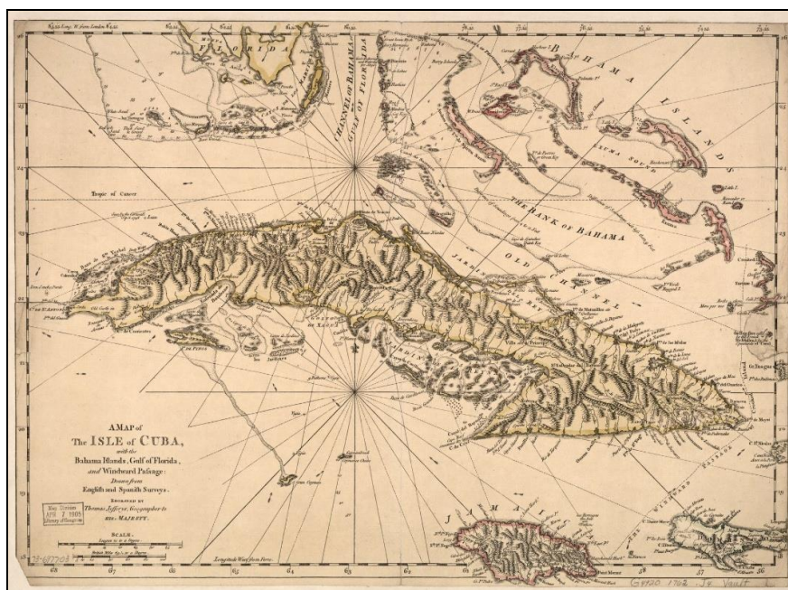
Fig. 1. Mapa de la Isla de Cuba encontrado en la Biblioteca del Congreso de los Estados Unidos (1762). Título original del mapa: “A map of the isle of Cuba, with the Bahama Islands, Gulf of Florida, and Windward Passage: Drawn from English and Spanish surveys” 1 .

Las fuentes auríferas en Cuba comenzaron a disminuir y ello coincidió con la fundación de las primeras casas de la moneda en América (cecas): la de México en 1535 y la de Santo Domingo 1542, por Orden Real del Emperador Carlos I de España. Fue durante el reinado de Felipe II, cuando por Real Cédula de 1556 arribaron a la Isla las embarcaciones españolas con las primeras remesas monetarias en metálico, procedentes de las cajas reales de México conocidos como el Situado Mexicano (Rodríguez Escandell 2018).