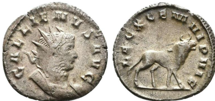
Fig. 4: Antoniniano proveniente de The Digital Coin Cabinet of Eichstätt University 141 (de https://numid.ku.de/object?id=ID147 ).

concepción o con la posición de la luna en el momento de su nacimiento 62 (Barbone 2013, 89-91; Besly y Bland 1983, 192; Geiger 2013, 213, 235; Manders 2012, 31, 288). Un caso similar al del capricornio lo tenemos con el toro, que aparece tanto de pie como caminando, asociado tanto a Sol (1 tipo) 63 , como a diversas unidades del ejército, como las legiones III, VI, VII, VIII y X (10 tipos) 64 (Fig. 4).