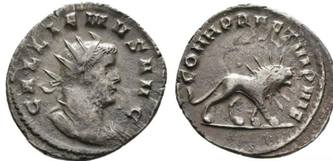
Fig. 1: Antoniniano proveniente de The Digital Coin Cabinet of Eichstätt University 135 (de https://numid.ku.de/object?id=ID141 ).

entre sus patas, asociado, como hemos visto, a Hércules (1 tipo) 42 , a las legiones IV, VII y IX (5 tipos diferentes) 43 , a las cohortes pretorianas VI y VII (3 tipos) 44 , a unas titulaturas imperiales concretas (4 tipos) 45 y a las iniciales S P Q R (1 solo tipo) 46 (Fig. 1).