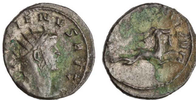
Fig. 3: Antoniniano de plata proveniente de la American Numismatic Society 1944.100.30331 (de http://numismatics.org/collection/1944.100.30331 ).