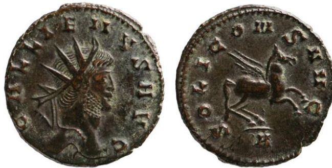
Fig. 2: Antoniniano proveniente del Münzkabinett Wien RÖ 19768 (de https://www.ikmk.at/object?id=ID71878 ).

Los siguientes 3 animales más representados en la numismática de Galieno, con 11 tipos diferentes y 12% del total cada uno, son el Pegaso, el capricornio y el toro. El Pegaso aparece en los reversos de diversas formas, de pie, galopando, saltando hacia el cielo o, incluso, volando, y lo hace asociado a Apolo (1 tipo) 51 , a Sol (5 tipos) 52 , a las legiones I y II (3 tipos) 53 , y, por último, a la leyenda ALACRITATI (2 tipos) 54 (Fig. 2).