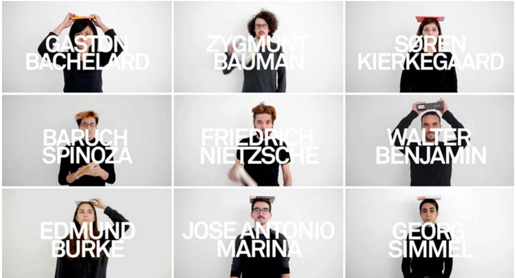
Figura 3. Marta Negre, Los referentes , 2016 (Fuente: http://martanegre.com/index.php/work/los-referentes-2016/ ).