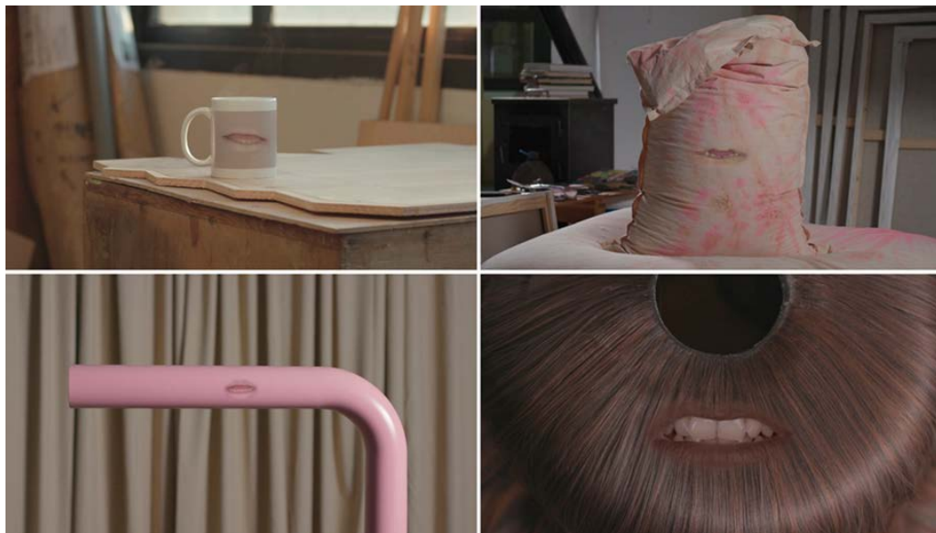
Figura 11. Lúa Coderch, Vida de O. , 2018.