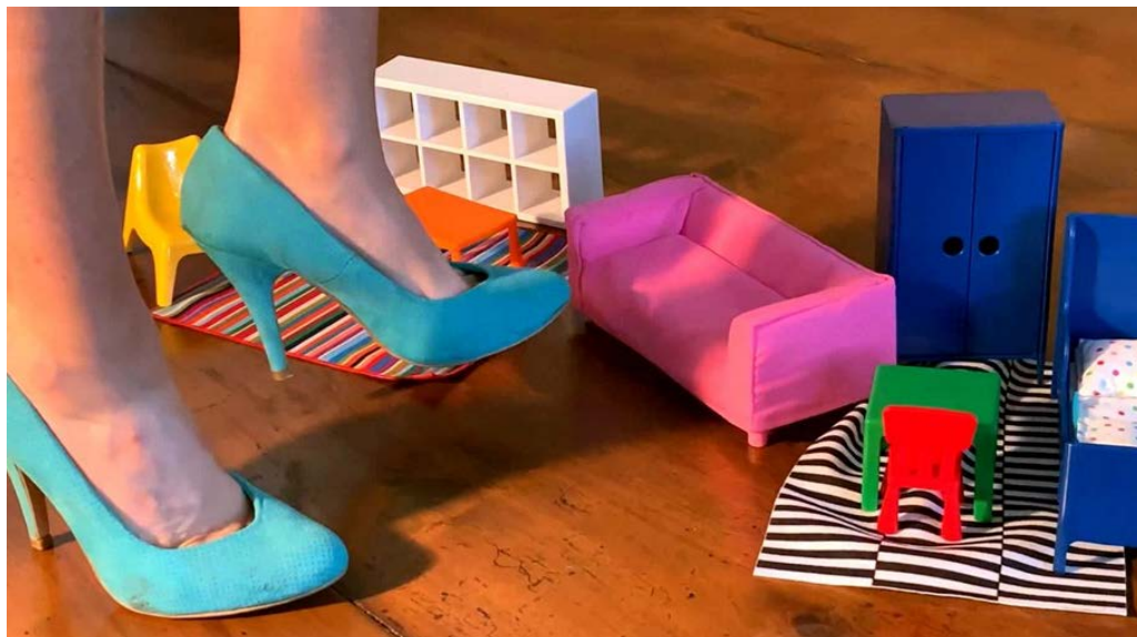
Figura 10. Estíbaliz Sádaba, Subversiones domésticas (2020). (Fuente: https://aresvisuals.net/fichas/87_sadaba_estibaliz/ )