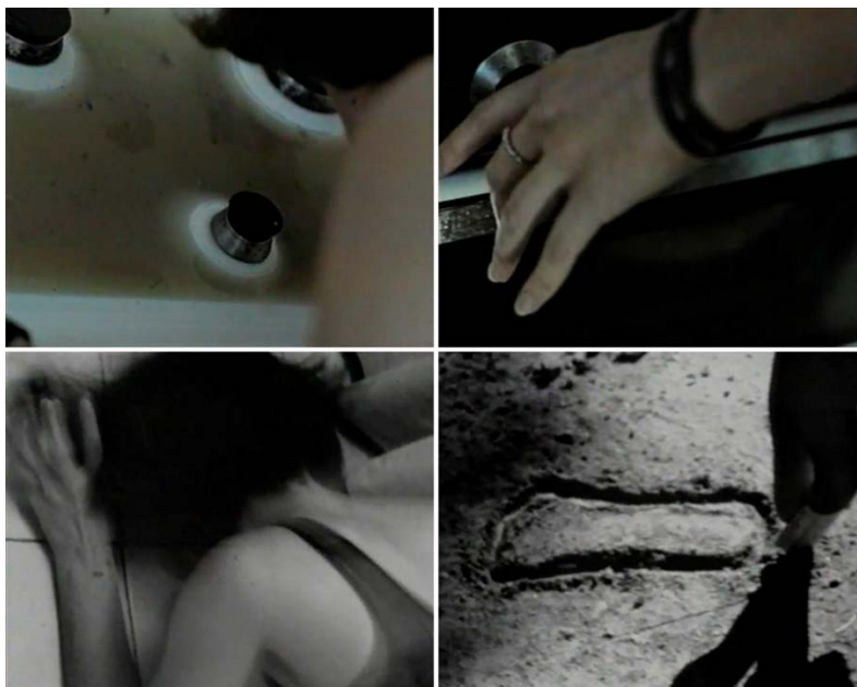
Figura 6. Virginia Villaplana, Alicia bajo cero , 1998.

En el videoarte feminista español uno de los trabajos pioneros que asume el reto de presentar a una mujer diversa, compleja, múltiple, fue el de Virginia Villaplana, Alicia bajo cero (1998) ( Figura 6 ) –obra perteneciente a la trilogía Narrativas disidentes junto con Mujer trama (1996) y Nuit. Not even so (Ni por ésas). Largometraje experimental (2002)–. Se trataba de una serie de vídeo-ensayos en los que participaban la escritura poética y la producción visual de los cuerpos con la música electrónica. Como repulsa a la imagen mediática del cuerpo femenino canónico, la artista reduce el carácter especular al mínimo, incluso utilizando el blanco y negro. En el inicio, el sonido de una caja de música, un poema y unas fotografías que parecen de un álbum familiar desencadenan secuencias a través de rotaciones circulares en las que, a través de imágenes fijas, intuimos que un cuerpo femenino. Un cuerpo en muchas ocasiones fragmentado, agachado, de espaldas, que transita desde la cama a la cocina o al suelo, transmitiendo una mezcla de deseo y desamparo. Este trabajo engarza con la posterior trayectoria de la artista, escritora y documentalista, en la que se hace recurrente la voluntad de concebir la memoria como una narrativa intersubjetiva, abierta a posibles reescrituras.