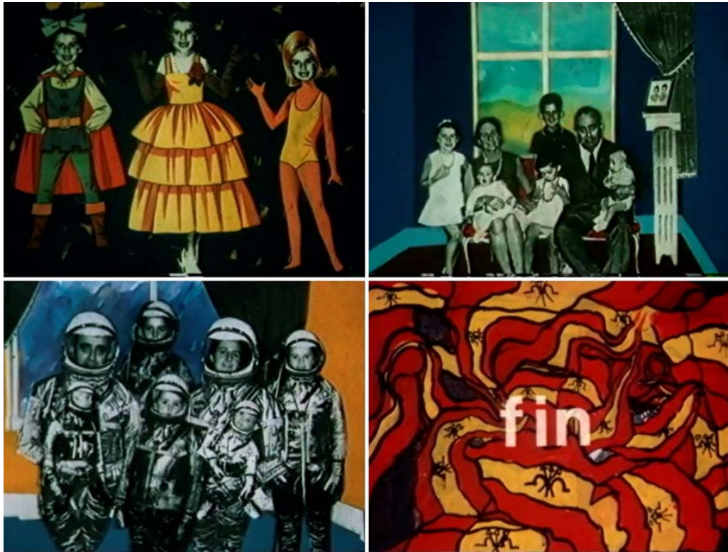
Figura 4. Isabel Herguera, Spain loves you , 1988 (Fuente: https://aresvisuals.net/fichas/52_herguera_isabel/ ).

o la muerte de Franco. En su relectura revisa la historia de España desde el nacimiento de los dos hermanos de la autora hasta la muerte del dictador a través de imágenes icónicas en las que toda una generación se siente reconocida. Se trata entonces de un trabajo autobiográfico y experimental que da continuidad a su posterior trayectoria marcada por la idea del viaje como metáfora de su quehacer experimental en el mundo de la creación audiovisual.